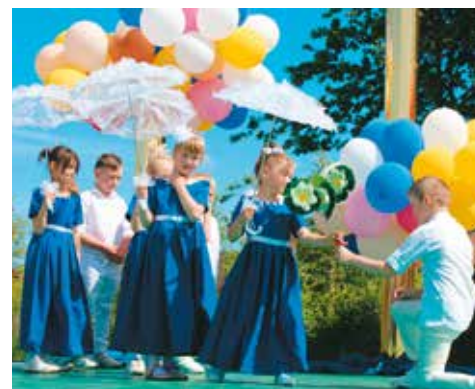
Występy artystyczne dzieci podczas festynu