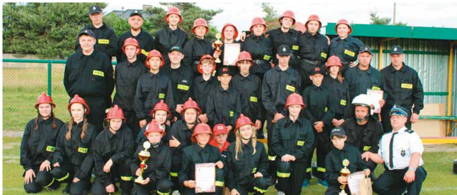
Jednostka OSP Chojećin