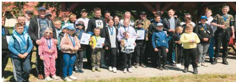
Uczestnicy Zawodów Wędkarskich