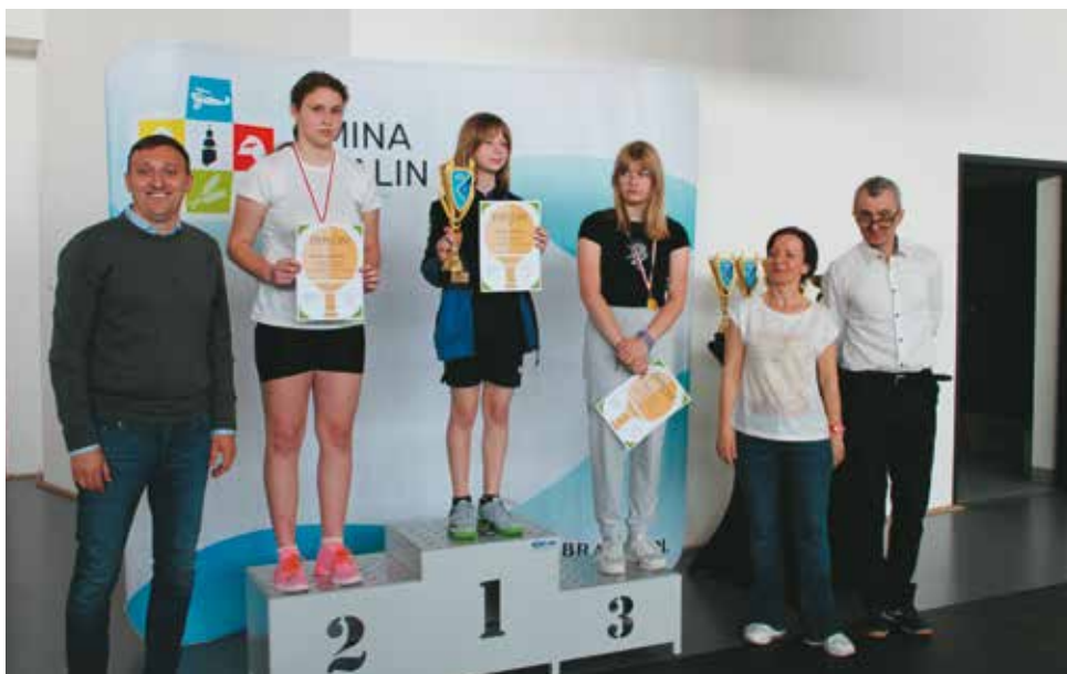
Wręczenie pucharów i pamiątkowych dyplomów