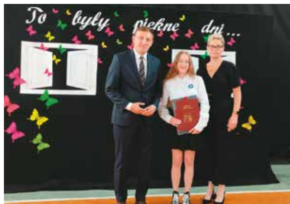
Nagroda Najlepszego Absolwenta Roku w Zespole Szkół w Nowej Wsi Książęcej

Bralińską podstawówkę ukończyło 81 uczniów, a Zespół Szkół w Nowej Wsi Książęcej 24. Przedszkole „Kwiaty Polskie” w Bralinie pożegnało 56 sześciolatków.