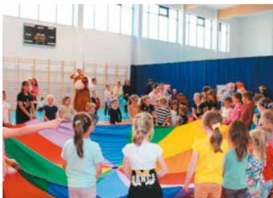
red. Wspólne zabawy rekreacyjno-sportowe na hali

Gmina Bralin i Biblioteka Publiczna w Bralinie zaplanowały szereg atrakcji dla najmłodszych. Zajęcia odbywały się na hali sportowej w Bralinie. W Przedszkolu „Kwiaty Polskie” zorganizowany został festyn rodzinny. Organizatorem festynu była Rada Rodziców Orzedszkoła „Kwiaty Polskie” i Żłobka „Wiosenka” w Bralinie.