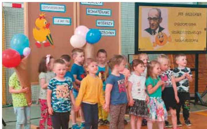
Przedszkolaki podczas występów