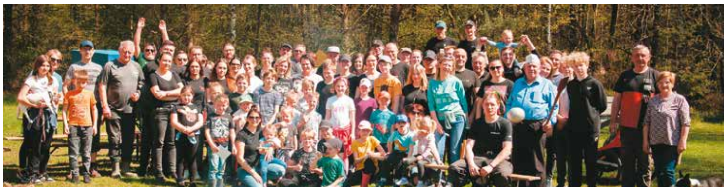
Wspólne zdjęcie uczestników akcji sprzątania lasu.