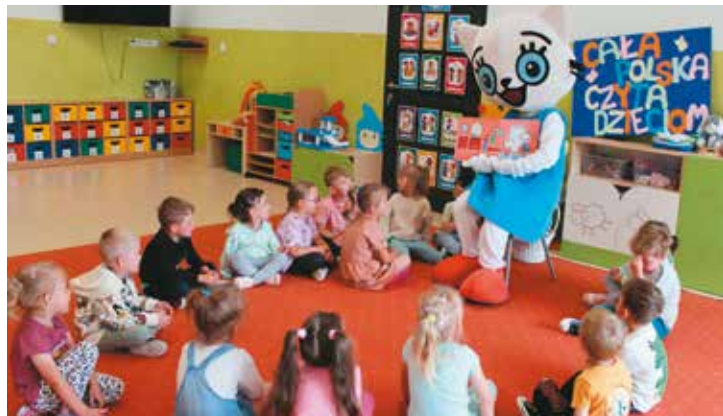
Kicia Kocia w Przedszkolu „Kwiaty Polskie”