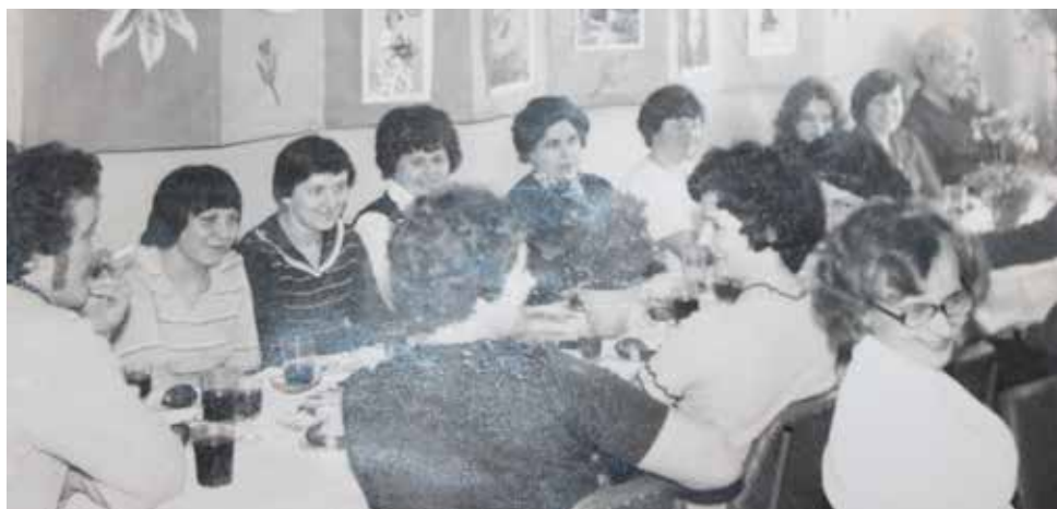
Dzień Kobiet w Kole Gospodyń

i szycia, uprawy działek i ogrodów warzywno-kwiatowych, pogadanki z lekarzami. Panie współpracowały z Wojewódzkimi Ośrodkami Doradztwa Rolniczego, zajmowały się rozprawdaniem piskląt, itp.