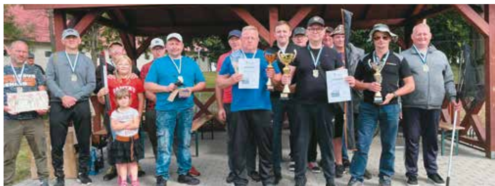
Uczestnicy seniorskich Zawodów Wędkarskich