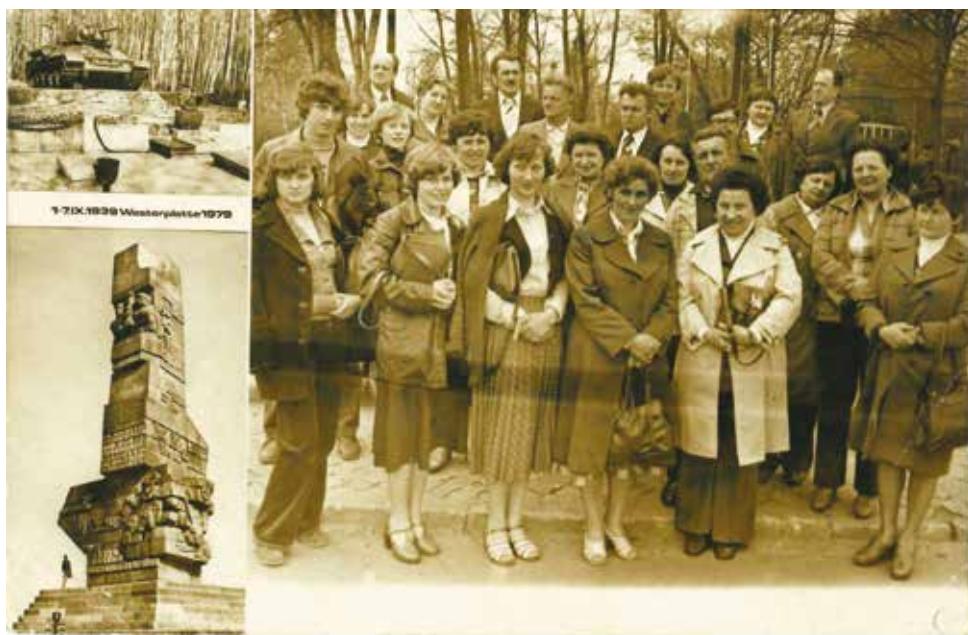
Wyjazdy Kół Gospodyń Wiejskich