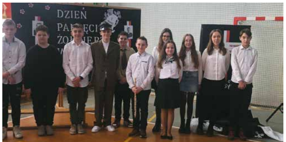
Akademia w Zespole Szkół w Nowej Wsi Księżęcej

red. za autorem tekstu źródłowego A. Hetmańczyk