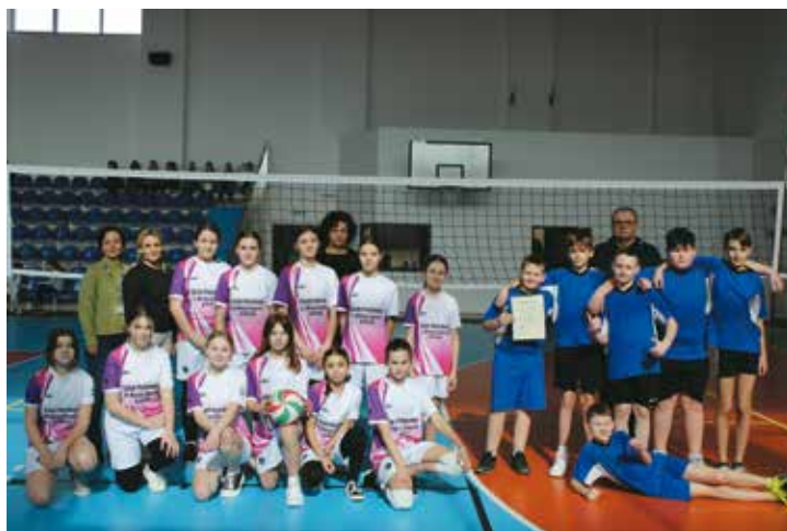
Reprezentacja SP Bralin