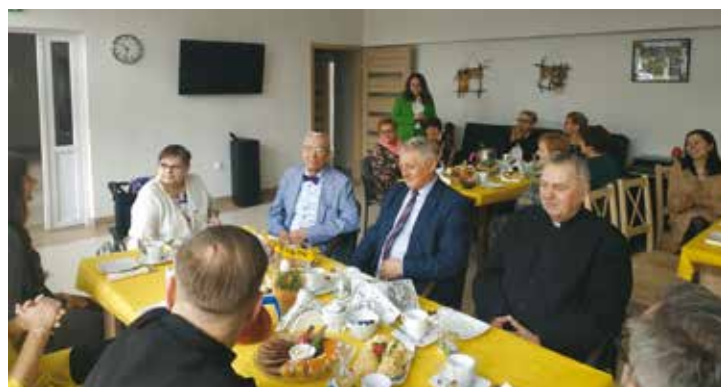
red. Śniadanie Wielkanocne w Klubie Senior+ w Bralinie