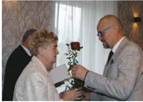
Jubilaci - Przewodniczący Rady Gminy Bralin