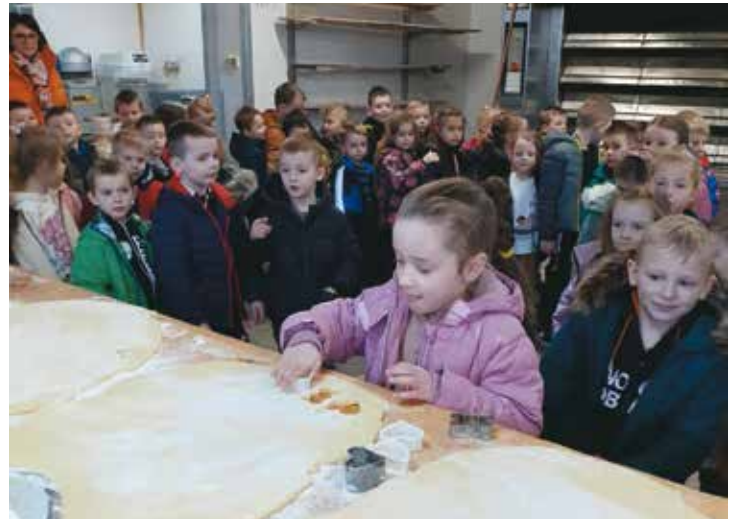
Przedzkolaki w piekarni „Camargo”