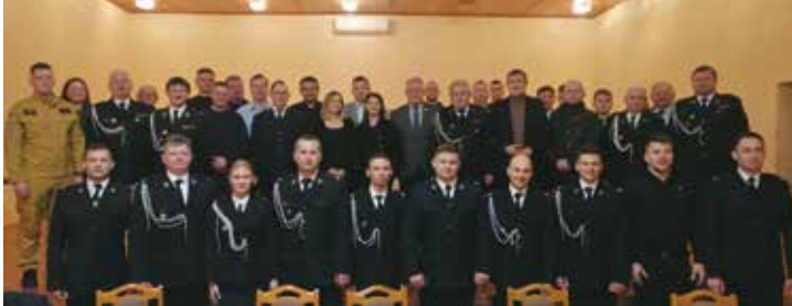
Zebranie OSP w Nowej Wsi Książęcej