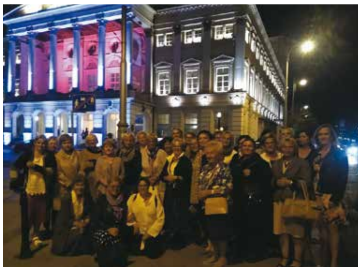
Członkinie KGW Bralin