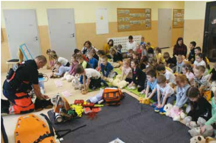
Spotkanie z ratownikiem medycznym