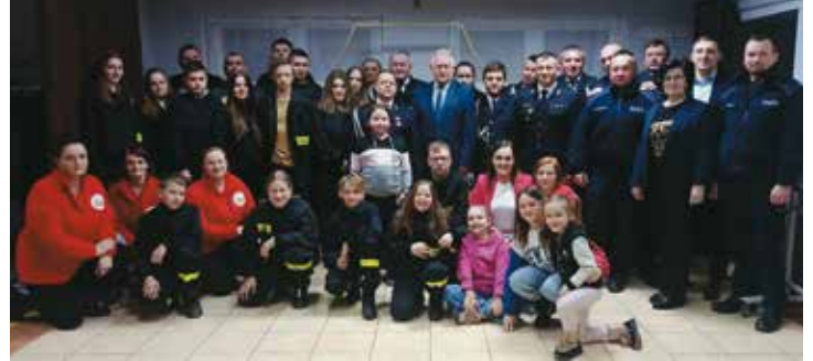
Zebranie OSP w Chojęcinie