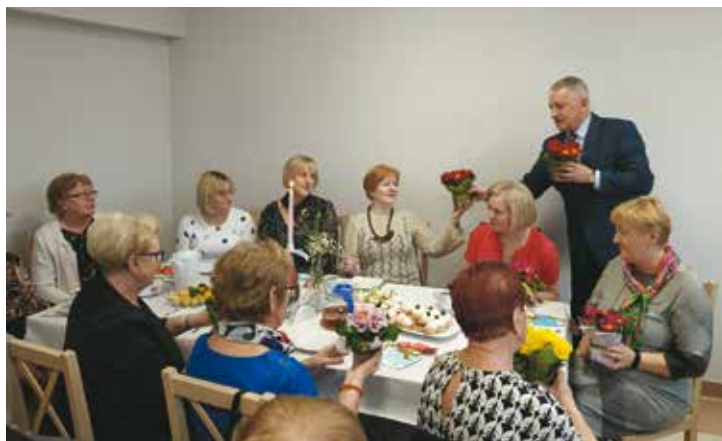
Seniorki świętowały Dzień Kobiet