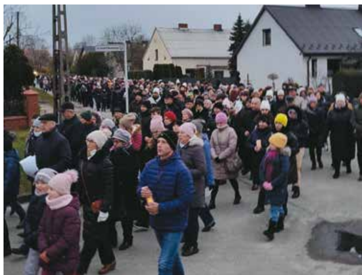
Mieszkańcy licznie zgromadzeni na Drodze krzyżowej