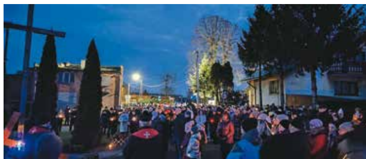
Droga krzyżowa ulicami Bralina