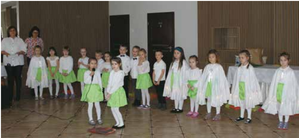
Występ dzieci z przedszkola „Kwiaty Polskie” w Bralinie

Żadna mądrość, której możemy nauczyć się na ziemi, nie da nam tego, co słowo i spojrzenie matki - Wilhelm Raabe