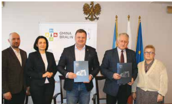
Podpisanie umowy na transport zbiorowy

W środę 29 marca 2023 r. zawarto stosowne porozumienie w zakresie organizacji publicznego transportu zbiorowego w przewozach pasażerskich o charakterze użyteczno-