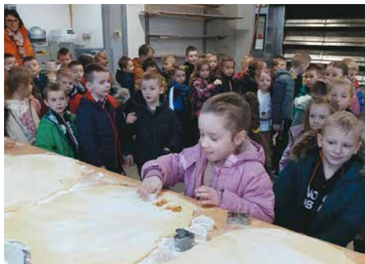
Przedzkolaki w piekarni „Camargo”