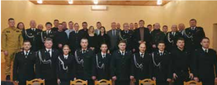
Zebranie OSP w Nowej Wsi Książęcej