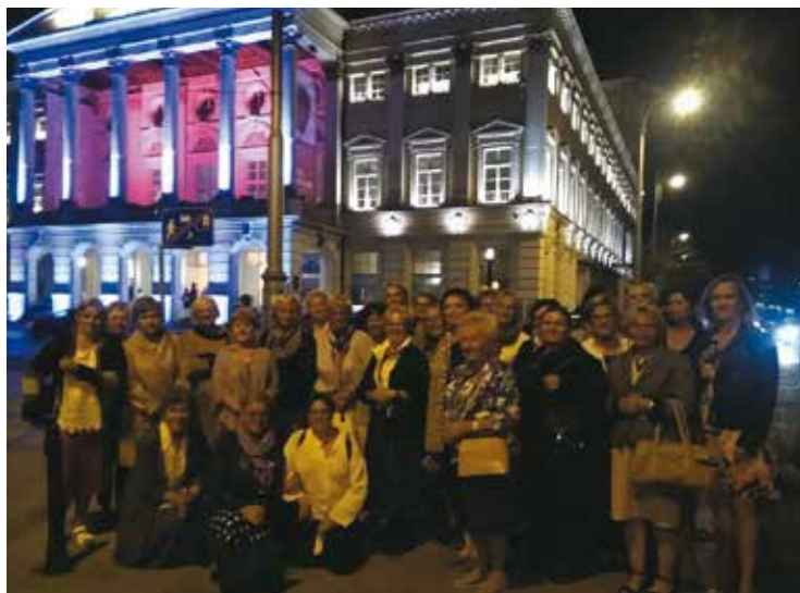
Członkinie KGW Bralin