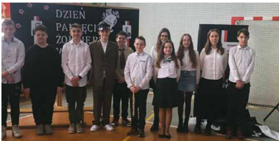
Akademia w Zespole Szkół w Nowej Wsi Księżęcej