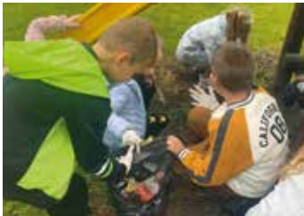
Uczniowie w trakcie sprzątania

W poniedziałek, 26 września, uczniowie szkoły w Nowej Wsi Książęcej włączyli się do działań zorganizowanych w ramach kampanii „Sprzątanie świata”. Posprzątali teren wokół szkoły oraz najbliższą okolicę.