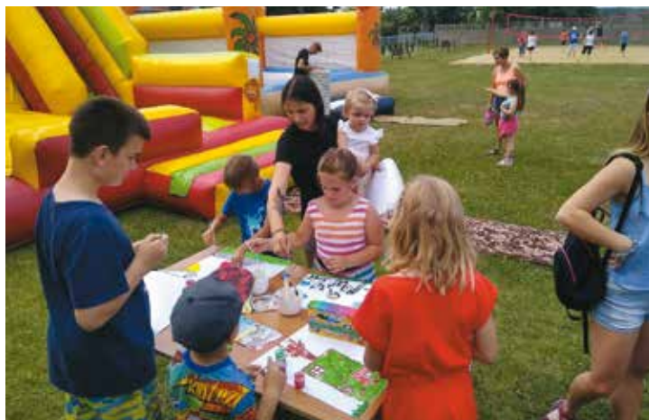
Festyn kulturalny „W rodzinie siła”