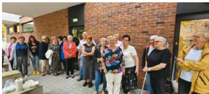
Integracja Pod Żurawiem