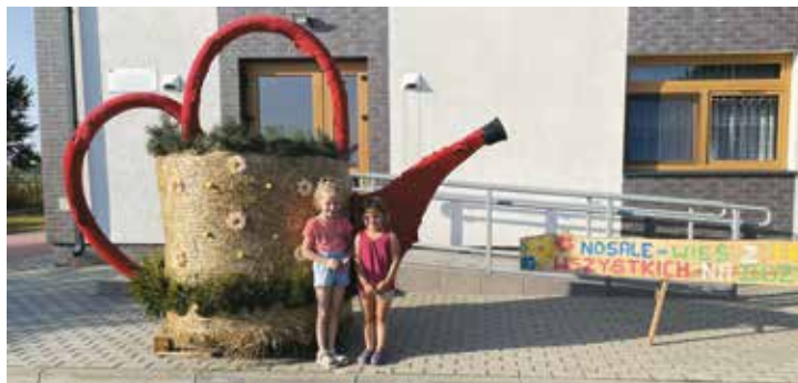
Dożynki w Nosalach – KGW Nosale