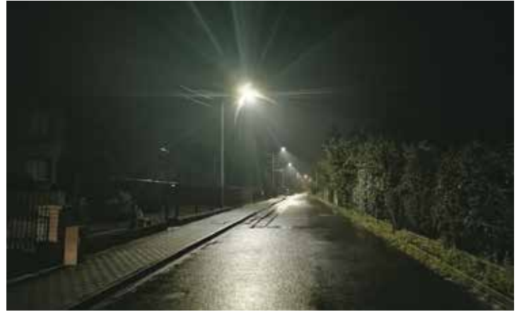
Oświetlenie na ul. Nowej w Bralinie