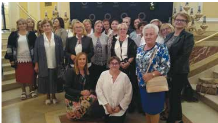
Mieszkańcy gminy Bralin w Operze Wrocławskiej