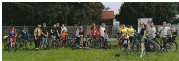
Cross rowerowy - KGW Chojeńcin