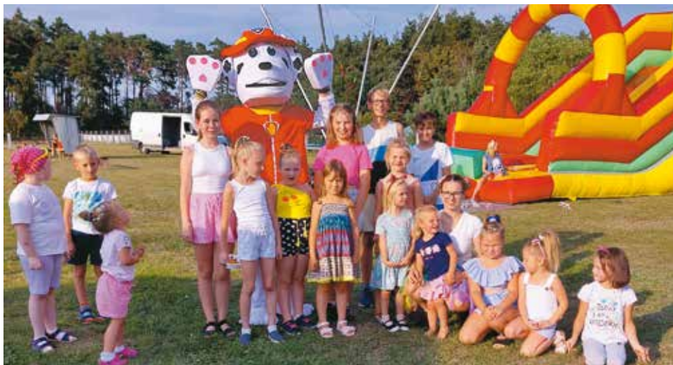
Festyn „Żyj zdrowo i sportowo” – KGW Gola