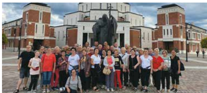
Szlakiem św. Jana Pawła II

Ze środków gminnych skorzystało Koło Gospodyń Wiejskich w Chojeńcinie, które zorganizowało cross rowerowy.