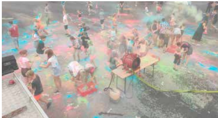
Festiwal Kolorów – KGW Chojęcín