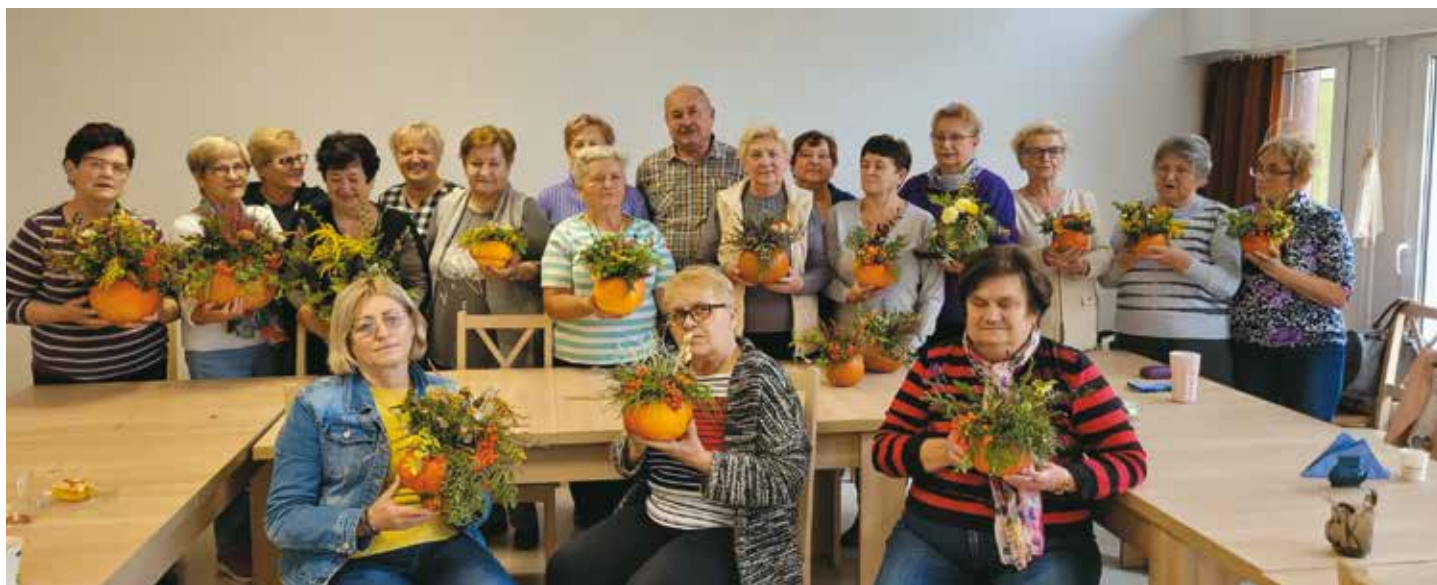
Jesienne dekoracje w Klubie Senior+ – szczegóły na str. 11