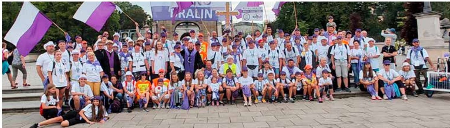
Kępińsko-Bralińska Piesza Pielgrzymka na Jasnej Górze