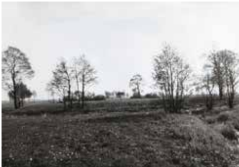
Widok grodziska od strony północnej

W ramach akcji weryfikacji reliktywów po średniowiecznych założeniach obronnych w 1986 r. przeprowadzono prace terenowe w Bralinie. Przedmiotem badań był nieznany dotychczas w literaturze, nasyp ziemny oznaczony jako Bralin, leżący na arkuszu Archeologicznego Zdjęcia Polski nr 76-37. Nasyp znajduje się około 500 m na południowy zachód od miejscowości Bralin, wśród podmokłych łąk, położonych nad niewielkim ciekim zwanym Czarną Widawką. Jest to porośnięte trawą, płaskie i nieznacznie w środku obniżone wyniesienie, o formie owalu, otoczone widocznymi i częściowo jeszcze mokrymi reliktywami dookólnego rowu – fosy o szerokości dochodzącej do około 7 m. Wysokość nasypu sięga 1,5 m. Płaskość opisywanej formy terenowej i nieznaczne zakłębienie jego środkowej partii spowodowało, że określone ono zostało jako tzw. grodzisko pierścieniowate.