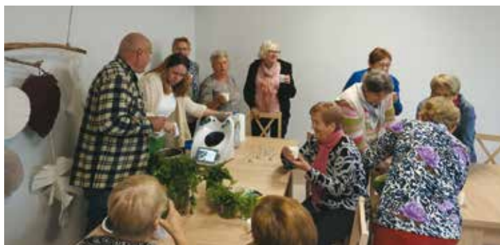
Przyrządzanie napoju z pietruszki i pokrzywy