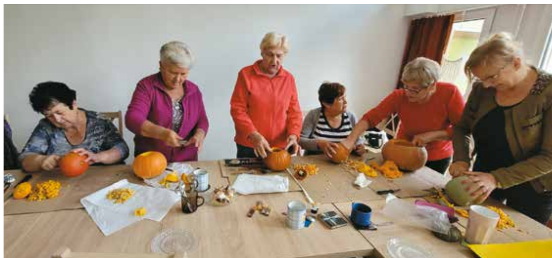
Tworzenie jesiennych kompozycji

Seniorzy w Klubie Senior+ nie mogą narzekać na nudę, każdy znajdzie tu coś dla siebie. Wszystkie działania Klubu mają na celu integrację oraz wspólne aktywne spędzanie czasu wolnego.