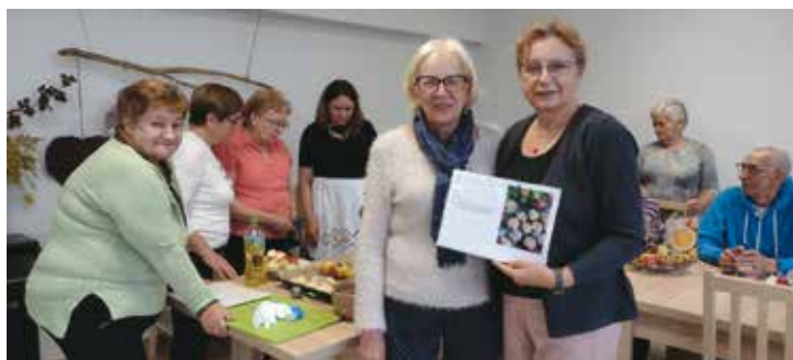
Dzień Jabłka w Klubie Senior+