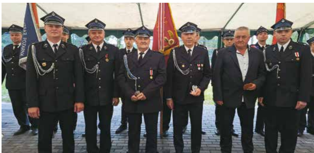
Druhowie z jednostki OSP w Czerminie