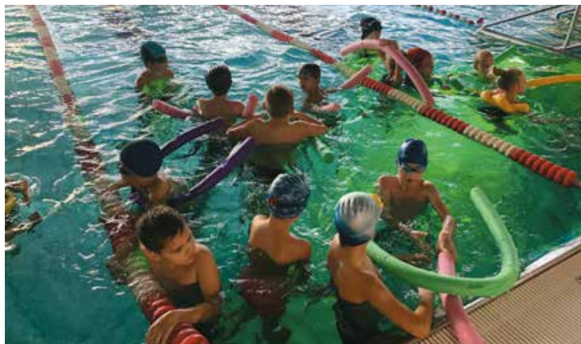
Zajęcia na basenie QARIUM Kępno