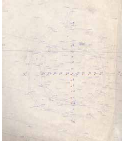
Rzut poziomy grodziska z naniesionymi odwiertami

informuje o intensywnym osadniczym użytkowaniu obiektu. Wykop eksplorowano warstwami mechanicznymi o miąższości 20 cm i w ich obrębie zbierano materiał zabytkowy.