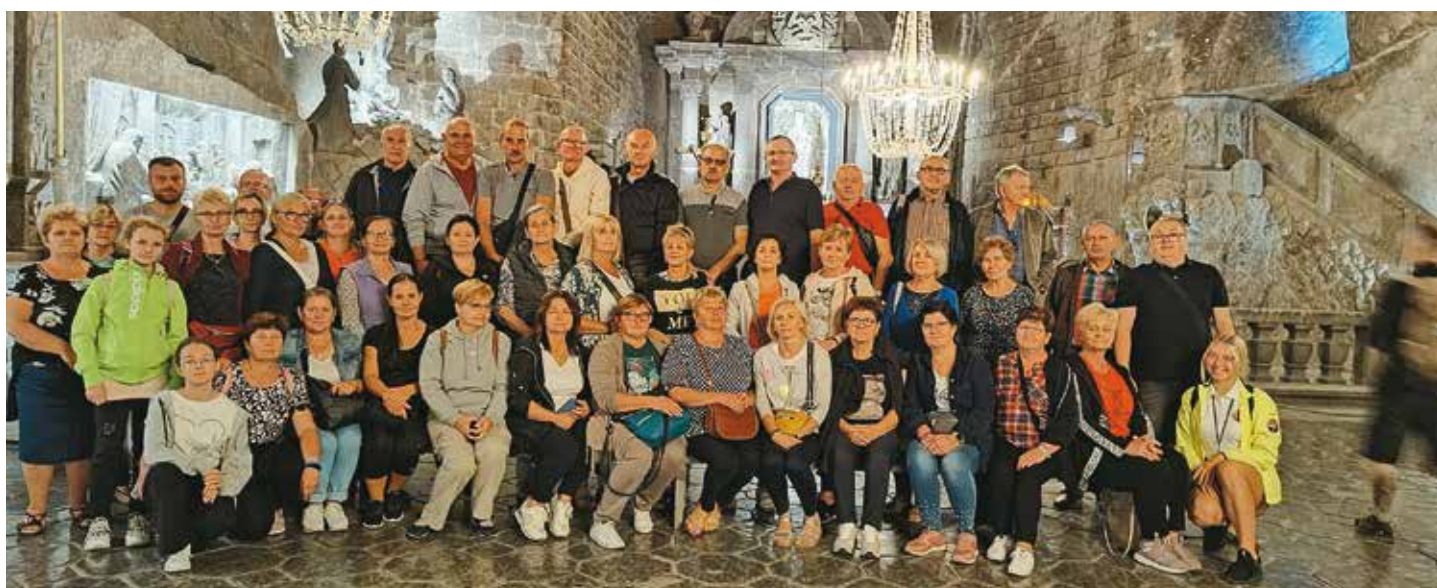
Szlakiem św. Jana Pawła II – szczegóły na str. 9