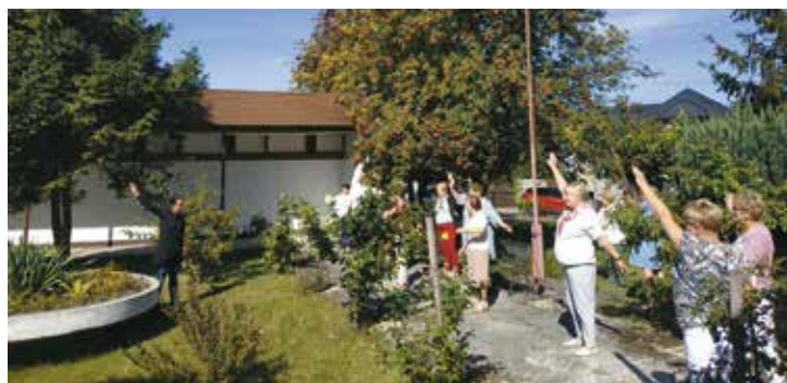
Zajęcia z terapii oddechowej w Klubie Senior+