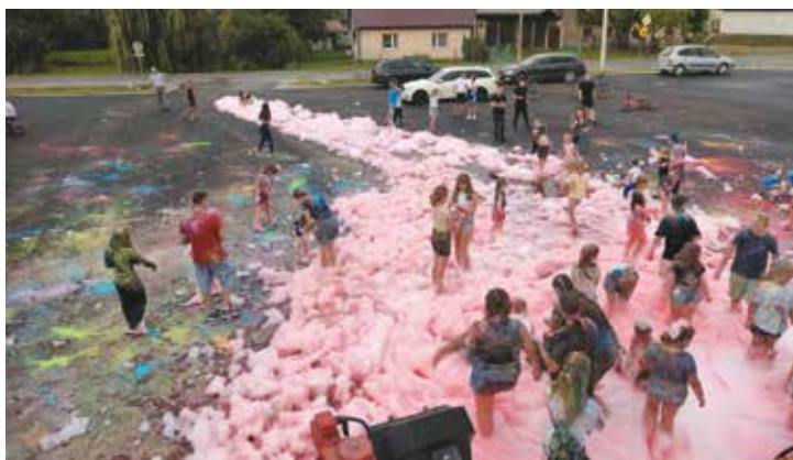
Piana Party – KGW Chojęcín