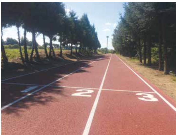
Bieżnia lekkoatletyczna przy stadionie sportowym w Bralinie