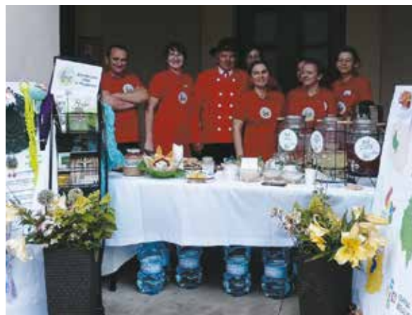
red. KGW Choęcina w Warszawie

Koło Gospodyń Wiejskich w Choęcinnie uczestniczyło w kolejnej edycji Sceny Letniej organizowanej przez Narodowy Instytut Kultury i Dziedzictwa Wsi. Celem imprezy, która odbyła się na Krakowskim Przedmieściu w Warszawie, było popularyzowanie kultury i sztuki ludowej. Członkinie Koła z Choęcina przygotowały tradycyjne potrawy wielkopolskie, takie jak: sznoka z glancem, pyry z gzikiem, szagówki z boczkiem i kapustą zasmażaną, chleb ze smalcem oraz soki z owoców i ziół. Na Scenie Letniej Koło zaprezentowało obrazy wyszywane haftem krzyżykowym, serwetki wykonane techniką snutki wielkopolskiej, wełniane lalecзки, makramy, kolczyki frywolitkowe oraz żywe kwiaty. Udział w wydarzeniu był dla Koła wyróżnieniem, ponieważ znalazło się ono w gronie trzech Kół z terenu województwa wielkopolskiego, które zaproszono do udziału w tym wydarzeniu.