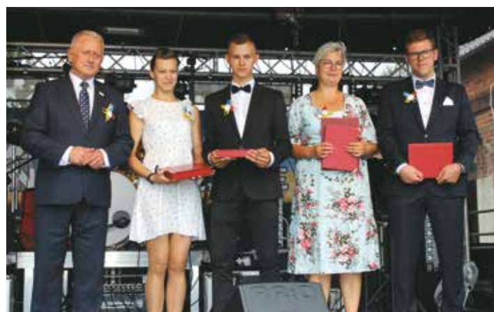
Wójt gminy Bralin, starostowie dożynekowi, sołtysi Weronikopola i Taboru Małego

Po nabożeństwie barwny korowód wozów dożynekowych przejechał z Mielęcina do Taboru Małego. Podczas części oficjalnej delegacje z poszczególnych 12 sołectw gminy Bralin i 4 delegacje z parafii Parzynów przekazały władarzowi gminy Bralin plony z tegorocznych zbiorów. Starostowie dożynekowi przekazali bochen chleba, którym gospodarze dożynek podzielili się ze wszystkimi uczestnikami Święta Plonów.