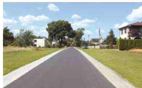
Zmodernizowana droga w Taborze Wielkim