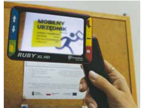
red. Lupa elektroniczna

ułatwiający obsługę klientów niedo-słyszących i niewidomych. Zakupiono lupę elektroniczną, ramki do podpisu, pętle indukcyjne, które wzmacniają działanie aparatu słuchowego, pomagając porozumieć się z osobą słabosłyszącą. Na drzwiach zamontowano tabliczki informacyjne w alfabecie Braille'a oraz tabliczki z wypukłym piktogramem do oznakowania drzwi toalety.