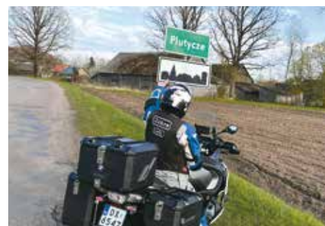
Iskra Lady w Plutyczach

M.K.: Łączą nas motocykle i to, co z nimi związane. Każdy z nas jest nieźle zakręcony na tym punkcie. Mamy wspólne tematy i często prowadzimy bardzo długie rozmowy o motocyklach, o wyprawach, spotkaniach integracyjnych, w których biorą udział również członkowie naszych rodzin. Zawsze staramy się, by panowała między nami jedyna w swoim rodzaju przyjaźń i zgoda. Łączy nas LWG – prosty gest podniesienia lewej ręki, gdy napotykamy się na trasie. Prawą rękę trzymamy na manetce od gazu, dlatego nie możemy sobie pozwolić na podniesienie tej dłoni. „Lewa w Górę” to nie tylko pozdrowienie, ale przede wszystkim