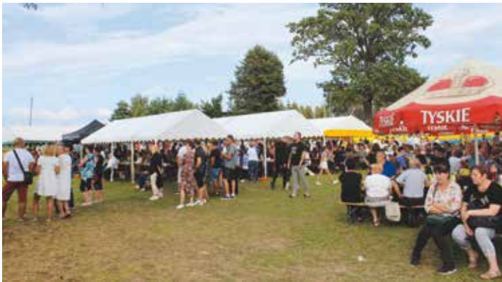
Uczestnicy dożynek gminno-parafialnych