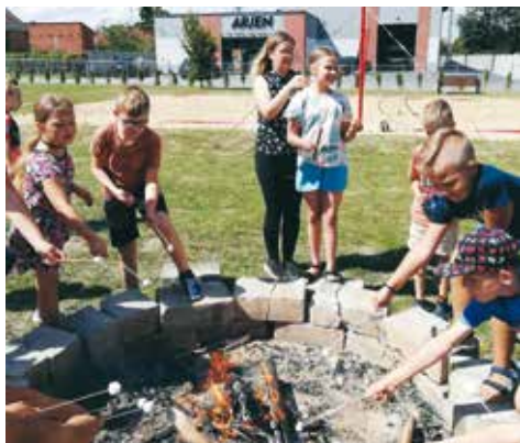
Wspólne pieczenie pianek