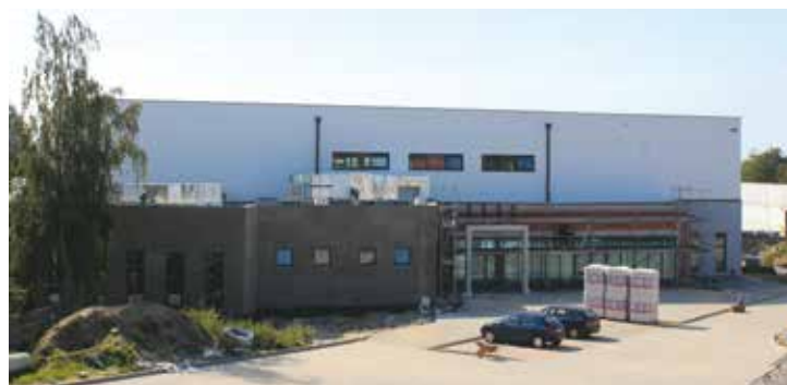
Prace budowlane przy hali sportowej