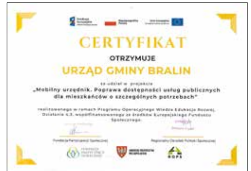
red. Certyfikat Mobilny Urzędnik

Urząd Gminy Bralin uzyskał certyfikat „Mobilny Urzędnik. Poprawa dostępności usług publicznych dla mieszkańców o szczególnych potrzebach”. Usługa, której udostępnienie w Bralinie potwierdza ten dokument, ma na celu likwidację barier dla osób niepełnosprawnych w załatwianiu spraw urzędowych. Mobilny Urzędnik w Urzędzie Gminy Bralin dostępny jest od 1 stycznia 2022 roku. Z usługi mogą korzystać mieszkańcy gminy Bralin, będący osobami o szczególnych potrzebach, w tym osoby niepełnosprawne, osłabione chorobami, starsze (powyżej 65. roku życia), zależne (powyżej 15. roku życia), które z powodu deficytów zdrowotnych, z czasowym lub trwałym ograniczeniem możliwości poruszania się, nie mogą dotrzeć do urzędu w celu załatwienia ważnej sprawy.