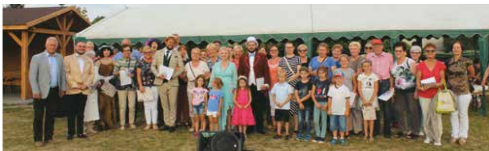
red. Stowarzyszenie Operetka Wrocławska z publicznością

Stowarzyszenie Operetka Wrocławska na Wynos po raz drugi przybyło do gminy Bralin. Tym razem w plenarowej scenerii przy świetlicy „Tęcza” zabrzmiały największe przeboje polskiej piosenki dwudziestolecia międzywojennego, takie jak: „Zimny drań”, „Umówiłem się z nią na 9”, „Brunetki, blondynki” i wiele innych.