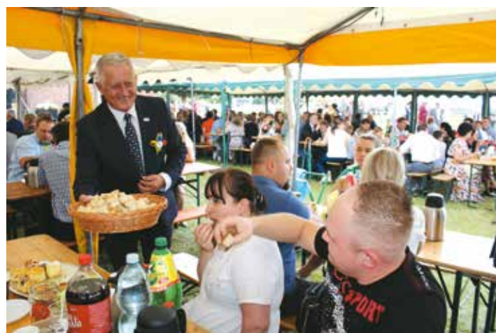
Wójt gminy Bralin dzieli się chlebem z mieszkańcami