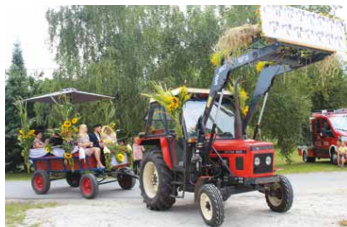
Sołectwo Chojęcin-Parcele – najładniejszy wóz dożynekowy