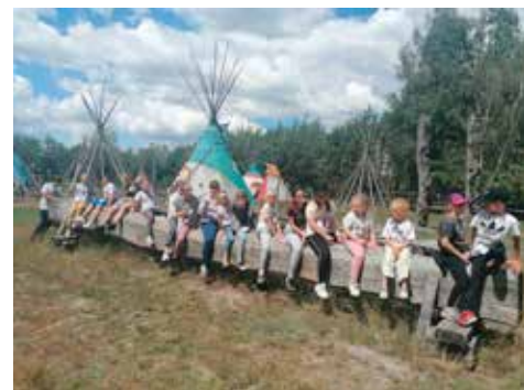
Westernland z Wioską Indiańską w Choczu