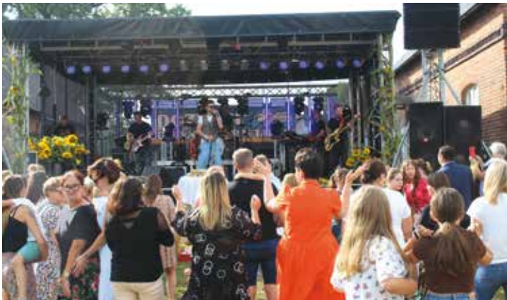
Koncert Łukasza Zagrobelnego