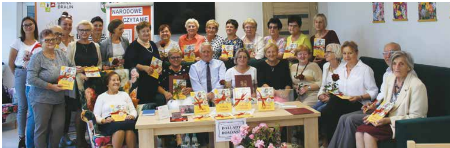
Uczestnicy Narodowego Czytania w Gminie Bralin