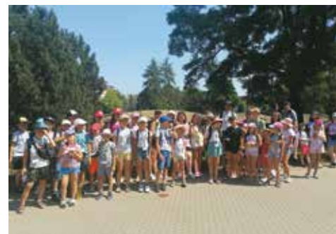
Wycieczka do wrocławskiego ZOO