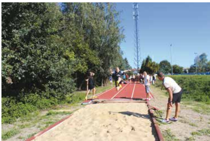
Pierwsze zajęcia lekkoatletyczne