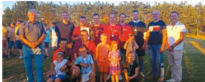
Sołectwo Bralin – I miejsce

W niedzielę 31 lipca już po raz drugi odbyły się piłkarskie zmagania sołectw z terenu gminy Bralin. Do głównych celów turnieju należały integracja sołectw, aktywizacja społeczeństwa lokalnego, propagowanie kultury fizycznej, a przede wszystkim dobra zabawa. W zawodach wzięło udział 10 drużyn.