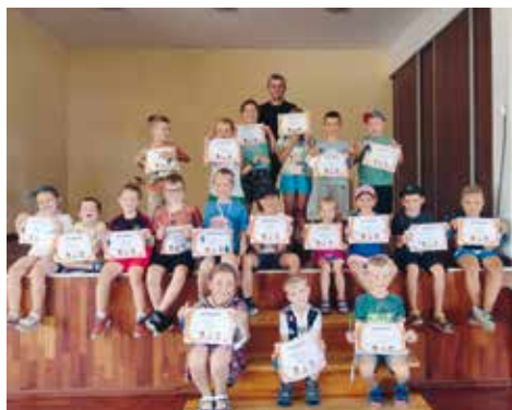
Laureaci zmagania sportowych