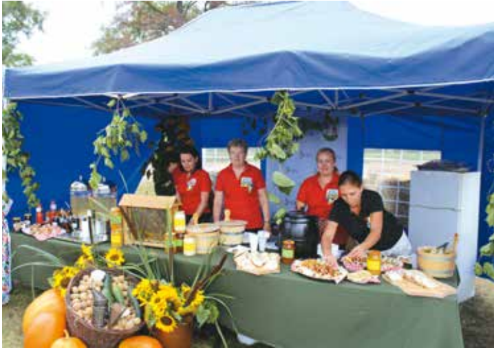
Prezentacja produktu lokalnego Kół Gospodyń Wiejskich z terenu gminy Bralin