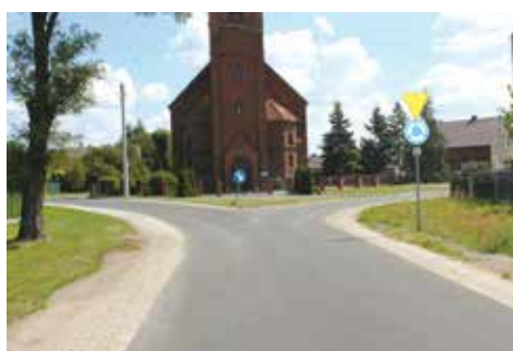
Droga przy kościele w Taborze Wielkim

Zakończyła się inwestycja modernizacji drogi gminnej w Taborze Wielkim. Nową nawierzchnię ułożono na długości ok. 2,3 km. Wyprofilowano i umocniono pobocza kamieniem łamanym po obu stronach jezdni. Całość zadania w znacznym stopniu poprawi stan długiego odcinka drogi gminnej i zapewni bezpieczeństwo użytkownikom ruchu drogowego. Koszt inwe-