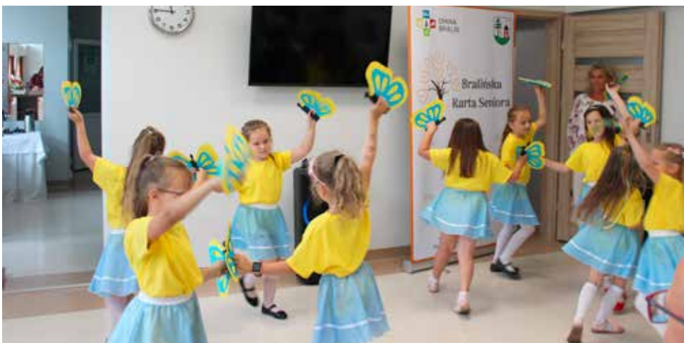
Część artystyczna w wykonaniu klas „0”

Zadanie współfinansowane jest w ramach programu wieloletniego „Senior+” na lata 2021-2025.