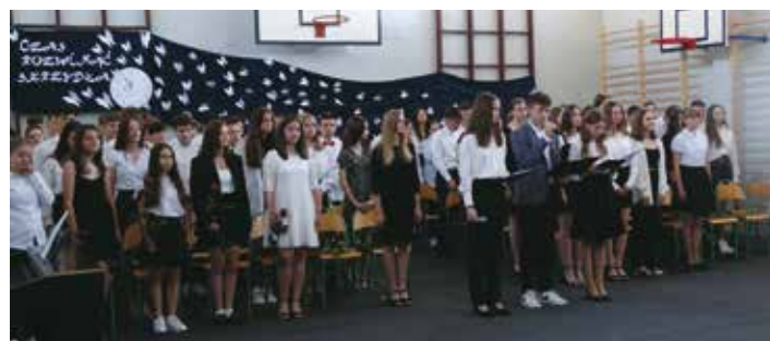
Zakończenie klas 8