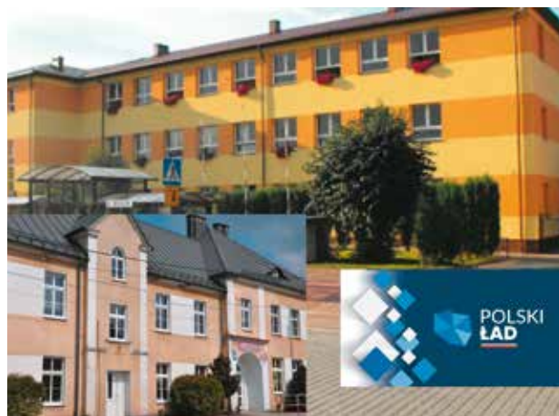
Placówki oświatowe gminy Bralin