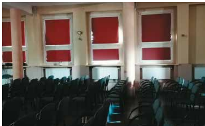
Aktualny stan Świetlicy Profilaktyczno-Środowiskowej „Tęcza” przed remontem