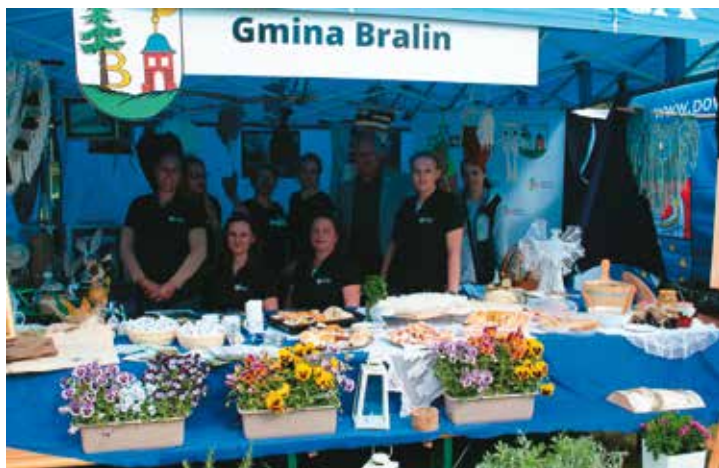
Prezentacja stoiska gminy