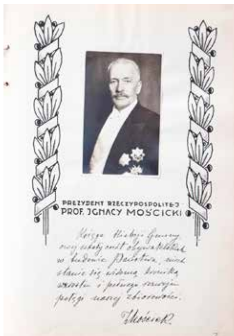
Strona 7 Kroniki Gminnej