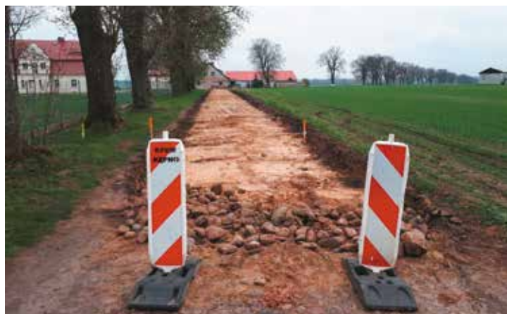
Rozpoczęte roboty drogowe

URZĄD MARSZAŁKOWSKI WOJEWÓDZTWA WIELKOPOLSKIEGO