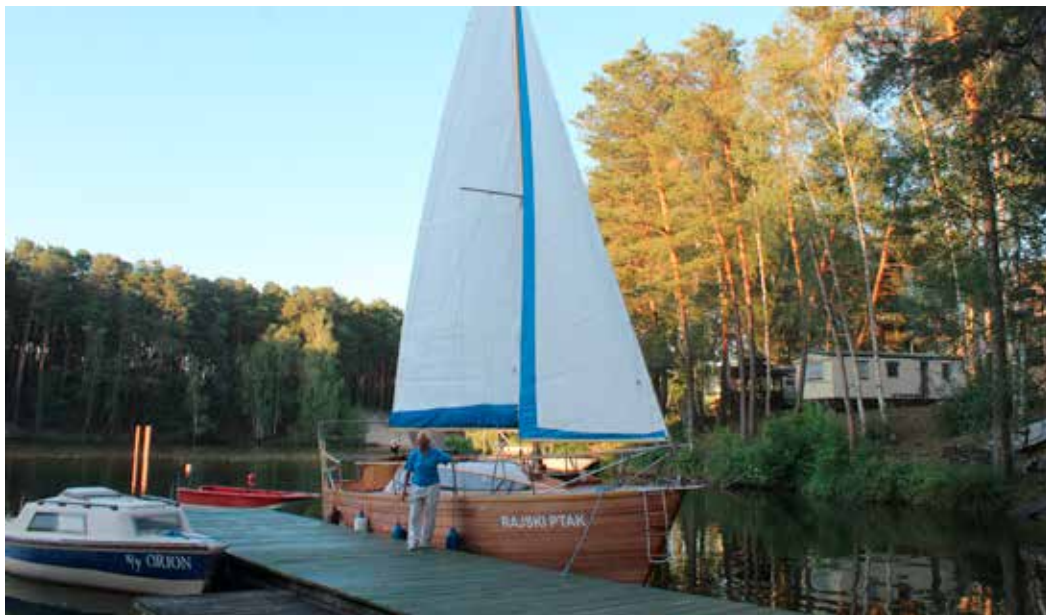
Nowozbudowany jacht Rajski Ptak