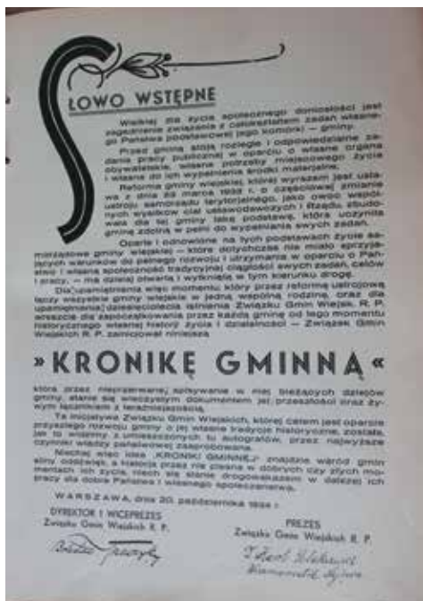
Strona 5 Kroniki Gminnej