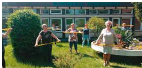
Gimnastyka na świeżym powietrzu