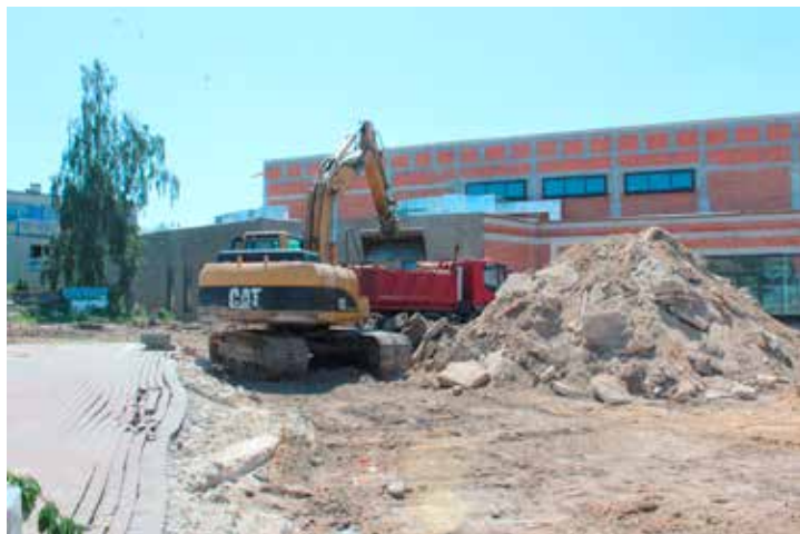
Roboty budowlane przy hali sportowej

w Ostrzeszowie, która zobowiązana jest do wykonania zagospodarowania terenu wokół hali w terminie 120 dni od dnia podpisania umowy.