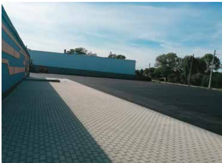
Parking przy Domu Ludowym w Chojęcinie