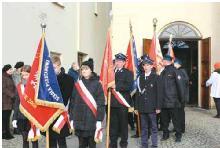
Poczty sztandarowe jednostek OSP oraz Szkoły Podstawowej w Bralinie