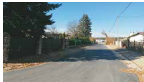
Sołectwo Bralin / Chojęcin – Szum