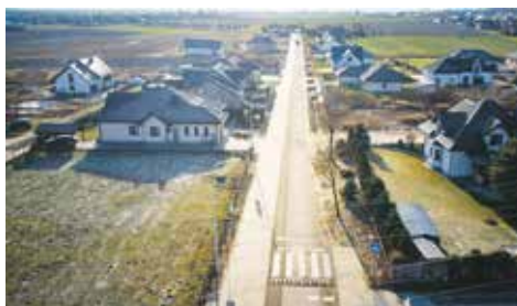
Sołectwo Chojęcin – ścieżka pieszo-rowerowa