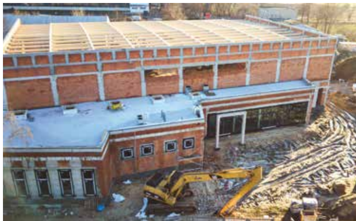
red. Hala sportowa w trakcie budowy

Obecnie trwają prace instalacyjne, montowane są pokrycie dachowe oraz stolarka okiennie-drzwiowa. Na przełomie lutego i marca położone zostaną tynk wewnętrzny i posadzki. Zakończenie prac budowlanych planowane jest na rozpoczęcie roku szkolnego 2022/2023.