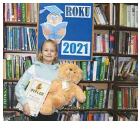
Czytelnik Roku 2021