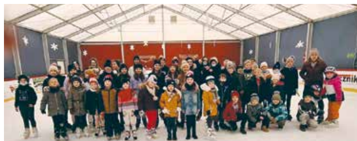
Dzieci na lodowisku w Wieruszowie

Firma Multiconsult Polska Sp. z o.o. zaprasza mieszkańców gminy Bralin na drugi etap konsultacji społecznych dotyczących projektu pn: „Budowa linii kolejowej nr 85 na odc. Łódź - Sieradz Północny i linii kolejowej nr 86 na odc. Sieradz Północny - Kępno - Czernica Wroclawska - Wrocław Główny.”