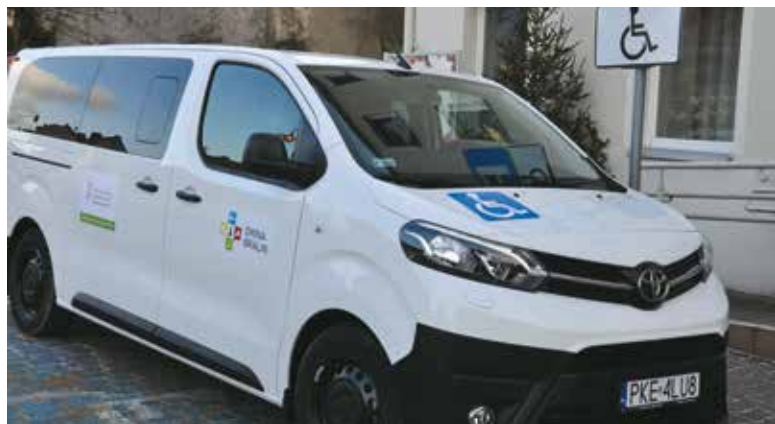
Nowy samochód dla osób z niepełnosprawnościami

Gmina Bralin pozyskała dofinansowanie z PFRON na zakup samochodu dla osób z niepełnosprawnościami.