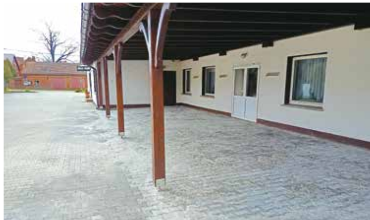
Kostka brukowa w Nowej Wsi Książęcej

Jak co roku w sołectwach naszej gminy zrealizowano wiele nowych przedsięwzięć i zadań. O nowy sprzęt wzbogacono place zabaw w Nowej Wsi Książęcej i Nosalach, a w Goli elementy siłowni zewnętrznej. Wszystkie domy ludowe w różny sposób doposażono w nowoczesny sprzęt, wyremontowano także części zewnętrzne tych obiektów, takie jak dachy czy elewacja. Ważną częścią doposażenia domów