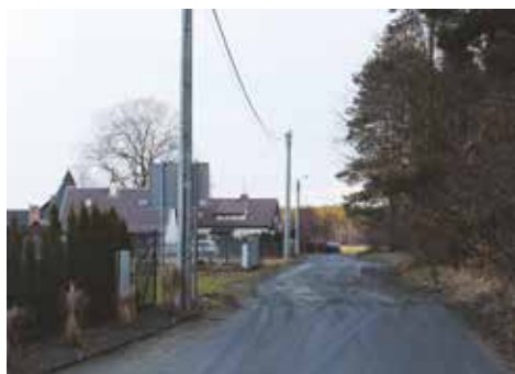
Sołectwo Nowa Wieś Książęca