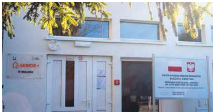
Sołectwo Bralin – Klub Senior+