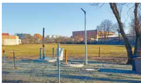
Sołectwo Bralin – przepompownia, ul. Błotna