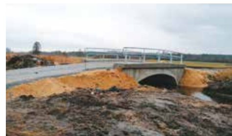
Sołectwo Chojęcin – most na rzece Niesob