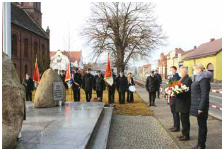
Złożenie kwiatów pod pomnikiem