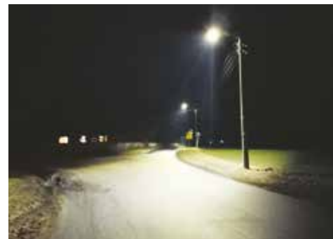
Sołectwo Tabor Mały