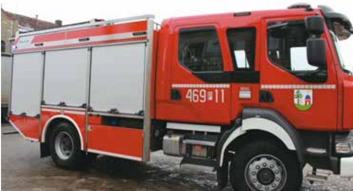
Nowy wóz bojowy OSP Bralin

28 grudnia 2021 r. samochód wjechał do Bralina przy widowiskowych fajerwerkach. Nie obyło się bez dźwięków syren i kolorowych flar. Nowy wóz bojowy na podwoziu renault D16/Stolarczyk zastąpi wysłużonego STARA 244 GBA.