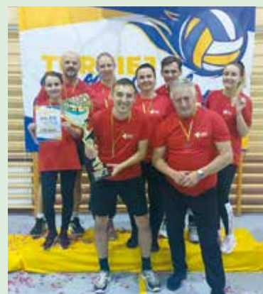
Puchar dla Urzędu Gminy Bralin

W I Międzyurzędowym Turnieju Piłki Siatkowej Jednostek Samorządu Terytorialnego o Puchar Przechodni Wójta Gminy Rychtal sukces odniosła drużyna z gminy Bralin. Turniej został rozegrany w sobotę 11 grudnia 2021 roku w hali sportowej w Rychtalu. Do turnieju zgłosiło się pięć drużyn z powiatu kępińskiego: