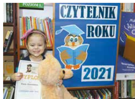
Czytelnik Roku 2021