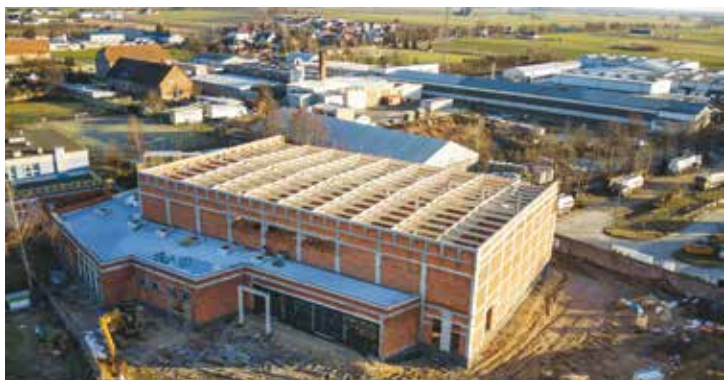
Sołectwo Bralin – hala sportowa