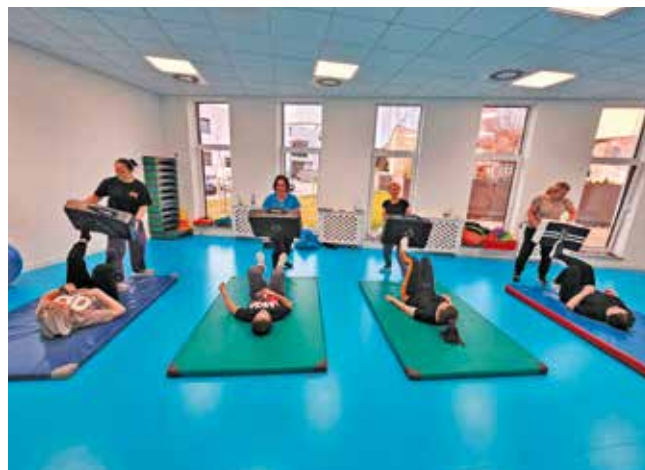
red. Uczestniczki ćwiczą techniki samoobrony podczas zajęć praktycznych

Na przełomie lutego i marca tego roku w salce fitness, w bralińskiej Hali Sportowej odbywały się warsztaty samoobrony. Zajęcia realizowane były w ramach dofinansowania ze środków Europejskiego Funduszu Społecznego Plus. Działanie 09.06: Aktywizacja społeczna osób najbardziej zagrożonych wykluczeniem społecznym i ich rodzin w Gminie Bralin. Podczas warsztatów uczestnicy zdobywali wiedzę teoretyczną i praktyczną dotyczącą radzenia sobie w trudnych sytuacjach, zwłaszcza takich, które wymagają szybkiej reakcji i umiejętności obrony. Dla określonej grupy kobiet warsztaty okazały się bardzo udaną formą aktywizacji i edukacji. Biorąc pod uwagę zaangażowanie pań i systematyczność można śmiało powiedzieć, że po zakończonych warsztatach poczuły się pewniej i chętnie wykorzystują nabyte umiejętności technik obronnych w sytuacjach niebezpiecznych. Zajęcia prowadził doświadczony trener 7 Dan Ju-Jitsu.