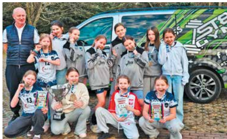
Zawodniczki wraz z trenerem po odniesionym sukcesie

W dniach 20-22 marca w hali sportowej Miejskiego Ośrodka Sportu i Rekreacji w Ciechanowie odbyła się jubileuszowa XXX edycja Ogólnopolskiego Turnieju Mini Piłki Ręcznej Dziew-