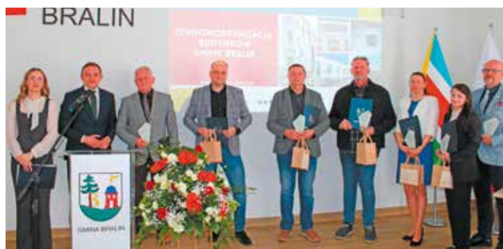
Wręczenie statuetek osobom, które wniosły istotny wkład w realizację inwestycji