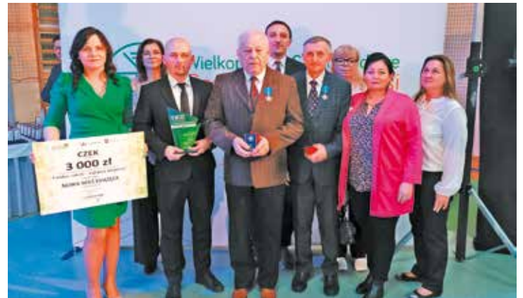
Delegacja gminy Bralin w Stawiszynie

Następnie delegacja udała się do hali widowiskowo-sportowej przy Szkole Podstawowej w Stawiszynie, gdzie odbyła się oficjalna część uroczystości. Podczas wydarzenia rozstrzygnięto etap wojewódzkiej piątej edycji konkursu „Fundusz Sołecki – najlepsza inicjatywa”, organizowanego przez Samorząd Województwa Wielkopolskiego. Laureatem konkursu i zdobywcą trzeciego miejsca zostało sołectwo Nowa Wieś Książęca , które otrzymało nagrodę finansową w wysokości 3 000,00 zł za realizację przedsięwzięcia pn. „ Stworzenie strefy rekreacyjnej przy Domu Ludowym w Nowej Wsi Książęcej ” w ramach XV edycji konkursu „Pięknieje Wielkopolska Wieś”.