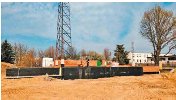
Postęp prac przy budowie sceny plenerowej

Obecnie na terenie stadionu w Bralinie prowadzone są zaawansowane prace budowlane. Na tym etapie inwestycji wykonano już zasadnicze roboty ziemne, przygotowujące teren pod kolejne etapy budowy. Zrealizowano także fundamenty pod konstrukcję przyszłej sceny, co stanowi kluczowy element dalszych prac. Aktualnie trwają prace związane z ociepleniem fundamentów, wykonywana jest instalacja odgromowa oraz murowane są