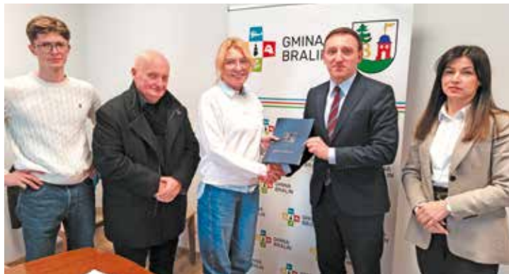
Podpisanie umowy na realizację zadania z wykonawcą – firmą MLKA Sp. z o.o. z siedzibą w Ostrowie Wielkopolskim

ściany. Inwestycja przebiega zgodnie z przyjętym harmonogramem.