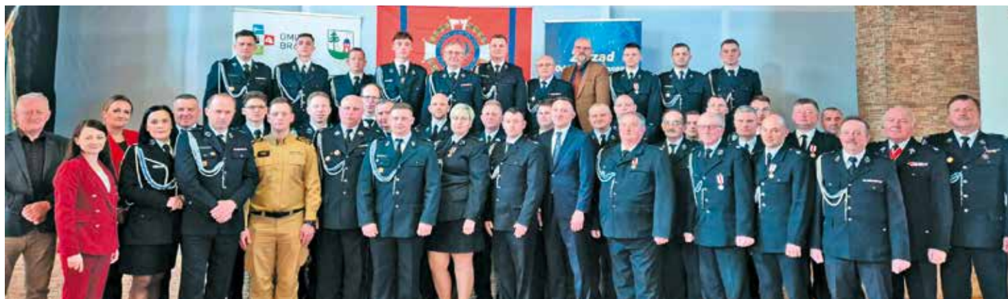
Zjazd Oddziału Gminnego Związku Ochockich Straży Pożarnych RP

21 marca br., w Domu Ludowym w Nowej Wsi Książęcej odbył się Zjazd Oddziału Gminnego Związku Ochockich Straży Pożarnych RP w Bralinie . Wydarzenie to zgromadziło przedstawicieli jednostek OSP z terenu gminy, delegatów oraz zaproszonych gości.