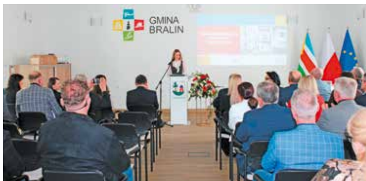
Uroczyste podsumowanie zrealizowanej inwestycji

Realizacja inwestycji rozpoczęła się od skutecznego pozyskania w 2023 roku środków zewnętrznych, które stały się fundamentem dla działań modernizacyjnych. 10 sierpnia 2023 r. Gmina pozyskała dofinansowanie w wysokości 5 400 000,00 zł w ramach ósmej edycji Rządowego Programu Inwestycji Strategicznych