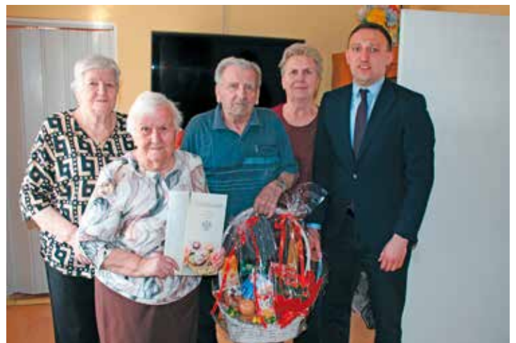
red. Wyjątkowy jubileusz mieszkańców gminy

Niech kolejne dni przynoszą Państwu wiele radości, pogody ducha oraz dumę z tak wspólnie przeżytych lat.