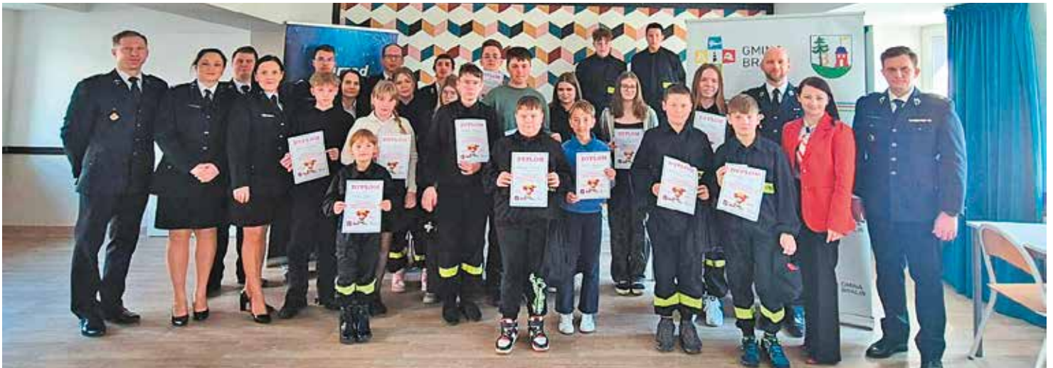
Uczestnicy konkursu, którzy zmierzali się z pytaniami dotyczącymi bezpieczeństwa i ochrony przeciwpożarowej