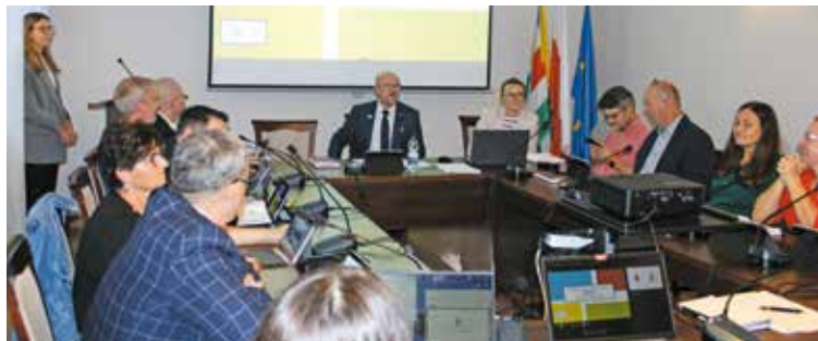
Zaprezentowanie na sesji Rady Gminy Bralin przyjętej Strategii Rozwoju Gminy Bralin