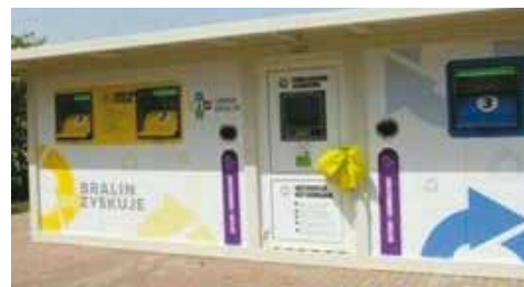
Baterie i przeterminowane leki nie będą już zbierane w siedzibie Urzędu Gminy Bralin.