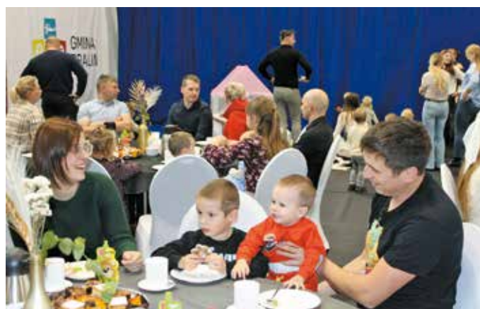
Podczas uroczystości w hali sportowej w Bralinie