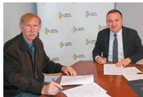
Podpisanie umowy z firmą ARCHITEKTON