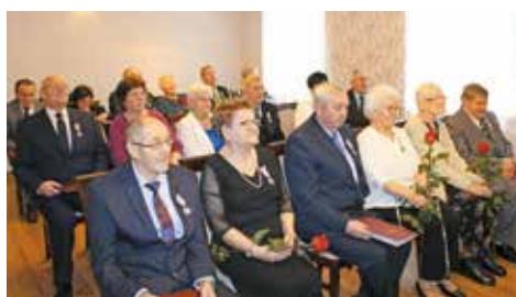
Jubilaci obchodzący jubileusz pożycia małżeńskiego