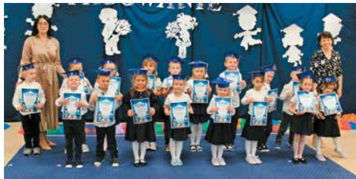
Dzieciom życzymy wspaniałych przygód w dalszej edukacji i odkrywaniu świata.