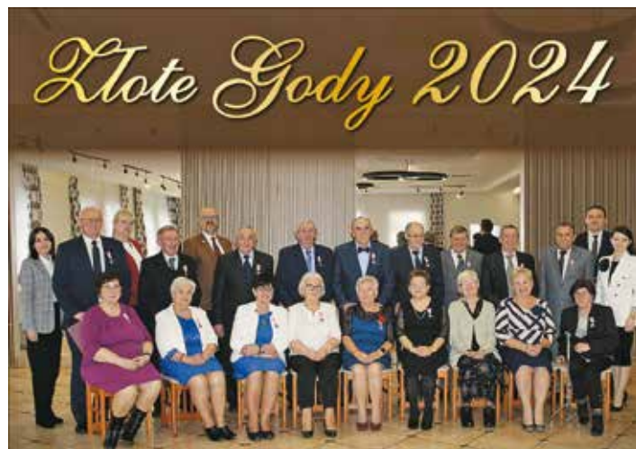
Razem przez 50 lat