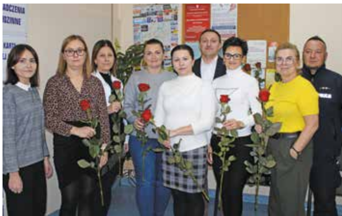
Pracownicy socjalni z zaproszonymi gośćmi