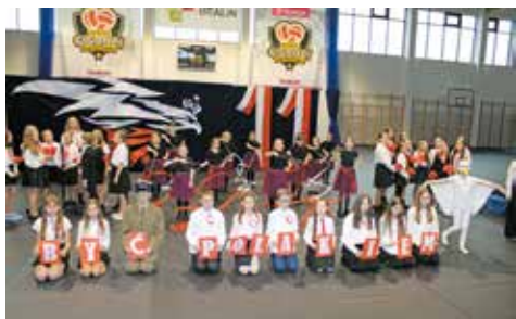
Akademia patriotyczna w wykonaniu uczniów bralińskiej podstawówki

11 listopada 2024 r. w Bralinie miały miejsce Gminne Obchody Narodowego Święta Niepodległości. W tym dniu wszyscy zjednoczyli się, by uczcić pamięć i oddać hołd bohaterom walczącym o wolność Polski. Obchody rozpoczęły się mszą świętą w miejscowym kościele parafialnym, celebrowaną w intencji ojczyzny