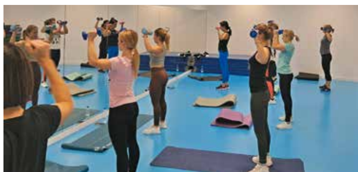
Podczas zajęć w hali sportowej