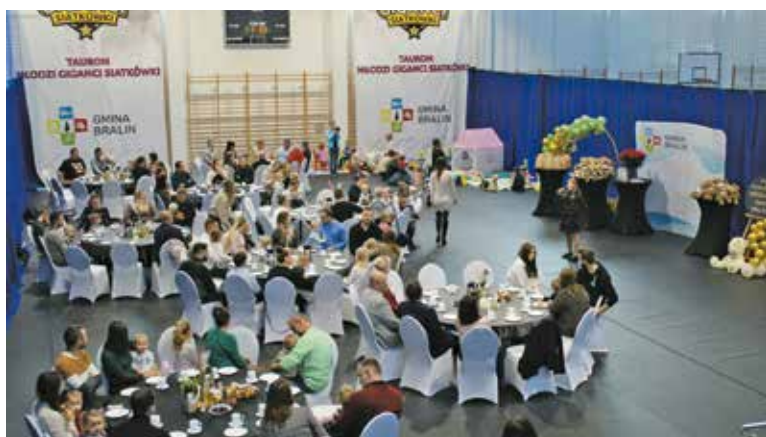
Rodzice z dziećmi podczas uroczystości powitania najmłodszych mieszkańców gminy