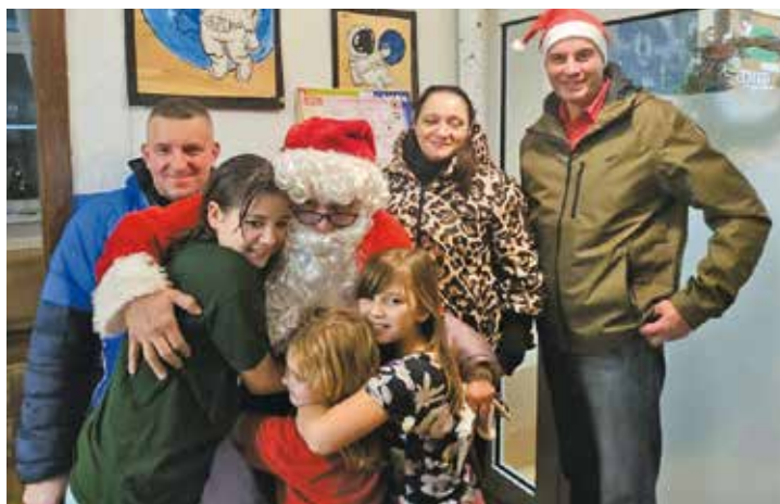
Podopieczni Domu Dziecka z Mikołajem