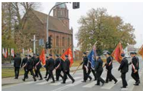
Przemarsz pocztów sztandarowych

i mieszkańców gminy. Po mszy delegacje i pocztu sztandarowe złożyły kwiaty pod Pomnikiem Ofiar Represji i Walk o Wolność w Bralinie, wspólnie odśpiewano hymn narodowy. Następnie wszyscy zgromadzeni przemarszerowali do hali sportowej, gdzie uczniowie bralińskiej szkoły podstawowej przygotowali uroczystą akademię patriotyczną. Występy młodzieży, recytacje