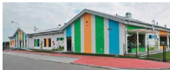
Żłobek „Wiosenka” w Bralinie

W ramach realizacji zadania powstanie nowe skrzydło budynku przy ulicy Wiosennej w Bralinie. Dzięki temu zostanie rozbudowana kuchnia, powstaną dwie sale dla dwóch grup - razem dla 48 dzieci, szatnia, miejsce do leżakowania, pomieszczenia specjalistyczne i socjalne, a także toalety dostosowane do potrzeb najmłodszych.