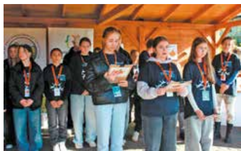
Uczestnicy podsumowują projekt