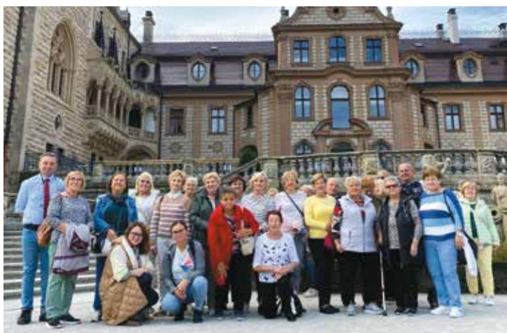
Członkowie Klubu „Senior+” zwiedzają zamek w Mosznej