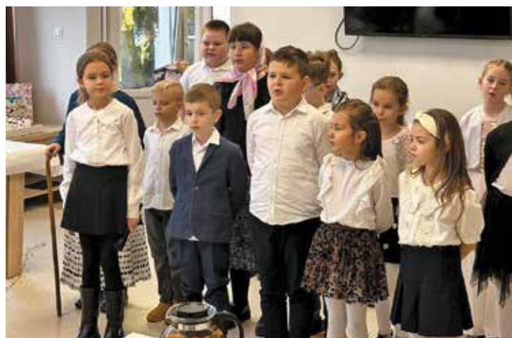
Występ uczniów klasy 2a