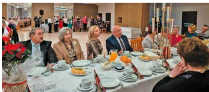
Spotkanie oplatkowe w Kole PZERiI nr 1 w Bralinie

W grudniu 2024 roku w Kołach Polskiego Związku Emerytów, Rencistów i Inwalidów (PZERiI) na terenie gminy Bralin odbyły się tradycyjne spotkania oplatkowe. W tych wyjątkowych wydarzeniach udział wzięli członkowie lokalnych Kół, a także przedstawiciele władz samorządowych gminy. Podczas spotkań nie zabrakło łamania się oplatkiem, wzajemnych życzeń oraz wspólnego śpie-