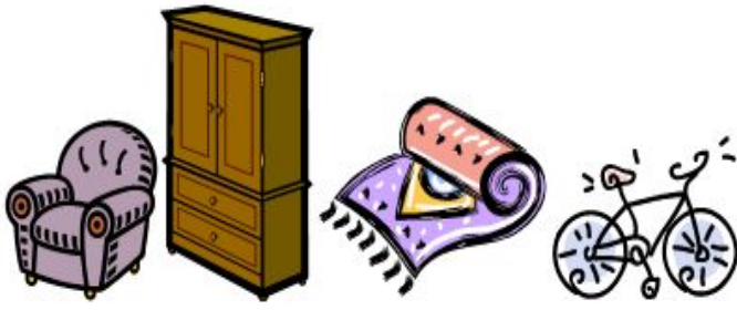
Odpady wielkogabarytowe (tzw. wystawka lub PSZOK)