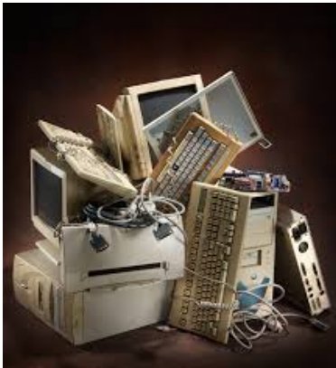
Zużyty sprzęt elektryczny i elektroniczny (PSZOK)