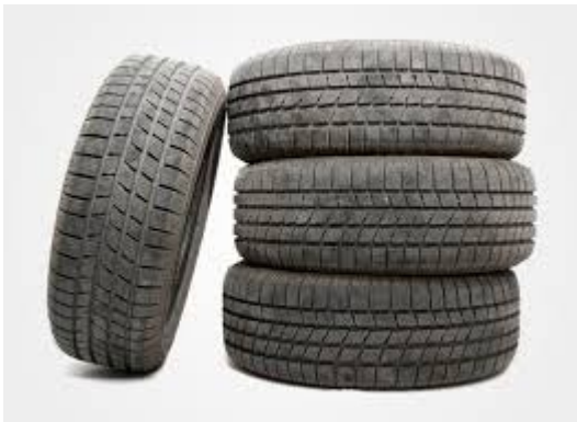
Zużyte opony z samochodów osobowych (PSZOK)