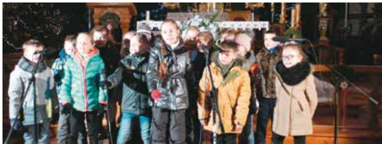
Zespół wokalny z SP Bralin zajął II miejsce w kategorii chóry, klasa I-III