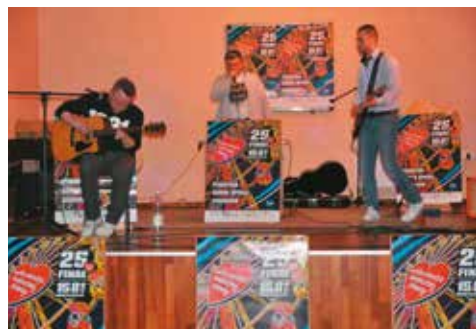
Podczas koncertu WOŚP

Od lat społeczność gimnazjum tworzy oddzielny sztab Wielkiej Orkiestry Świątecznej Pomocy w powiecie kępińskim. Nie inaczej było w tym roku. 15 stycznia po raz drugi do współpracy włączyło się bralińskie Stowarzyszenie ARTwarium, pomoc