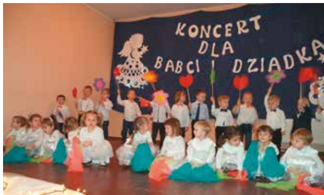
Grupa Stokrotki i Maczki

Trzy dni trwały obchody Dnia Babcy i Dziadka w Przedszkolu „Kwiaty Polskie”.