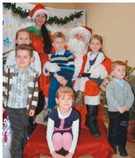
U Mikołaja na kolanach. To jest to!

skanie organizatorów o to, by to spotkanie przebiegło jak najlepiej, a wszystkie dzieci mogły zostać obdarowane paczkami, zostało wynagrodzone uśmiechniętymi twarzami najmłodszych.