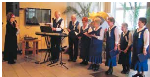
Z kołdami w DPS w Marszałkach

Zarząd Oddziału Rejonowego rozpoczął kolejny już 25. rok swojej działalności. Przez te wszystkie lata liczba członków ciągle rosła, bo oprócz kół z terenu gminy Bralin do oddziału wstąpiły też koła terenowe PZERiI z gminy Baranów i Rychtal. W ostatnim czasie, niestety, obserwuje się spadek liczby członków. Oddział skupia w swych szeregach 10 kół z gminy Bralin, wśród których najliczniejsze jest koło w Bralinie, liczące 188 członków. Najmniejsze są koła w Goli i Czerminie, bo mają mniej niż 10 członków. Tylko koła w Bralinie, Chojećcinie i Mielęcynie notują tendencję wzrostową. W szeregach wszystkich bralińskich kół jest razem 468 członków. W gminie Rychtal działają dwa koła, które skupiają w swych szeregach 147 osób, a w gminie Baranów są 4 koła, które razem liczą 284 członków wg stanu na dzień 1 grudnia 2016 roku. Liczba osób, które zostają wypisane z powodu zgonu lub na własną prośbę ze względu na stan zdrowia, jest ciągle wyższa od liczby nowo przyjętych. Może ciekawe propozycje wyjazdów i innych form działalności poszczególnych zarządów kół terenowych zachęca nowych