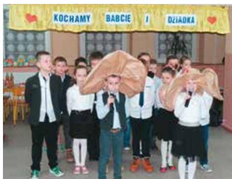
Dzieci z klasy IId w programie dla babci i dziadka

Wszystkie spotkania przebiegały w niezwykłej atmosferze i na pewno pozostaną w pamięci najstarszych i najmłodszych. W najbliższym czasie Dzień i Babci i Dziad-