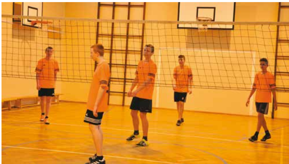
Młodzież z gimnazjum podczas zajęć sportowych

Od stycznia do grudnia 2017 roku we wszystkich trzech szkołach na terenie gminy Bralin realizowany jest program „Szkolny Klub Sportowy”. To kolejny program współfinansowany przez Ministerstwo Sportu i Turystyki, a realizowany we współpracy Gminy Bralin i Szkolnego Związku Sportowego „Wielkopolska”. Ideą projektu jest organizacja i prowadzenie systematycznych zajęć sportowych dla dzieci i młodzieży 2 razy w tygodniu po 60 min w grupach 15-20 osobowych. To zajęcia skierowane do uczniów szkół bez względu na wiek, płeć oraz sprawność fizyczną, które mają na celu umożliwienie podejmowania dodatkowej aktywności fizycznej realizowanej w formie zajęć sportowych i rekreacyjnych pod opieką nauczyciela prowadzącego zajęcia wychowania fizycznego w danej szkole.