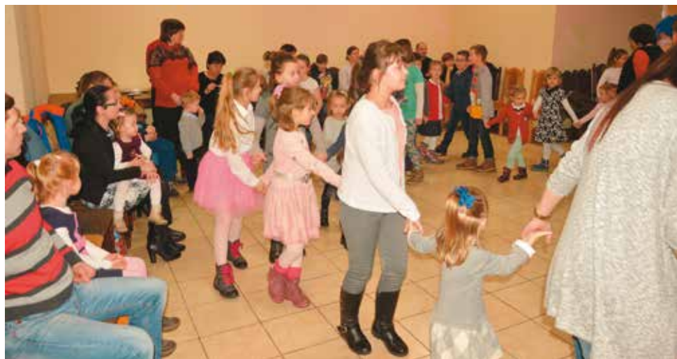
Na wspólnej zabawie przy muzyce

dekoracji trwała kilkugodzinna zabawa najmłodszych mieszkańców tych miejscowości, o co zadbali sołtysi i rady sołeckie. Aurę świąteczną stworzyła wizyta Mikołaja, który przyniósł dla dzieci słodkie upominki. Nie obyło się bez zdjęć z jegomościem w czerwonym ubraniu i białą brodą. Taka fotografia będzie nieocenioną pamiątką po latach dla wtedy już dorosłych osób. Zatro-