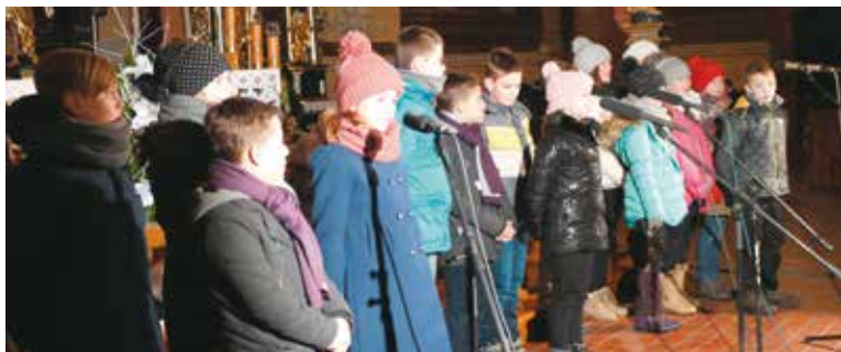
Zespół z SP Bralin w kategorii klas IV-VI zajął III miejsce

Zanim jednak mogła się odbyć gala laureatów festiwalu jeszcze w grudniu poprzedniego roku przeprowadzone zostały eliminacje i wyłoniono zwycięzców. Eliminacje odbyły się 15 grudnia 2016 r. w świetlicy „Tęcza” w Bralinie. Do konkursu przystąpili uczniowie z 16 szkół podstawowych z powiatu kępińskiego, m.in. uczniowie ZS w Łęce Mroczeńskiej, SP w Grębaninie, SP w Drozkach, ZS w Perzowie, SP w Buczku Wielkim, ZS w Nowej Wsi Książęcej, ZS w Laskach, SP w Opatowie, ZS w Łęce Opatowskiej, ZS w Trzciny, SP w Rychtalu, ZS w Donaborawie, SP w Hanulinie, SP w Krążkowach, ZS w Trębaczowie i SP w Bralinie. Wykonawców oceniało jury w składzie: ks. Jacek Paczkowski – doktor muzykologii Wyższego Seminarium Duchownego w Kaliszu, przewodniczący komisji muzyki i śpiewu kościelnego, Wiesława Opacka – instruktor z Wieruszowskiego Domu Kultury i Michał Zaczek – redaktor naczelny radia SUD. Po przesłuchaniach konkursowych jury wyłoniło zwycięzców, jednak kolejność miejsc dla uczestników została niespodzianką do 6 stycznia br. Dopiero podczas uroczystego koncertu galowego w sanktuarium Na Półku ogłoszone zostały pełne wyniki i wręczono nagrody, statuetki i dyplomy.