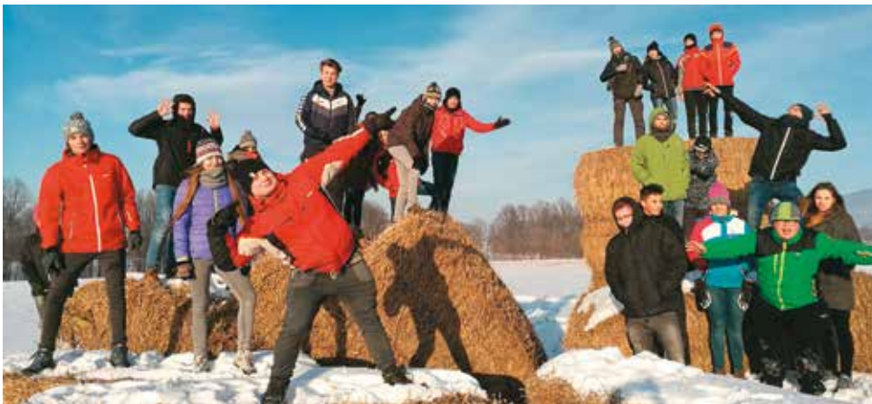
Humory i pomysły dopisywały młodzieży i opiekunom

Narciarskie przygody to również rekolekcje, w czasie których młodzież pogłębiała przyjaźń z Bogiem, a także między sobą nawzajem. Młodzież uczestniczyła w naukach rekolekcyjnych, sakramencie spowiedzi, przygotowanych scenach, a także w Eucharystii. Podzieleni na mniejsze grupy uczyli się współ-