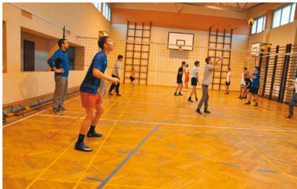
Młodzież ma możliwość aktywności sportowej 2 razy w tygodniu po 60 minut