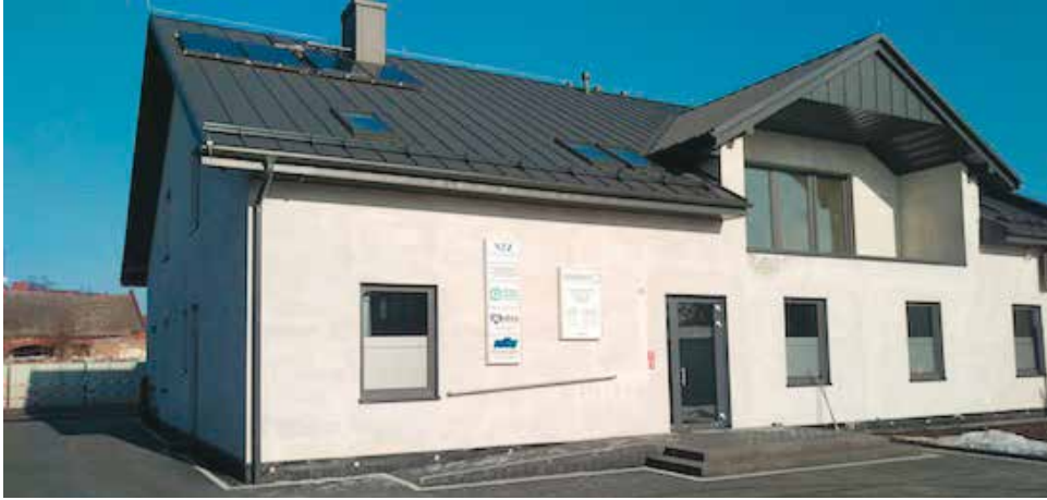
Nowy ośrodek zdrowia przy ul. Wrocławskiej 35

W sprawie szczegółowych informacji na temat pracy Przychodni Lekarskiej „Medica” w nowej lokalizacji można kontaktować się telefonicznie - numer telefonu do przychodni pozostaje bez zmian - 62 78 292 14. Informacje dostępne są również na stronie internetowej www.medica.kepno.net