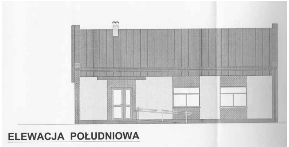
Tak wg projektu wyglądać będzie Dom Ludowy w Nosalach

W październiku 2016 roku Gmina Bralin złożyła do LGD Wrota Wielkopolski wniosek pn. „Budowa Domu Ludowego w Nosalach jako centrum kulturalno-rekreacyjne”, ale przygotowania dokumentacji rozpoczęły się dużo wcześniej. 22 listopada ubiegłego roku Rada Stowarzyszenia Wrota Wielkopolski dokonała oceny złożonych w naborze wniosków. Projekt Gminy Bralin został uznany za zgodny z ogłoszeniem i znalazł się na drugim miejscu listy rankingowej do dofinansowania. Po zakończeniu procedur przez Stowarzyszenie Wrota Wielkopolski wnioski przyjęte przez Radę do dofinansowania zostały przekazane do Urzędu Marszałkowskiego Województwa Wielkopolskiego. Tam odbywa się kolejna wnikliwa weryfikacja. W chwili obecnej trwa korespondencja pomiędzy urzędami, oczywiście procedura w tego typu konkursach o środki zewnętrzne, mająca na celu korekty wniosku i przygotowanie do podpisania umowy