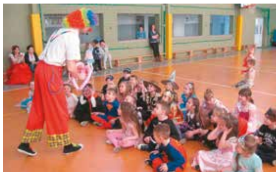
Klaun bawił dzieci podczas balu karnawałowego

18 stycznia obchodziliśmy Dzień Kubusia Puchatka. Nie jest to jednak przypadkowa data. To właśnie 18 stycznia minęła kolejna rocznica urodzin twórcy uwielbianego przez dzieci i dorosłych sympatycznego Kubusia Puchatka – Alana Aleksandra Milne'a. By uczcić to święto niektórzy uczniowie naszej szkoły przynieśli ze sobą maskotki i inne puchatkowe gadzety. Dzień ten był też doskonałą okazją do przypomnienia przygód