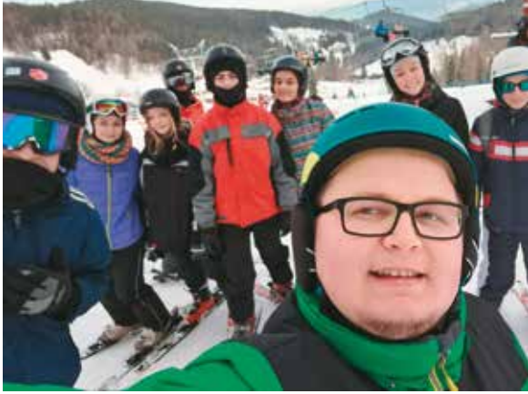
Selfie z grupą

W zdrowym ciele zdrowy duch - tymi słowami możemy opisać wyjazd młodzieżowej wspólnoty i ministrantów parafii pw.