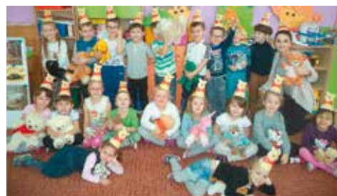
Misie w roli głównej

Światowy Dzień Pluszowego Misia przypada co roku 25 listopada, tego też dnia świętowaliśmy go w naszej placówce. Na polecenie nauczycielek dzieci przyniosły do przedszkola swoje ulubione misie. Plu-