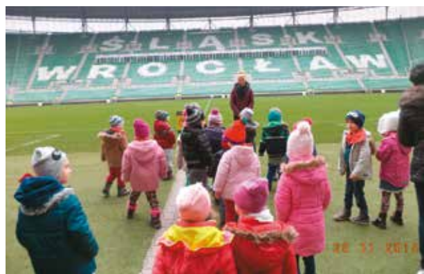
Przedszkolaki na stadionie „Śląsk”