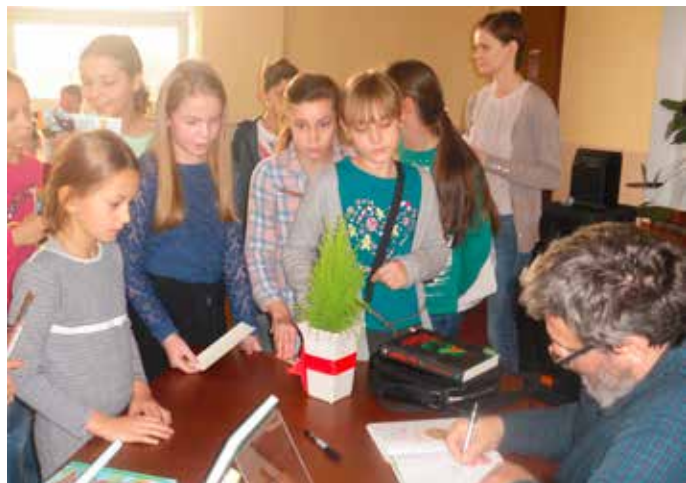
Na pamiątkę spotkania - autograf z rysunkiem