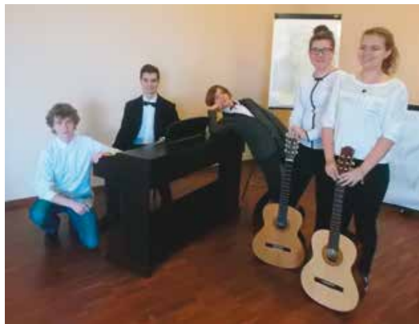
Sekcja muzyczna podczas akademii „Kobiety noblistki”