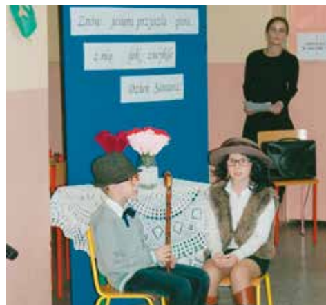
Dzieci dla seniorów