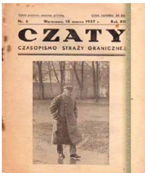
„Czaty” nr 6, 18 marca 1937 r.