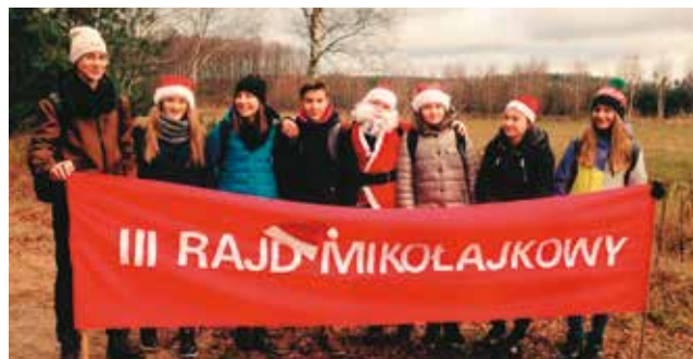
Mikołajki na sportowo, to jest to!