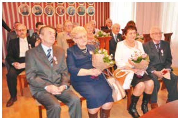
W sali sesyjnej urzędu gminy