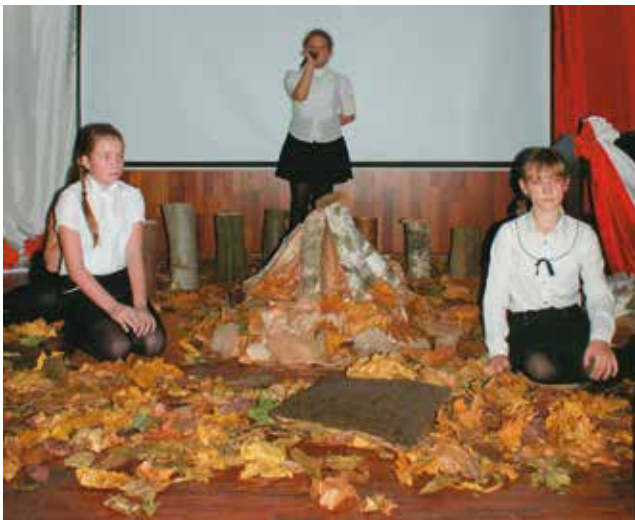
Przy ognisku, w półmroku uczniowie porwali widownię do śpiewu

Szkoła Podstawowa im. Mikołaja Kopernika Urząd Gminy Bralin oraz Parafia Bralin serdecznie zapraszają na uroczysty