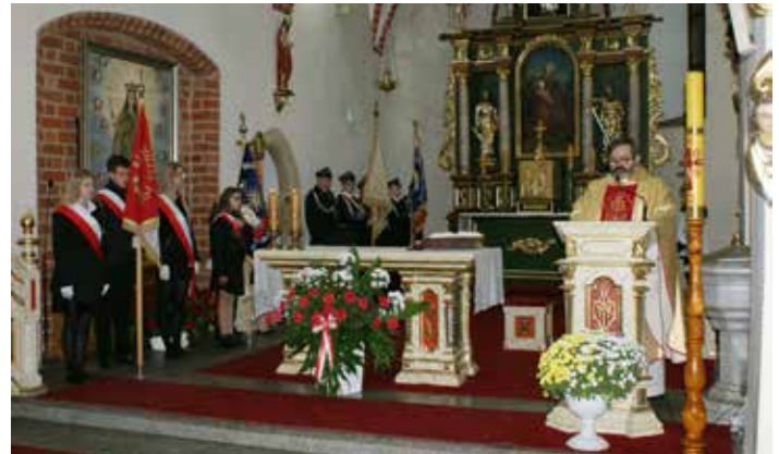
Msza święta za ojczyznę w kościele w Bralinie

Skupione wokół ogniska, w półmroku, rozświetlanym wszechobecnymi barwami narodowymi, dzieci zabrały słuchaczy w świat pieśni patriotycznych i wierszy, okraszonych słowem narratora. Teksty pieśni były wyświetlane na ekranie, co umożliwiło gremialny śpiew. Po zdjęciu ilustrowały pojawiające się na ekranie obrazy często wpisane w „Małą Ojczyznę” – m.in. dęby bralińskie, kościółek na Półku, droga do leśniczówki, flaga narodowa utworzona z uczniów bralińskiej podstawówki oraz motyw muzyczny. Występ zespołu wokalnego porwał zebranych... i popłynęły pieśni ożywiające pamięć naszych bohaterów: „Mazurek Dąbrowskiego”, „Wojenka, wojenka”, „Rozkwitły paki białych róż”, „O mój rozmarynie”, „Pierwsza Brygada”, „Pierwsza Kadrowa”, „Ułani, ułani”, „Przybyli ułani pod okienko” i te odzwierciedlające współczesne oblicze Ojczyzny: „Kwiaty polskie” i „Pytanie o Polskę”. Nie zabrakło także odwołań do wielkopolskiej tradycji. Uczniowie przypomnieli, że 11 listopada to też dzień wspomnienia św. Marcina i związana z nim tradycja pieczenia rogalików marcińskich. Miłą i smaczną niespodzianką było dla wszystkich