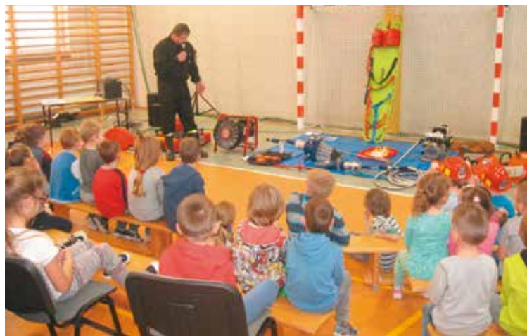
Druhowie z OSP Nowa Wieś Książęca odwiedzili uczniów miejscowej szkoły

19 listopada do Zespołu Szkół w Nowej Wsi Książęcej przyjechali strażacy z miejscowej Ochotniczej Straży Pożarnej. Celem odwiedzin strażaków było uświadomienie dzieciom zagrożenia, jakie niesie ze sobą nieprzestrzeganie zasad bezpieczeństwa przeciwpożarowego oraz zabawa z ogniem.