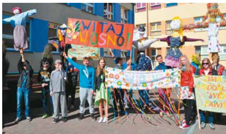
i Gimnazjum w Bralinie