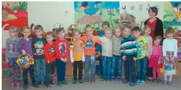
Przedszkolaków odwiedził zajęczek

Pierwszy Dzień Wiosny obchodzony był w przedszkolu „Kwiaty Polskie” 20 marca 2015r. Powitaniu wiosny towarzyszyła wspaniała pogoda. Dzieci wraz z nauczycielkami przygotowały z tej okazji kolorową marzannę, która symbolizowała odchodzącą zimę. Po zajęciach poświęconych tradycji żegnania zimy i witania wiosny przedszkolaki utworzyły barwny korowód. Następnie w wesołym korowodzie wyruszyły na pierwszy wiosenny