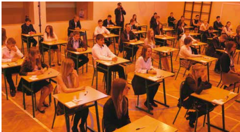
Gimnazjaliści przed testem humanistycznym

W miarę zaawansowania toku nauki poprzeczka rośnie. Egzamin gimnazjalny trwa trzy dni i w tym roku odbywał się w dniach 21 – 23 kwietnia. W gminie Bralin przystąpiło do niego 59 uczniów. Egzamin gimnazjalny składa się z trzech części: humanistycznej (zakres wiedzy z historii, wiedzy o społeczeństwie i języka polskiego), matematyczno-przyrodniczej i z języka obcego. To także egzamin obowiązkowy, stanowiący warunek ukończenia szkoły, nie określa się jednak minimalnego wyniku, jaki zdający powinien uzyskać, toteż nie można go nie zdać. Pierwszego dnia gimnazjaliści najpierw przystępują do 60-minutowego testu z historii i wiedzy o społeczeństwie, a po przerwie rozwiązują test z języka polskiego, na który mają 90 minut. Drugi dzień to sprawdzenie wiedzy najpierw z zakresu przedmiotów przyrodniczych (test 60-minutowy), a po przerwie z zakresu matematyki i tu do rozwiązania test przeznaczony na 90 minut. Ostatniego dnia gimnazjaliści zdają język obcy. Wszyscy uczniowie mają obowiązek napisania testu na poziomie podstawowym