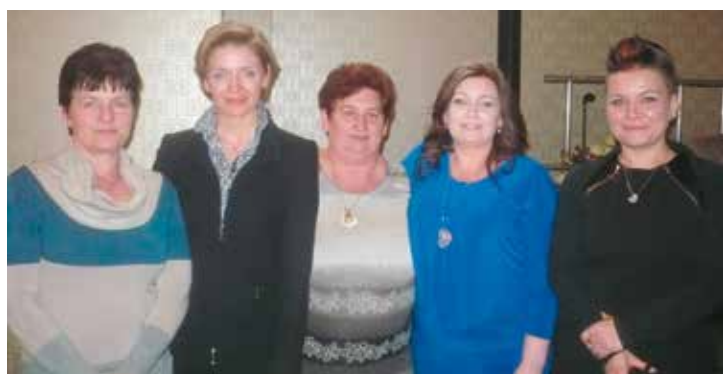
Pamiątkowe zdjęcie z posłanką Joanną Muchą

12 marca br. grupa naszych pań sołtys przyjęła zaproszenie poseł Bożeny Henczyca i wzięła udział w I Babskim Sejmiku Południowej Wielkopolski, jaki odbył się w Siemianicach.