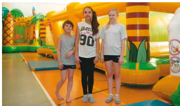
w Zespole Szkół w Nowej Wsi Książęcej