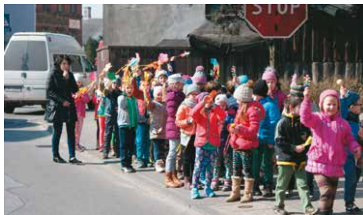
w Szkole Podstawowej w Bralinie