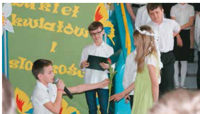
Wesoły program o paniach i dla pań

Gimnazjum im. Polskich Noblistów w Bralinie