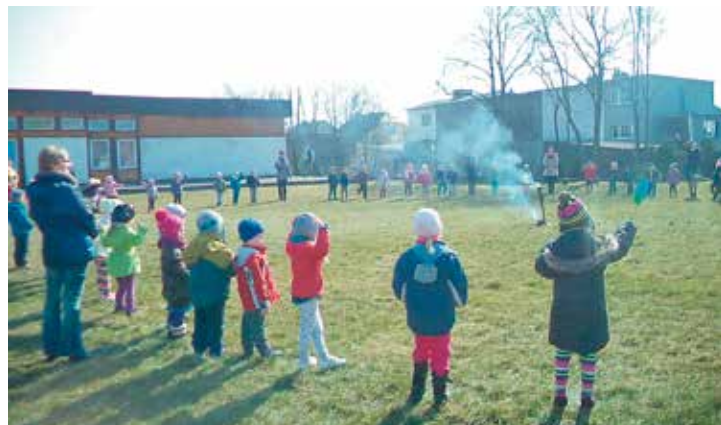
w Przedszkolu „Kwiaty Polskie” w Bralinie