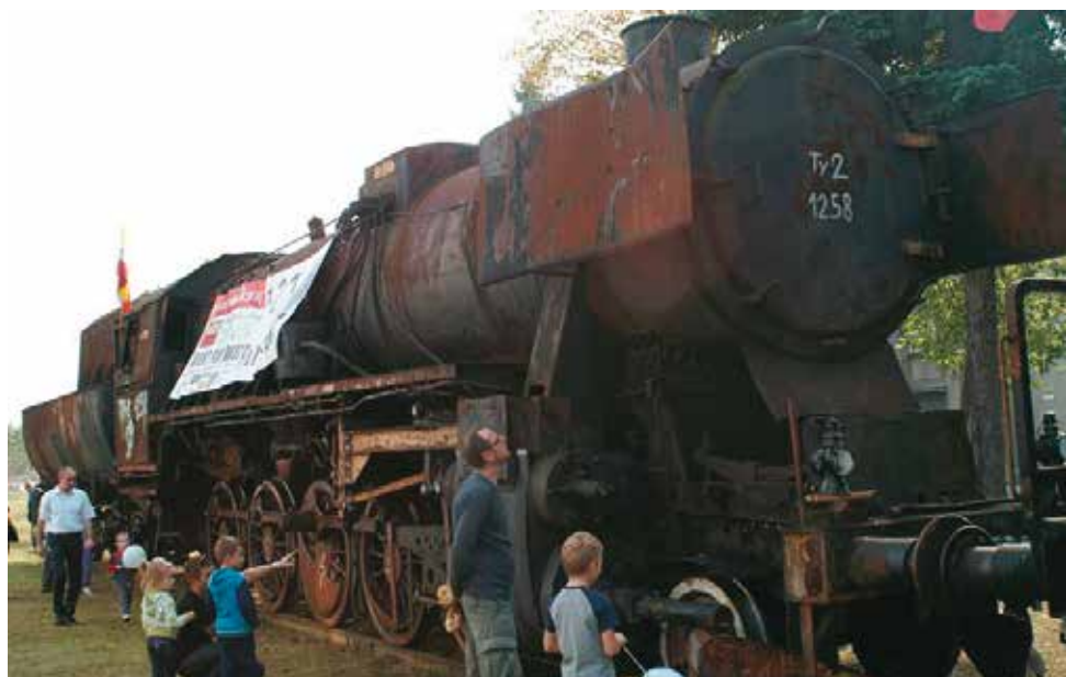
Parowóz z 1943 r. od 2014 r. nosi imię „Franciszek”