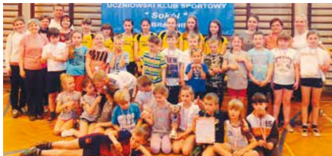
Organizatorzy i uczestnicy turnieju

16 kwietnia 2015 r. Międzyszkolny Uczniowski Klub Sportowy „Sokół” w Bralinie zorganizował po raz piąty specjalną imprezę dla dzieci pod hasłem „Ćwicz z Kubusiem Puchatkiem”. Do sali gimnastycznej szkoły podstawowej zaproszono uczniów klas drugich naszej gminy. W zabawie udział wzięły tylko klasy IIa i IIb z Bralina. Tym razem z najślynniejszym misiem świata i jego przyjaciółmi nauczyciele zaproponowali wiele rodzajów ćwiczeń nawiązujących do lektury „Kubuś Puchatek”. Dzieci mogły wykazać się sprawnością w konkursach: budujemy chatkę Puchatka, bieg kangurzyca, ogon Kłapouchego czy bieg po barylkę miodu. Zadania sprawnościowe przeplatane