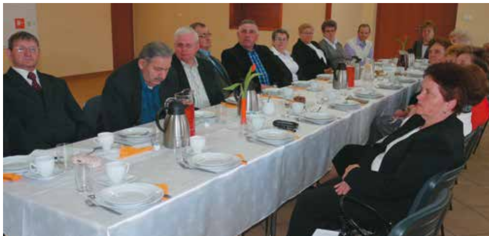
Zarząd Oddziału Rejonowego PZERI w Bralinie

Rok 2014 był szczególnie interesujący dla członków bralińskich kół, bowiem mieli oni możliwość wzięcia udziału w ciekawym projekcie organizowanym m.in. przez Gminę Bralin i Stowarzyszenie Przyjaciół Ziemi Bralińskiej, w ramach którego odbywały się warsztaty i spotkania z ciekawymi ludźmi oraz wyjazdy do teatru. W działaniach tych uczestniczyło 409 seniorów.