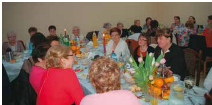
Sympatyczne spotkanie trzech pokoleń pań

7 marca 2015 roku, w przeddzień Dnia Kobiet w Domu Ludowym w Chojeńcinie-Parcelach odbyło się spotkanie dla pań