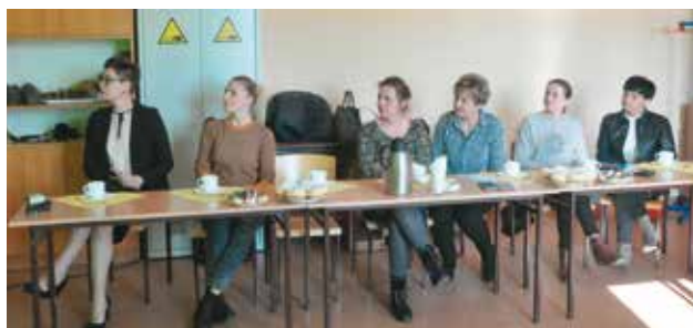
W trakcie konferencji omawiano strategię wspierania uczniów ze specjalnymi potrzebami edukacyjnymi

W czwartek 28 lutego 2019 roku w Zespole Szkół im. Ks. Michała Przywary i Rodziny Salomonów w Nowej Wsi Książęcej odbyło się szkolenie w ramach realizacji projektu POWERSE pt. „Pomóż mi wyrazić siebie, bo razem możemy więcej czyli jak pomóc dziecku ze specjalnymi potrzebami edukacyjnymi”. Po specjalistycznym kursie w Oxford International Study Center w Oxfordzie nauczyciele