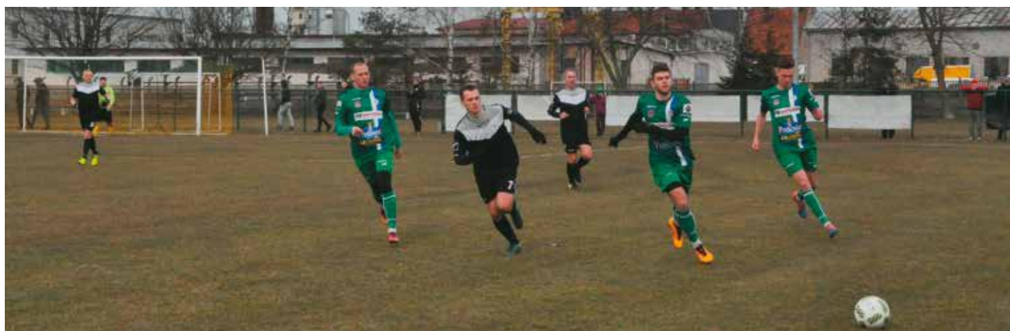
Ćwierćfinał okręgowego Pucharu Polski w Bralinie - LKS „Sokół” Bralin - KKS Kalisz

Zanim jednak będziemy wspominać 100-letnią historię, spotkajmy się wcześniej