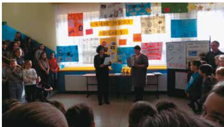
Szkolny Tydzień Profilaktyki obfitował w wiele spotkań, warsztatów i prelekcji

Szkolny Tydzień Profilaktyki obfitował w wiele spotkań, warsztatów i prelekcji mających na celu uświadomić uczniom Szkoły Podstawowej im. Mikołaja Kopernika w Bralinie, jak spędzać bezpiecznie i aktywnie czas wolny, rozwijając swoje zainteresowania i pasje. W trakcie Szkolnego Tygodnia Profilaktyki młodzież miała możliwość zapoznania się z zasadami udzielania pierwszej