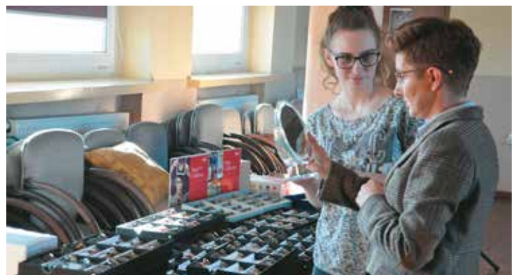
Z troski o wzrok mieszkańców