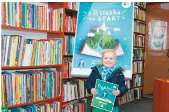
Pierwsze dyplomy trafiły w ręce małych czytelników

Przypominamy, iż w naszej bibliotece nadal trwa akcja Mała Książka-Wielki Człowiek. Każde dziecko urodzone w roku 2016 dostaje wyprawkę czytelniczą w prezencie, a w niej książkę „Pierwsze wiersze dla...” oraz Kartę Małego Czytelnika do zbierania bibliotecznych naklejek. W pakiecie startowym znajduje się też broszura „Książką połączeni, czyli o roli czytania w życiu dziecka” dla rodziców. Podczas wizyty w bibliotece