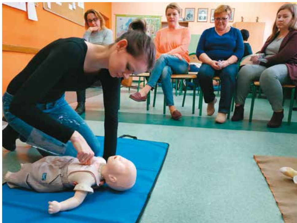
Pierwsza pomoc to proste czynności, które mogą uratować czyjeś życie