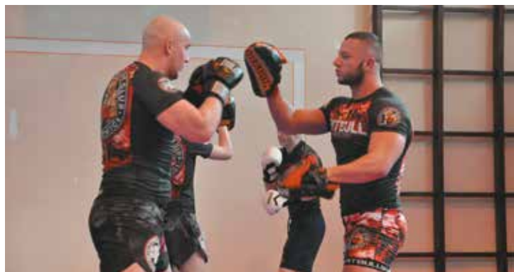
Zwianczeniem Szkolnego Tygodnia Profilaktyki był pokaz umiejętności zawodników z Pitbull's Fight Club ze Zdzeszowic