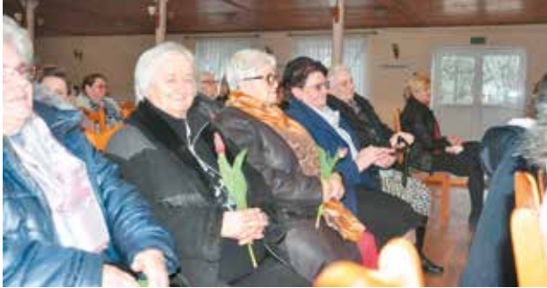
Wszystkie panie otrzymały symbolicznego kwiatka

Z okazji Dnia Kobiet w Wiejskim Domu Kultury w Nowej Wsi Książęcej 2 marca 2019 r.