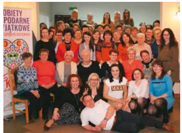
Humory na spotkaniach z okazji Dnia Kobiet dopisywały