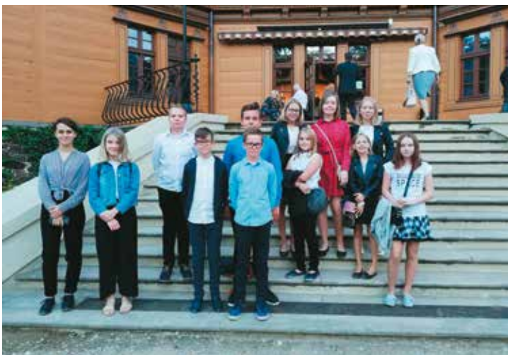
Przed pałacem Myśliwskim Książąt Radziwiłłów w Antoninie