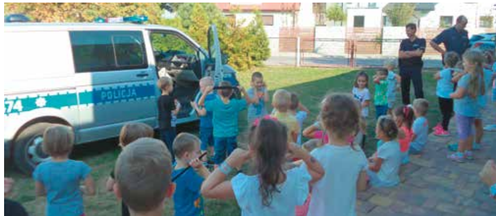
Dzieci razem z policjantami

szkolaki mogły zapoznać się z akcesoriami niezbędnymi w pracy stróżów porządku publicznego. Na pamiątkę spotkania dzieci otrzymały od policjantów odbłaskowe światełka mające zapewnić im bezpieczeństwo na drodze.