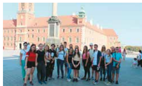
Nasze stopy w Warszawie

W czwartek rano młodzież wyruszyła z bralińskiego rynku podekscytowana, ponieważ zapowiadały się cudne dwa dni. Niektórzy z nas mieli okazję być pierwszy raz w stolicy. Po zakwaterowaniu się w schronisku od razu rozpoczęliśmy zwiedzanie. Pierwszym punktem wycieczki, którego nie mogło zabraknąć w programie wyjazdu były Stare Powązki, gdzie symbolicznie zapaliliśmy kilka zniczy m.in. na grobie Żwirki i Wigury. Kolejnym miejscem, które odwiedziliśmy był Cmentarz Wojskowy na Powązkach, a dokładniej - Aleja Zasłużonych. Tam również zapaliliśmy znicze na