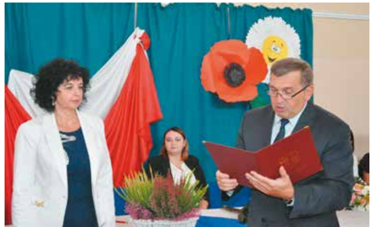
Wójt z nową dyrektorką szkoły w Bralinie

Dwa dni później kilkunastoosobowa grupa młodzieży udała się do Pałacu Myśliwskiego Książąt Radziwiłłów w Antoninie, aby wziąć udział w koncercie fortepianowym. W czasie tegorocznego, 37. Mię-