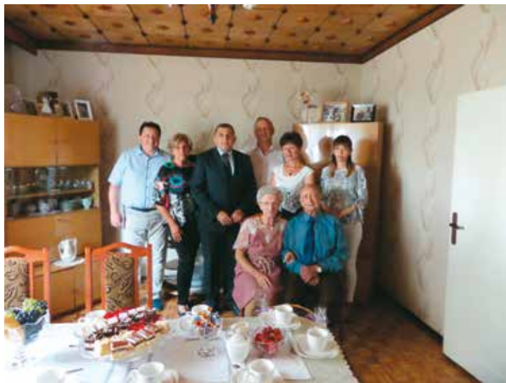
60 lat po ślubie