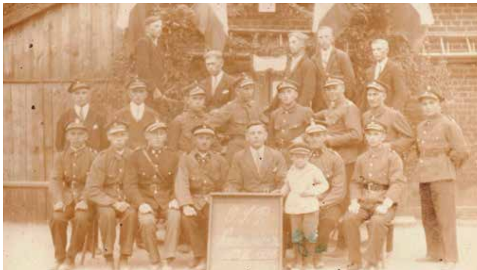
OSP Nowawieś Książęca. Rok 1934

Pierwszy tekst [z 1823 r. o zakupie sikawki przez dobra Trębaczów, Nowawieś Książęca, Zbyszyna „i tamtejsze gminy wiejskie” – przyp. JK] jest bardzo ciekawy i moim skromnym zdaniem nadaje się, aby Zarząd Wojewódzki o tym pomyślał, niemniej jednak sama wzmianka o zakupieniu sikawki może jeszcze nie stanowić dowodu co do istnienia straży. Istotne może być w tym przypadku również pochodzenie tekstu, tzn. czy to na przykład dokument, kronika, artykuł i gdzie on teraz się znajduje, gdzie Pan go odnalazł. Wiem, że są jednostki, które na podstawie tabliczki znamionowej znajdującej się na sikawce konnej takie daty zmieniały.