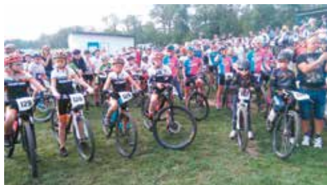
Młodzi kolarze przed startem

limitami Wielkopolskę mogło reprezentować zaledwie 14 zawodników. Wśród nich było dwoje uczniów z bralińskiego UKS-u, co już jest nie lada wyróżnieniem.