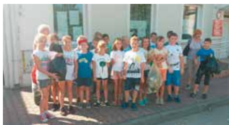
Po zakończonej akcji

Poniżej przedstawiamy rekordzistów, którzy otrzymali nagrody wójta gminy Bra-