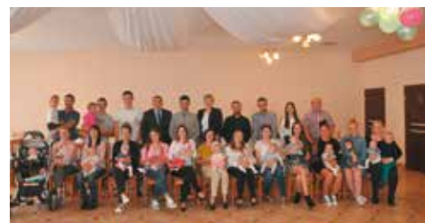
Wspólna pamiątkowa fotografia

Piątkowe spotkanie było dla młodych rodziców świetną okazją do integracji, rozmów dotyczących rodzicielstwa oraz