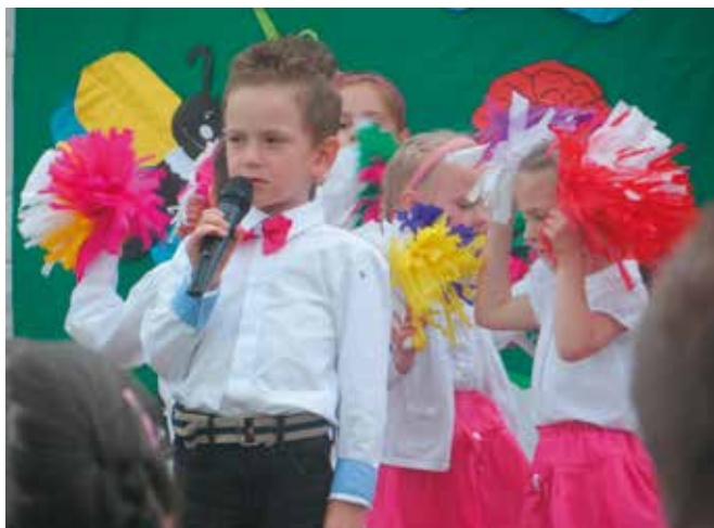
Piosenki, wierszyki i tańce dla mamy i taty

Dzień Dziecka przebiegał w przedszkolu w sportowym klimacie. Nauczycielki przygotowały dla swoich podopiecznych niespodzianki w formie ćwiczeń gimnastycznych, gier zręcznościowych oraz tor przeszkód.