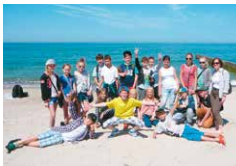
Nadmorska plaża zachęcała do spacerów

W dniach 30 maja – 6 czerwca uczniowie zespołu szkół byli uczestnikami programu „Zielona Szkoła”. Dziewiętnaścioro uczniów wraz z opiekunami przebywało w Ośrodku Wczasowo-Kolonijnym „Barka” w Jarosławcu. Większość dzieci po raz pierwszy gościła na środkowym wybrzeżu i, nie da się ukryć, oczarowana była nadmorskim krajobrazem. Nic dziwnego, urozmaicone, pofałdowane tereny urzekają ekosystemem lasów i jezior, a przede wszystkim olbrzymimi, unikatowymi w skali europejskiej, ruchomymi wydmiami. Okolice Jarosławca to przepiękne piaszczyste plaże, szumiące morze, malownicze klify, niewielkie porty rybackie. Można tu z powodzeniem urządzić wycieczki piesze i rowerowe, jeździć konno, żeglować, pływać w morzu lub jeziorach, a także zwiedzać muzea, latarnie morskie, wiejskie kościołki i pałace. Wybrzeże środkowe, nazywane często Krainą w Kratę