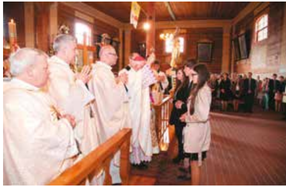
Młodzież złożyła dar ołtarza - relikwiarz św. Jana Pawła II

Poniedziałkowy poranek, 12 maja rozpoczął się godzinkami ku czci Niepokala-