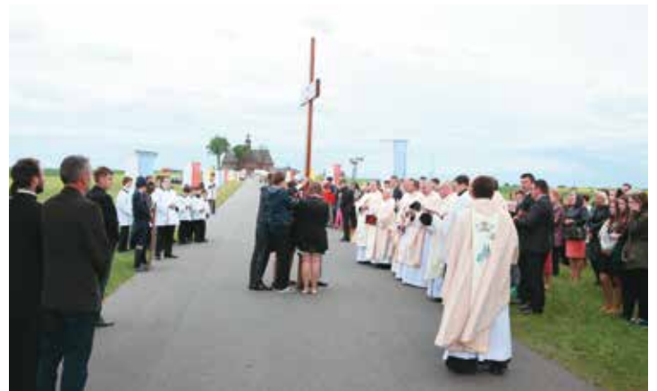
Pierwsza stacja powitania symboli ŚDM