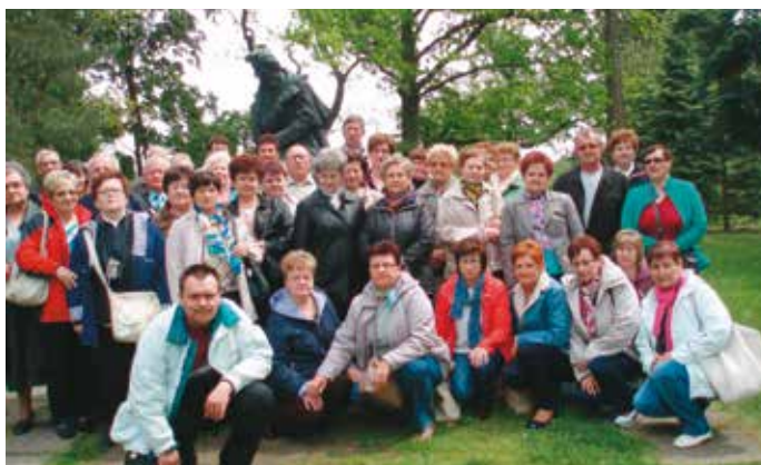
Przed pomnikiem Fryderyka Chopina w Żelazowej Woli

ni zamkowej, ale niestety nie znaleźli go. Maj to również czas wzmożonej działalności kół terenowych. W kilku z nich odbyły się zebrania sprawozdawcze z udziałem przedstawicieli Zarządu Oddziału Rejonowego. Takie spotkania zgodnie ze statutem powinny się odbyć przynajmniej raz na kwartał w każdym kole. Ale oprócz tej obowiązkowej działalności zarządy starają się zadbać o przyjemne i pożyteczne spędzenie czasu przez seniorów. Członkowie koła w Rychtału pokochali przyrodę i jej piękne okazy podziwiali w Arboretum w Stradomii i w Laskach. Wyjazdy te połączyli z pieczeniem kiełbasek, zabawą taneczną i zakupami oryginalnych sadzonek do swoich ogrodów. W niektórych kołach odbyły się imprezy z okazji Dnia Matki połączone z Dniem Ojca przypadającym wprawdzie dopiero w czerwcu, ale organizatorzy zawsze umiejętnie łączą oba te święta. Za-