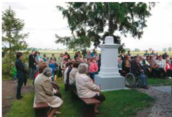
Przy kaplicy zebrało się liczne grono wiernych