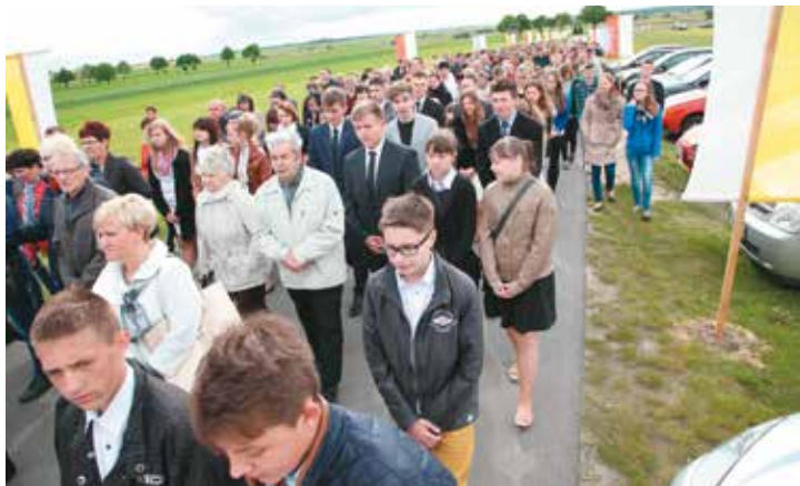
Procesja do Sanktuarium była świadectwem wiary