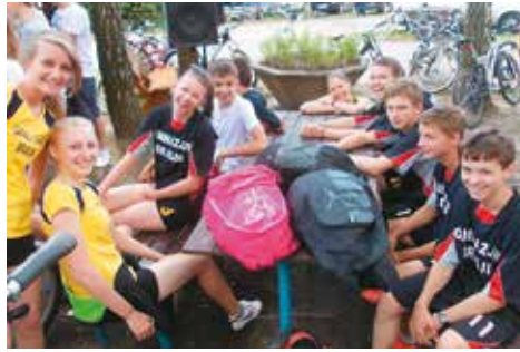
Gimnazjaliści na triathlonie w Mikorzynie

8 maja 2014 r. na terenie miasteczka ruchu drogowego w Baranowie odbyły się eliminacje powiatowe Ogólnopolskiego Turnieju Wiedzy o Bezpieczeństwie w Ruchu Drogowym. Turniej składał się z części teoretycznej i praktycznej (jazda rowerem po torze sprawnościowym oraz ćwiczenia z zakresu udzielania pierwszej pomocy przedmedycznej). Gimnazjaliści z Bralina po raz kolejny zaprezentowali się bardzo dobrze i w ogólnej punktacji zajęli 2. miejsce, ustępując jedynie uczniom z Mroczenia. Drużynę w bieżącym roku stanowili