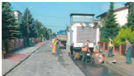
Prace posuwają się naprzód

Trwa przebudowa ulicy Lipowej w Bralinie. Wykonawcą robót jest Kępińskie Przedsiębiorstwo Drogowo-Mostowe wyłonione w drodze przetargu. Drugi i ostatni z zaplanowanych etapów polega na ułożeniu nowej warstwy ścieralnej z betonu asfaltowego, wykonaniu po drugiej stronie nowego chodnika z kostki betonowej wraz ze zjazdami, wykonaniu krawężników, ścieku przykrawężnikowego, elementów kanalizacji deszczowej oraz innych drobnych robót i czynności. Termin zakończenia robót nastąpi do 30 czerwca 2014 r. Realizacja inwestycji wyniesie 408,8 tys. zł.