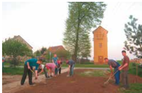
Teren zagospodarowują mieszkańcy Taboru Wielkiego

Od końca kwietnia mieszkańcy Taboru Wielkiego mają nowy, utwardzony kostką brukową plac, zlokalizowany tuż za obiektem byłej szkoły. Jego realizacja miała na celu przede wszystkim stworzenie bazy do organizacji na terenie miejscowości imprez rekreacyjnych, sportowych i kulturalnych, ale także poprawę estetyki wiejskiej przestrzeni publicznej i atrakcyjności miejscowości.