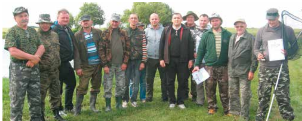
Uczestnicy zawodów wędkarskich dla dorosłych