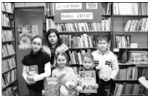
Rekordowi „czytacz” nagrodzeni

Aby zdobyć miano czytelnika roku należało systematycznie wypożyczać i czytać książki oraz zachęcać innych do czytania, brać udział w imprezach organizowanych przez bibliotekę. Głównym kryterium dla Komisji była ilość przeczytanych książek w 2010 roku oraz popularyzowanie książki i czytelnictwa.