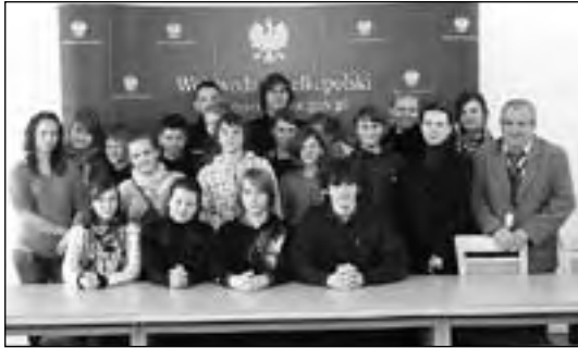
Z wizytą w Urzędzie Marszałkowskim w Poznaniu

W jego ramach w czerwcu minionego roku udaliśmy się na wycieczkę rowerową do Kępna, gdzie zwiedzaliśmy ratusz, Muzeum Ziemi