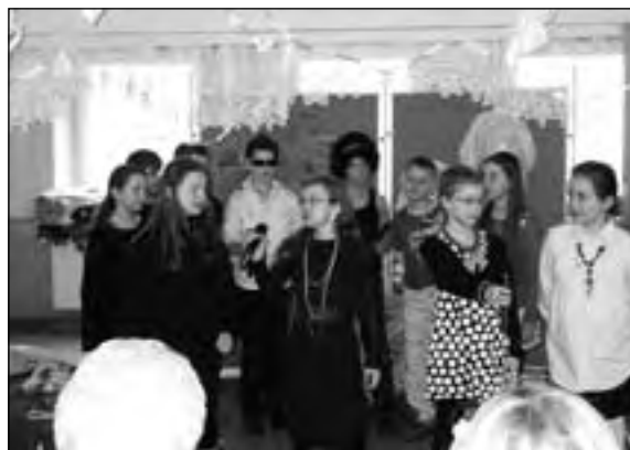
Wnuczęta zaprezentowały się znakomicie

Pomiędzy kolejnymi częściami programu zebrani wysłuchali młodych instrumentalistów: Fi-