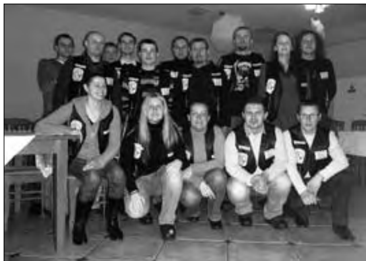
Podczas spotkania wigilijnego FC „Falcon” Bralin

Gospodarzem i organizatorem spotkania był klub Steel Roses MC Poland. W sali obrad pojawili się przedstawiciele 110 klubów, w tym 17 MC. Rada Kongresu w składzie: ROAD RUNNERS MC POLAND, GREMIUM MC POLAND, STEEL ROSES MC POLAND, REBELS OF ROAD MC POLAND, IRON ELEPHANT MC POLAND ustaliła, że prawo do noszenia pełnych barw na plecach uzyskało 12 klubów, w tym Fal-