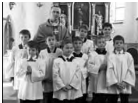
Życzymy, by młodym ministrantom starczyło zapału na długie lata

Sam obrzęd ustanowienia miał następujący przebieg: najpierw kandydaci zostali imiennie przedstawieni, następnie rodzice kandydatów wyrazili publicznie zgodę na podjęcie przez ich synów służby ministranckiej oraz zapewnili o tym, że będą współpracować z duszpasterzami nad dalszą formacją swoich synów. Wreszcie sami kandydaci złożyli swoje przyrzeczenie podjęcia ministranckiej służby. Następną czę-