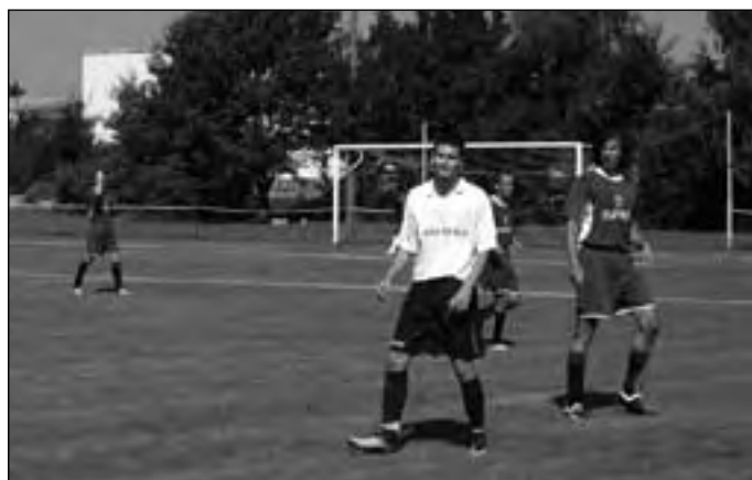
Mecz „Sokoła” Bralin z Lilią Mikstat