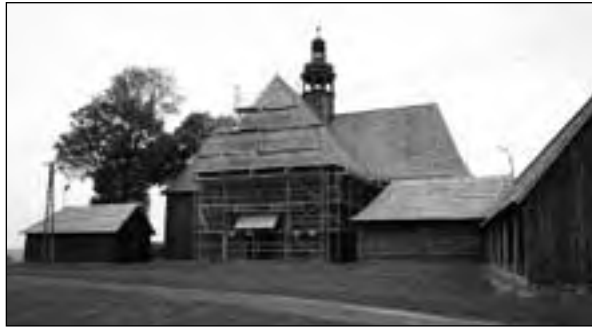
Pólko od strony północnej podczas remontu

mocą Urzędu Gminy Bralin cieszą się wszelkie inicjatywy promujące to szczególne i drogie nam miejsce, co mogliśmy widzieć przy realizacji podświetlanej Tablicy Informacyj-