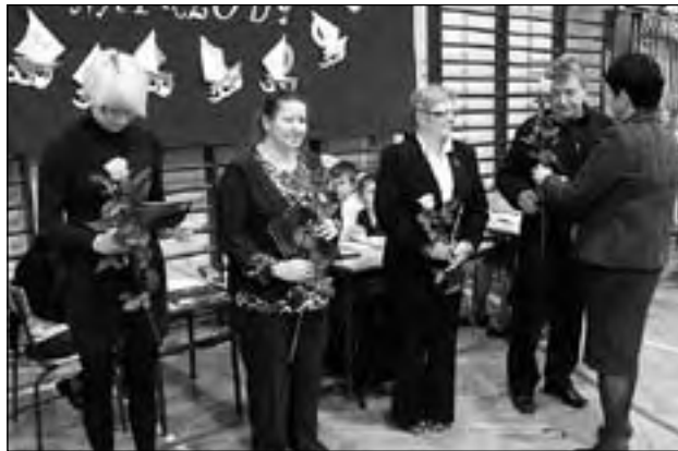
Nagrody dyrektora szkoły dla pracowników obsługi szkół