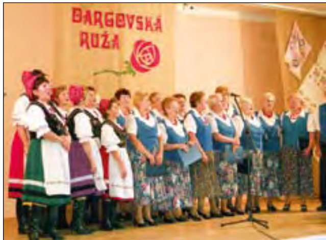
Zespoły: z Bralina i Svinicy wspólnie zaśpiewały po polsku

Od 16 do 20 września 2010 r. delegacja z gminy Bralin gościła w partnerskiej gminie Svinica na Słowacji. Obie gminy współpracują oficjalnie ze sobą od 19 maja 2006 r., a współpraca polega na stałych cyklicznych wymianach przedstawicieli różnych grup społecznych obu przyjaźnionych gmin.