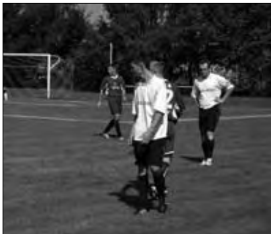
Mecz „Sokoła” Bralin z Lilią Mikstat

Od 22 sierpnia br. trwają rozgrywki piłkarskie kaliskiej klasy „A” ZINA, grupy II. Do tej pory zawodnicy rozegrali osiem pełnych kolejek oraz cztery rundy Okręgo-