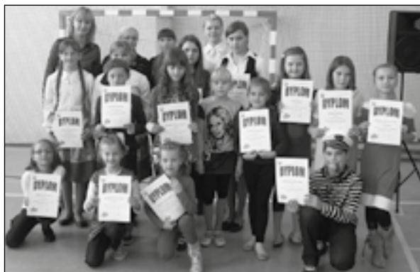
Uczestnicy gminnych eliminacji do XII Powiatowego Przeglądu Piosenki