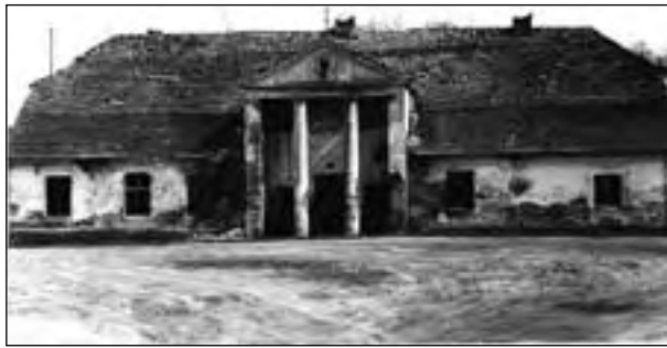
Dawna karczma w Mielęcinie zniknęła z krajobrazu naszej gminy

w tym miejscu kościoła. Tak się jednak nie stało. W przyprawie złości kobieta miała