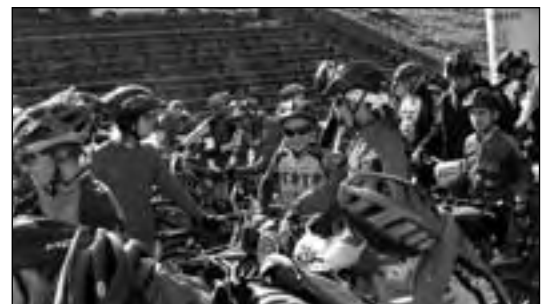
Tuż przed startem do wyścigu