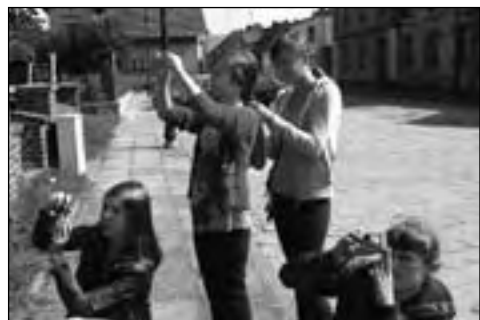
Podczas pleneru fotograficznego przy kościele poewangelickim w Bralinie

Pod opieką Agnieszki Czarnasiak, nauczycielki historii, kilkunastoosobowa gru-