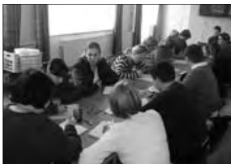
Podczas kursu obsługi klienta

ny kurs obsługi komputera, 30-godzinny kurs techniki sprzedaży oraz 30-godzinny kurs obsługa klienta. W listopadzie zrealizują jeszcze 12-godzinny warsztat doradztwa zawodowego, 12-godzinny kurs obsłu-