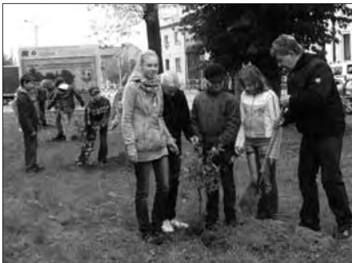
Uczniowie z bralińskiej podstawówki posadzili drzewka wokół dawnego kościoła ewangelickiego...

Placówki oświatowe we współpracy z Urzędem Gminy Bralin przyłączyły się do ogólnopolskiej i międzynarodowej akcji sadzenia drzew. Święto Drzewa jest programem edukacji ekologicznej Klubu „Gaja” realizowanym od 2003 roku i przypadającym na dzień 10 października. Nasadzeniu na gruntach gminnych kilkudziesięciu drzew m.in. klonów, dębów, jarząbów, sosen, lip czy tu towarzyszył bogaty program edukacji ekologicznej, przeprowadzo-