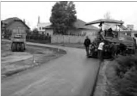
Będzie droga jak się patrzy

Dotychczasowa nawierzchnia, niedopodana, z wybojami i dziurami utrudniała poruszanie się pojazdom i pieszym użyt-