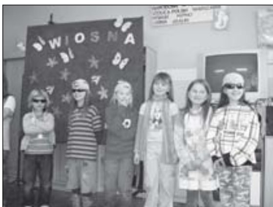
Barwnie i wesoło – jak na Dzień Wiosny przystało

„Kiedy w termometrach podnosi się rękę, kiedy to ze śniegiem deszcz pada na zmianę – wiadomo, że Wiosna przyjsć ma do nas chęć...”. Tymi słowami przedstawiciele