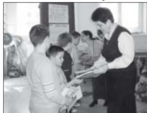
Były konkursy, są nagrody