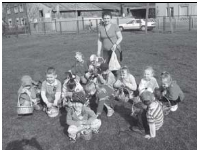
Poszukiwaniom łakoci od zajęca sprzyjała wiosenna aura

tradycji funkcjonuje wiele zwyczajów związanych z tym świętem, jednym z nich jest zajęzek. Tradycyjnie przed święta-