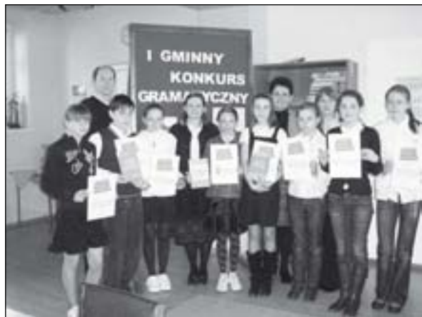
Laureaci i jury I Gminnego Konkursu Gramatycznego