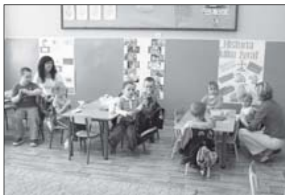
Podczas przerwy śniadaniowej

mniej po kilka godzin dziennie, uczyło się i bawiło z rówieśnikami pod opieką nauczycielki i w ten sposób poznawało otaczający je świat oraz doskonaliło swoje umiejętności. Temu właśnie mają służyć inne formy wychowania przedszkolnego. Mają przekonać do edukacji przedszkolnej tych, którzy