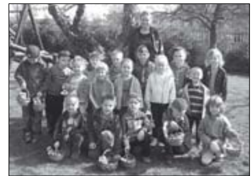
Zając spisał się znakomicie

Każdej wiosny przed Wielkanocą przedszkolaki z Zespołu Szkół w Nowej Wsi Książęcej poszukują koszyczków ukrytych przez zajaczka. Na ten szczególnie moment dzieci czekają z niecierpliwością. Nie inaczej było i w tym roku. 8 kwietnia, przy pięknej sło-