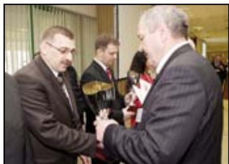
Podczas uroczystej gali

Niezmiernie miło nam poinformować Państwa, że gmina Bralin zakończyła 2008 rok jako dwunasta gmina wiejska w Polsce. 2 kwietnia br. w Warszawie podczas XII Zgromadzenia Ogólnego Związku Powiatów Polskich w gronie „pucharowych” laureatów, tzw. „TOP 15” znalazła się gmina Bralin.