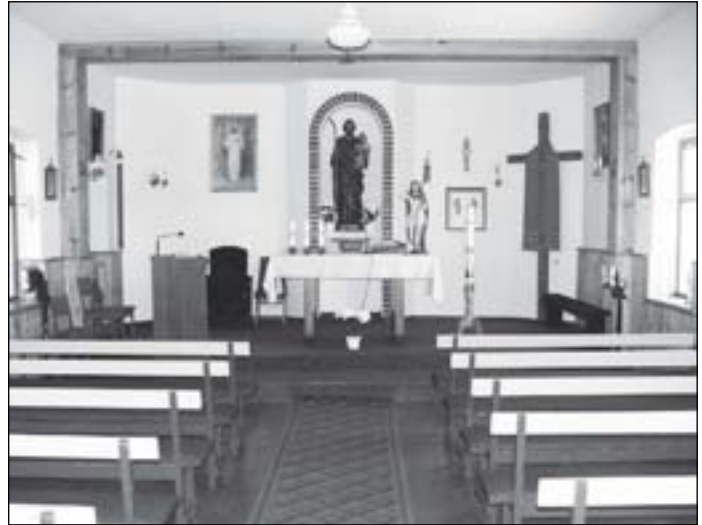
Wnętrze kaplicy w Czerminie