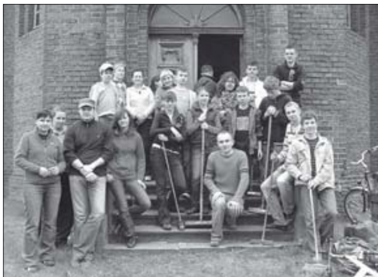
Pamiątkowe zdjęcie po zakończeniu prac

Spotkanie odbyło się w niezwyklej scenerii, bo w dawnym kościele ewangelickim w Bralinie. Poprzez organizację imprezy w takim miejscu chcieliśmy zwrócić uwagę mieszkańców na zabytkowy obiekt, który jest jednym z najlepiej zachowanych