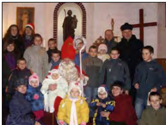
W świątecznym nastroju. Po lewej: członkowie zespołu „Ale Babki” podczas spotkania opłatkowego, a po prawej: św. Mikołaj z odwiedzinami w kaplicy w Czerminie.