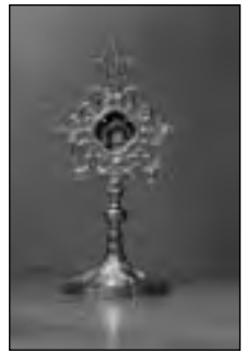
Relikwiarz z relikwiami św. Ojca Pio