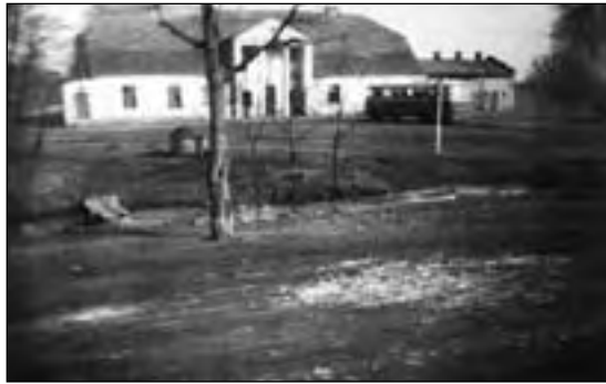
Widok dworu na przełomie lat 60. i 70. XX wieku

Kiedy dwa miesiące temu prosiłem Państwa o wspomnienia związane z dawną mie-