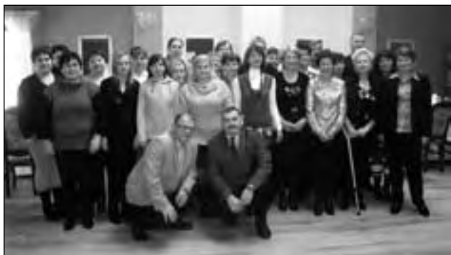
Podczas podsumowania projektu realizowanego przez braliński GOPS