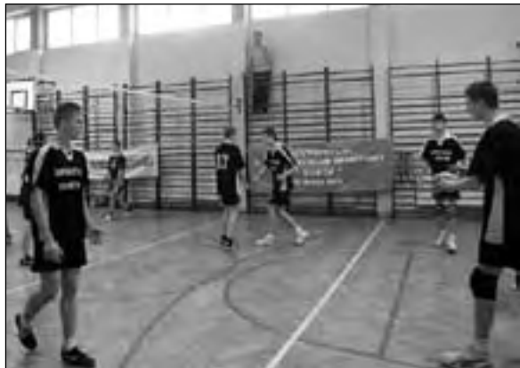
Meczom towarzyszyły spore emocje

9 grudnia 2010 r. w Gimnazjum w Bralinie odbył się Turniej Piłki Siatkowej o Puchar Dyrektora Gimnazjum. Impreza z okazji Święta Szkoły na stałe zagościła w kalendarzu wydarzeń sportowych. W tegorocznym turnieju zagrały drużyny dziewcząt i chłopców z Mikorzyna, Perzowa i Bralina. Turniej rozegrano systemem każdy z każdym. Wszystkie mecze przebiegały na dobrym wyrównanym poziomie, a o końcowej kolejności zdecydowały bardzo emocjonujące spotkania zaproszonych drużyn. Ostateczna klasyfikacja przedstawia się następująco. W grupie dziewcząt 1. miejsce – Perzów, 2. miejsce – Bralin, 3. miejsce – Mikorzyn. Końcowa klasyfikacja chłopców wygląda następująco: 1. miejsce – Bralin, 2. miejsce – Perzów, 3. miejsce – Mikorzyn. Gimnazjum