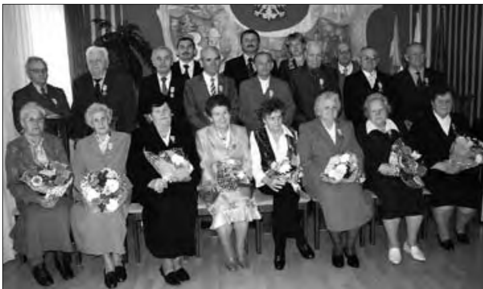
To niewątpliwie podniosłe i wzruszające spotkanie