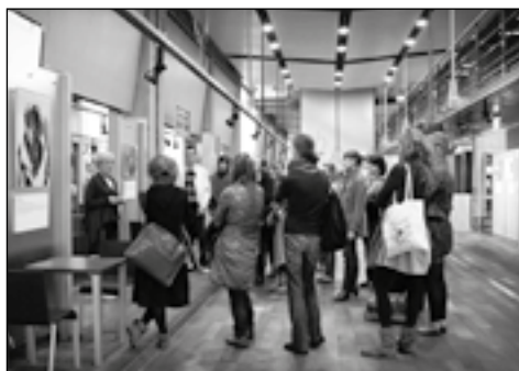
Młodzi menadżerowie bogatsi w zdobytą wiedzę powalczą o zdobycie grantów dla swojej miejscowości

wiadał o swojej pasji i o tym, jak wpłynęła ona na ich teraźniejsze działania. Spotykali się zarówno z osobami znanymi z działań w całej Polsce, jak i w środowiskach lokal-