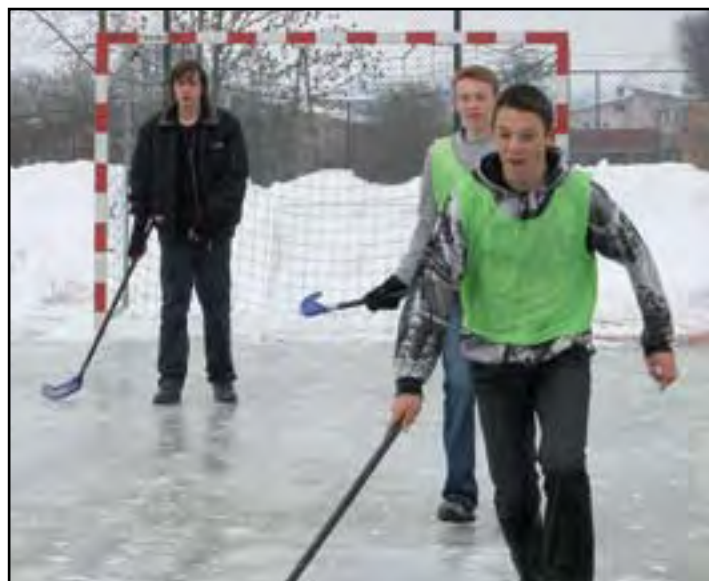
Z zimy najbardziej chyba cieszą się dzieci i młodzież. Po lewej: mikołajkowo-zimowe nastroje wśród gimnazjalistów, po prawej: podczas zajęć wychowania fizycznego.