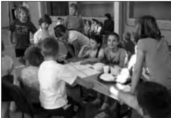
Zdobytą wiedzę trzeba było utrwalić w praktyce

Końcowym akcentem uroczystości był poczęstunek złożony z rogali marcińskich. Fundatorem