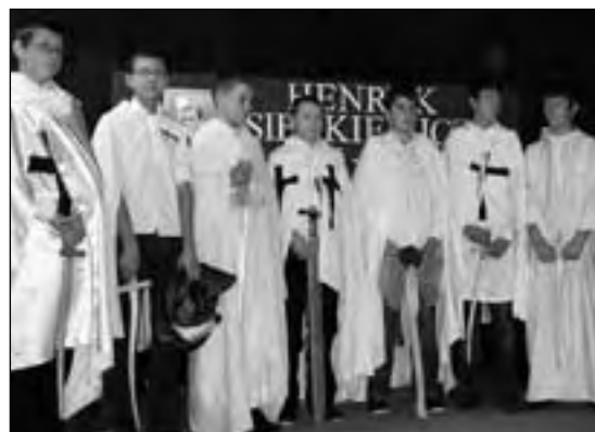
Uczniowie klasy 11b wcielili się w role braci zakonnych

Spotkaniu w kinie „Niesob” towarzyszyła wystawa prac plastycznych. Wszystkie dotyczyły lektury „Krzyżacy”. Jury wyróżniło trzech autorów, choć nie było to łatwe