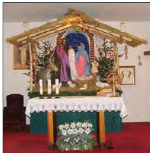
Bożonarodzeniowy wystrój kaplicy w Czerminie.