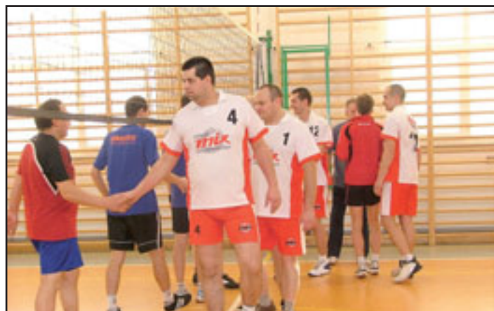
Mecze przebiegały w przyjaznej atmosferze