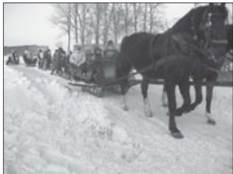
Jak kulig, to tylko końmi

31 stycznia 2010 r. odbył się w Nowej Wsi Książęcej festyn zimowy na pożegnanie ferii. Impreza została zorganizowana przez Radę Rodziców i grono pedagogiczne Zespołu Szkół w Nowej Wsi Książęcej. Mimo bardzo mroźnej aury przed Domem Kultury zebrała się duża grupa amatorów zimowych zabaw. Dla wszystkich