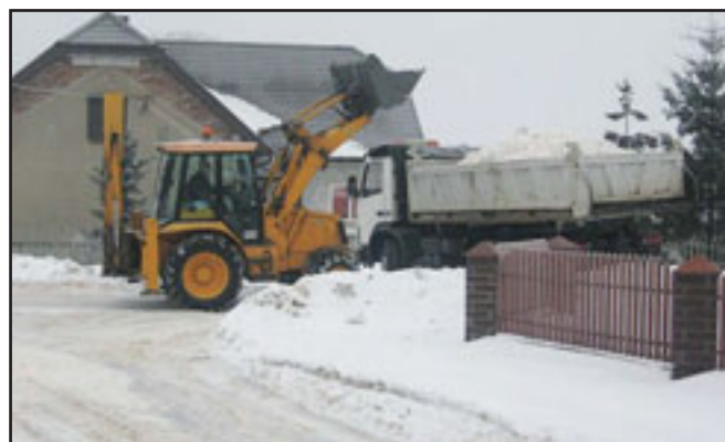
Podczas akcji wywożenia śniegu z wąskich uliczek osiedlowych w Bralinie

Zima, o czym wielu kierowców zapomina, to jedna z czterech pór roku, która naturalnie występuje w naszej szerokości geograficznej. Służby drogowe nie są w stanie jej zapobiec, ani tym bardziej zlikwidować – mogą co najwyżej łagodzić jej skutki.