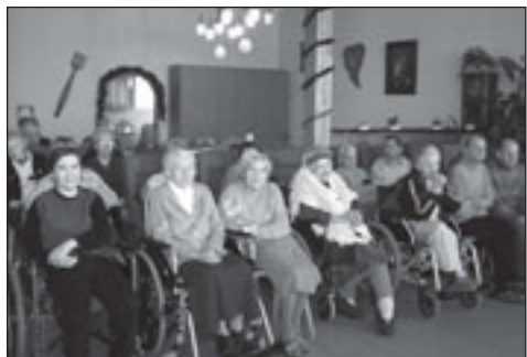
Pensjonariusze z ochotą wysłuchali koncertu „Ale Babek” z Bralina

Zespół wokalny-muzyczny „Ale Babki” śpiewa niezmiennie od 35 lat. Wrócił w tradycję naszej małej ojczyzny i towarzyszy nam na uroczystościach gminnych czy spotkaniach seniorów. Ostatnio często