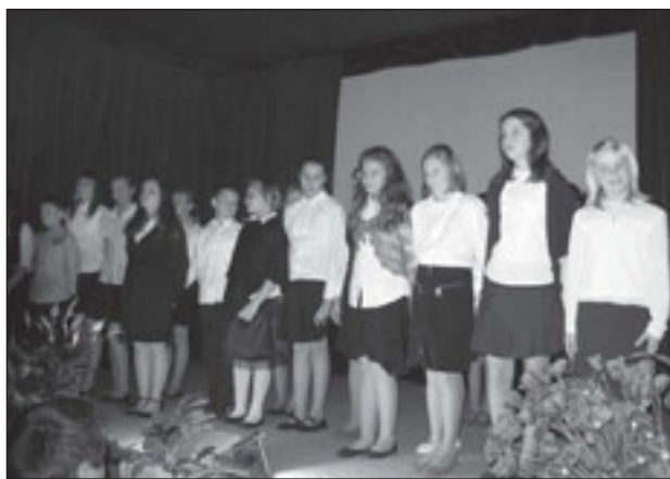
Chór szkolny podczas koncertu „Z pieśnią przez wieki” z okazji Święta Niepodległości

Przedstawiciele klas starszych wzięli też udział w etapie szkolnym Wojewódzkiego Konkursu Matematyczno-Przyrodni-