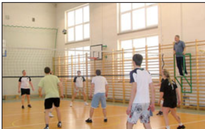
Piłka w grze