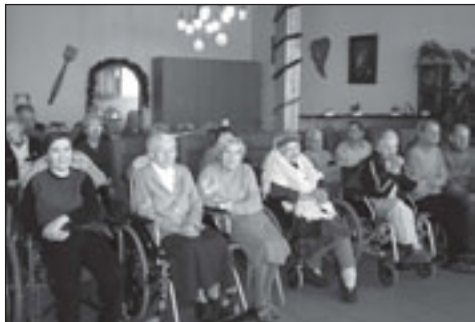
Pensjonariusze z ochotą wysłuchali koncertu „Ale Babek” z Bralina

Zespół wokalny-muzyczny „Ale Babki” śpiewa niezmiennie od 35 lat. Wrócił w tradycję naszej małej ojczyzny i towarzyszy nam na uroczystościach gminnych czy spotkaniach seniorów. Ostatnio często