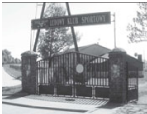
Jeszcze w tym roku stadion „Sokoła” otrzyma nowy wizerunek

(teren). W treningach uczestniczy średnio 10-15 piłkarzy. Celem, jaki postawił sobie trener zespołu seniorów jest utrzymanie