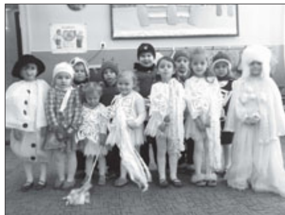
Przedszkolaki z Taboru Małego zaśpiewały dla swoich dziadków

„Twoje Przedszkole” w Taborze Małym cieszy się popularnością zarówno wśród dzieci jak i ich rodziców czy dziadków. Mieszkańców cieszy fakt, że budynek poszkolny znów tętni życiem, a takie dni jak te są okazją do spotkania się dorosłych.