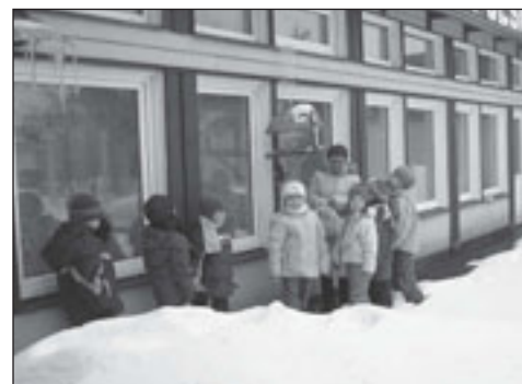
Zimą dzieci pomagają ptakom, wiosną ptaki umilą im pobyt w ogródku przedszkolnym