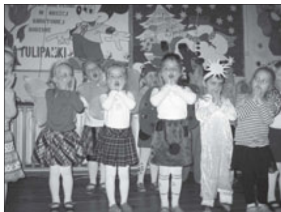
„Ho, ho, ho! – zaśpiewały przedszkolaki dla swoich babć i dziadków

Dzieci z Przedszkola „Kwiaty Polskie” w Bralinie uczęty święto babci i dziadka prezentacją bożonarodzeniowych jasełek. Na zaproszenie wnucząt 15 stycznia 2010 r. do przedszkola