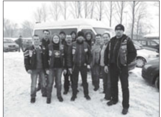
FG Falcon Bralin

co. Dodatkową gratką dla miłośników trialu oraz enduro było spotkanie ze zdobywcą Pucharu Świata 2010 w motocyklowym halowym enduro, zdobywcą tytułu Mistrza Europy w trialu w roku 2004 i wielokrotnym zdobywcą tytułu Mistrza Polski – Tadeuszem Błazusiakiem. Główną atrakcją imprezy były I Mistrzostwa Polski Motocykli Customowych współorganizowane z redakcją „Magazynu Motocyklowego dla Indywidualistów Custom”. W imprezie wzięło udział około 40 „podrasowanych” maszyn. Mistrzostwa rozgrywane były w 3 kategoriach: Custom, Best Painting oraz Streetfighter. Zwycięzcy otrzymali atrakcyjne nagrody: puchary i medale oraz nagrody rzeczowe ufundowane przez renomowane firmy Shoei oraz Modeka.