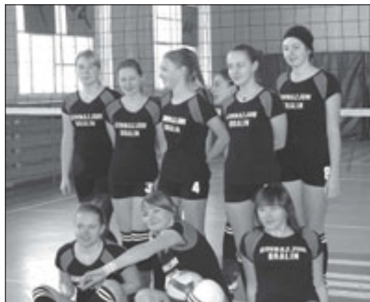
W piłce siatkowej nie mają sobie równych w powiecie

Do zawodów dziewczęta przygotowywały się od kwietnia do grudnia 2009 r. w ramach Międzyszkolnego Uczniowskiego Klubu Sportowego „Sokół”, zaś środki na ich realizację pozyskane zostały z dotacji Urzędu Gminy Bralin (zadania w zakresie kształcenia młodzieży w zespołowych grach sportowych). Dzięki funduszom zakupione zostały piłki siatkowe, a gimnazjalistki mogły wyjeżdżać na mecze sparingowe do ZSP nr 2 w Kępnie i ZSP w Słupi pod