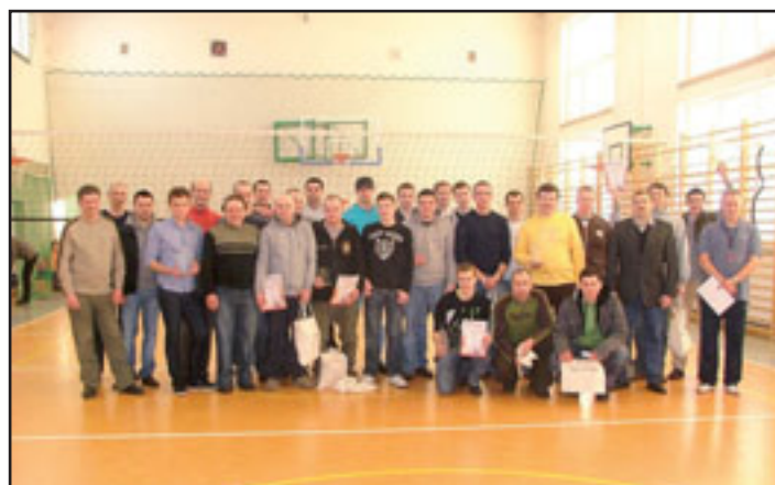
I jeszcze zdjęcie do albumu. Do zobaczenia w przyszłym roku!