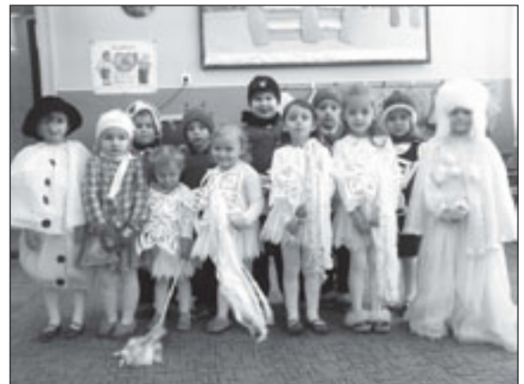
Przedszkolaki z Taboru Małego zaśpiewały dla swoich dziadków

„Twoje Przedszkole” w Taborze Małym cieszy się popularnością zarówno wśród dzieci jak i ich rodziców czy dziadków. Mieszkańców cieszy fakt, że budynek poszkolny znów tętni życiem, a takie dni jak te są okazją do spotkania się dorosłych.