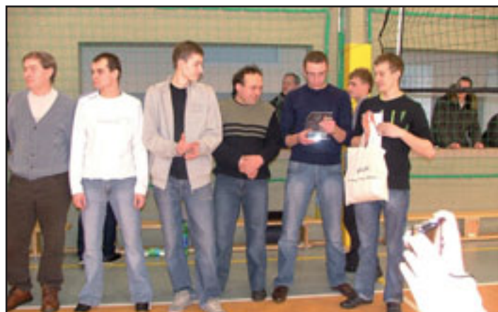
Drużyna Gidanexu górą!