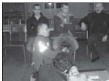
Szkolenie z zakresu pomocy przedmedycznej