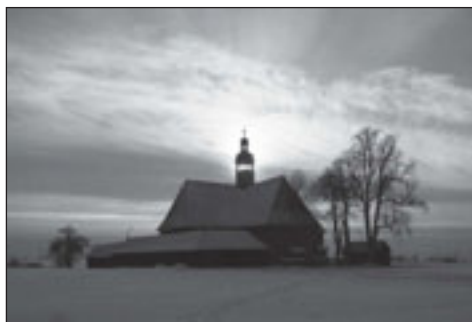
Kościół Na Pólku w zimowej szacie