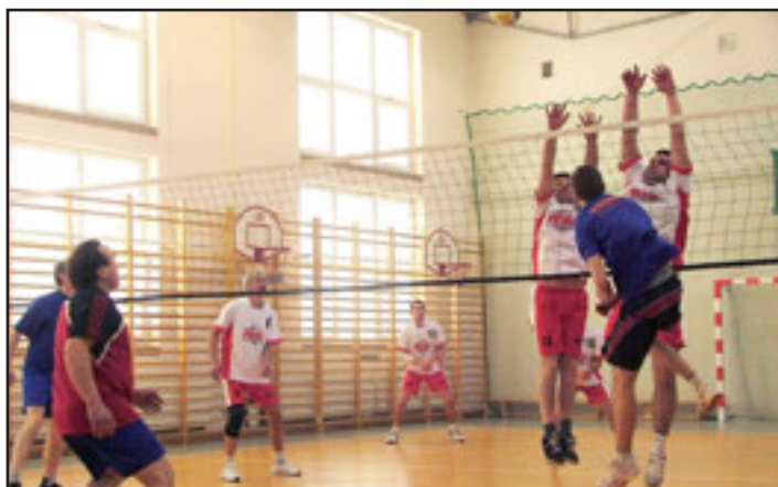
Dla kogo będzie ten punkt?