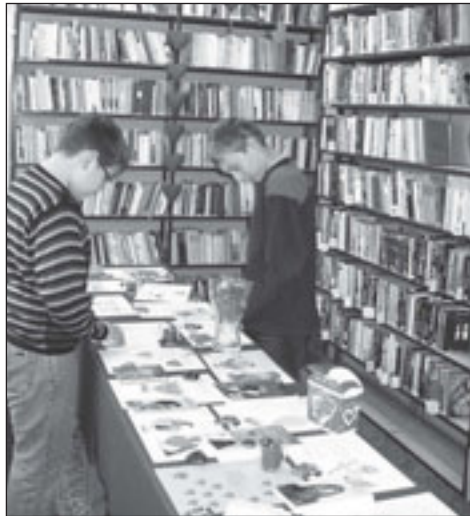
Co o miłości piszą poeci, jak miłość pojmują psychologowie? O tym okolicznościowa wystawa w bibliotece