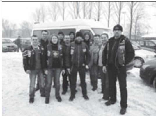
FG Falcon Bralin

co. Dodatkową gratką dla miłośników trialu oraz enduro było spotkanie ze zdobywcą Pucharu Świata 2010 w motocyklowym halowym enduro, zdobywcą tytułu Mistrza Europy w trialu w roku 2004 i wielokrotnym zdobywcą tytułu Mistrza Polski – Tadeuszem Błazusiakiem. Główną atrakcją imprezy były I Mistrzostwa Polski Motocykli Customowych współorganizowane z redakcją „Magazynu Motocyklowego dla Indywidualistów Custom”. W imprezie wzięło udział około 40 „podrasowanych” maszyn. Mistrzostwa rozgrywane były w 3 kategoriach: Custom, Best Painting oraz Streetfighter. Zwycięzcy otrzymali atrakcyjne nagrody: puchary i medale oraz nagrody rzeczowe ufundowane przez renomowane firmy Shoei oraz Modeka.