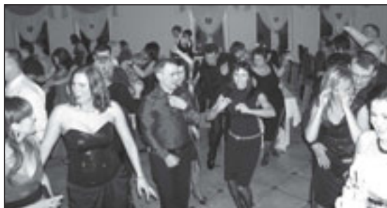
To już ostatnie szaleństwa w tegorocznym karnawale

13 lutego 2010 roku w tanecznym rytmie i przy suto zastawionych stołach pożegnano karnawał na zabawie zorganizowanej przez Radę Rodziców przy Szkole Podstawowej im. Mikołaja Kopernika w Bralinie. Odbyła się ona w restauracji „Złoty Klos” w Bralinie, która zapewniła doskonałą kuchnię i miłą obsługę. Do tańca porywająco przygrywał zespół „Max Dance”. Całej zabawie towarzyszył wysmienity nastrój, a gościom dopisywały humory. Dzięki hojności sponsorów w trakcie imprezy zorganizowano loterię fantową, z której całkowity dochód przeznaczony został na potrzeby szkoły i jej uczniów.