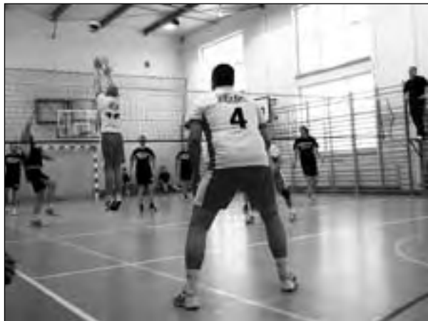
Pełen zaangażowania mecz ZW „Mix” contra przedstawiciele oświaty

30 stycznia 2011 r. odbyła się X edycja Turnieju Piłki Siatkowej Drużyn Zakładowych o Puchar Wójta Gminy Bralin, którego organizatorem był Referat Oświaty, Kultury, Sportu i Promocji przy Urzędzie Gminy. Do sportowej rywalizacji stanęło 5 drużyn: Gidanex z Bralina, Konstal Bralin, przedstawiciele placówek oświatowych, Zakład Wielobranżowy „Mix” z Goli i Zakład Me-