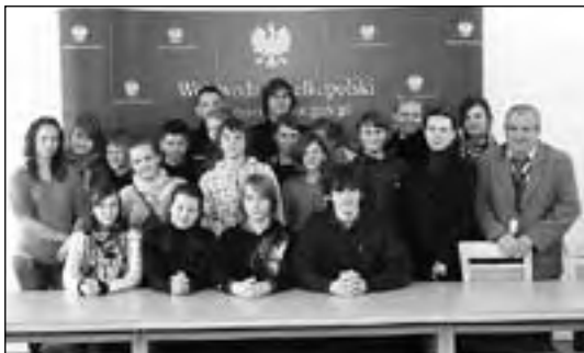
Z wizytą w Urzędzie Marszałkowskim w Poznaniu

W jego ramach w czerwcu minionego roku udaliśmy się na wycieczkę rowerową do Kępna, gdzie zwiedzaliśmy ratusz, Muzeum Ziemi