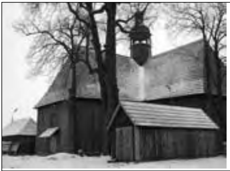
W sanktuarium trwają prace remontowo-konserwatorskie

Nowy rok duszpasterski 2011 to wielkie wezwanie dla naszej wspólnoty parafialnej, a zarazem wspaniały czas łaski, który powinien ożywić nasze życie religijne we wspólnocie – najpierw rodzinnej, a potem parafialnej, i jeszcze bardziej nauczyć nas żyć w komunii, czyli jedności, zjednoczeniu z Bogiem i z ludźmi.