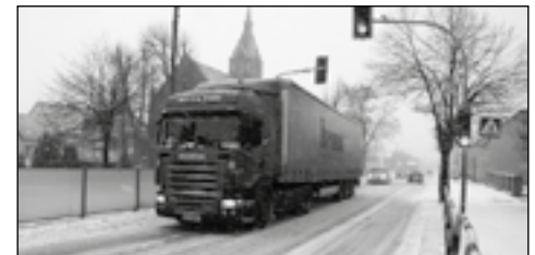
Pierwszy atak zimy nastąpił pod koniec listopada

Zima chwilowo „odpuściła”. Śnieg, który zalegał od końca listopada ubiegłego roku, stopniał, a piaskarki i plugi nie są już nieodzownym obrazkiem na naszych drogach. Drogowcy zajmujący się zimowym utrzymaniem dróg póki co śpią spokojnie, a my zaczynamy już wyczekiwać wiosny.