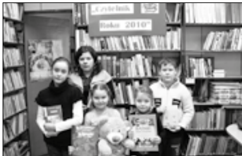
Rekordowi „czytacz” nagrodzeni

Aby zdobyć miano czytelnika roku należało systematycznie wypożyczać i czytać książki oraz zachęcać innych do czytania, brać udział w imprezach organizowanych przez bibliotekę. Głównym kryterium dla Komisji była ilość przeczytanych książek w 2010 roku oraz popularyzowanie książki i czytelnictwa.