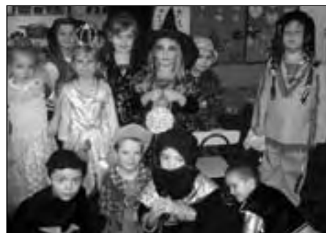
Bajkowe stroje, muzyczne hity i zabawa z rówieśnikami to recepta na udany bal przedszkolaka

28 stycznia br. „Kwiaty” bawiły się w przedszkolu na balu przebierańców. Rodzice, jak co roku, stanęli na wysokości zadania i przebrali swoje pociechy w zabawne stroje. Nauczycielki zadbały o wystrój sal, szampańską muzykę i ciekawe konkurencje. Rada Rodziców przygotowała poczęstunek: