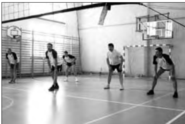
Drużyna Progressu w pełnej gotowości

Po emocjonujących meczach Puchar Wójta Gminy Bralin powędrował do drużyny Gidanexu, która obroniła ubiegłoroczne zwycięstwo. Na drugim miejscu znaleźli się zawodnicy reprezentujący ZW „Mix”, utrzymując swoją pozycję z poprzedniego