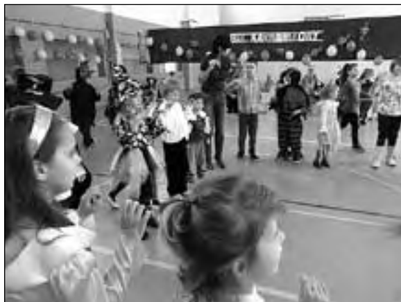
Wróżki, księżniczki, Indianki i piraci – wszyscy dobrze się bawili

Z kolei 29 stycznia 2011 roku w nowowiejskiej szkole odbył się bal karnawałowy dla dzieci. Wszyscy uczniowie z niecierpliwością wyczekiwali wspólnej zabawy i tańców w gronie kolegów i koleżanek.