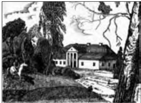
Rysunek mielecińskiej karczmy, wykonany w 2009 r. na podstawie fotografii z lat 60.-70. XX w. Autor: Zenon Kasprzak z Bralina

– Moje wspomnienia związane z karczmą w Mielęcinie dotyczą przełomu lat sześćdziesiątych i siedemdziesiątych XX w. Dokładnych dat wydarzeń nie pamiętam, byłam wówczas