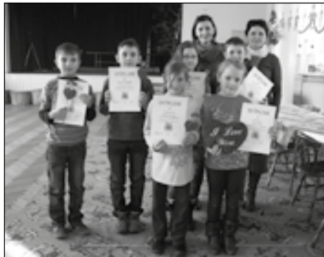
Uczestnicy konkursu otrzymali dyplomy i upominki

15 lutego br. Biblioteka Publiczna w Bralinie rozstrzygnęła konkurs literacko-plastyczny pt. „Walentynka dla bliskiej