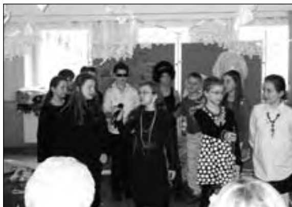
Wnuczęta zaprezentowały się znakomicie

Pomiędzy kolejnymi częściami programu zebrani wysłuchali młodych instrumentalistów: Fi-