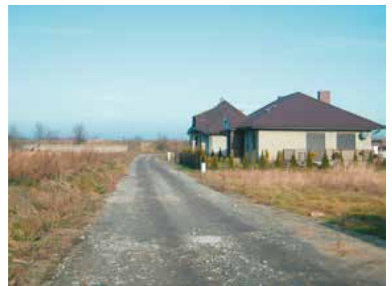
Przy ulicy Strażackiej powstaje zabudowa mieszkaniowa