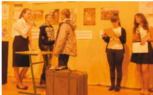
Święto Szkoły. Henryk Sienkiewicz wynajmuje pokój w paryskim hotelu