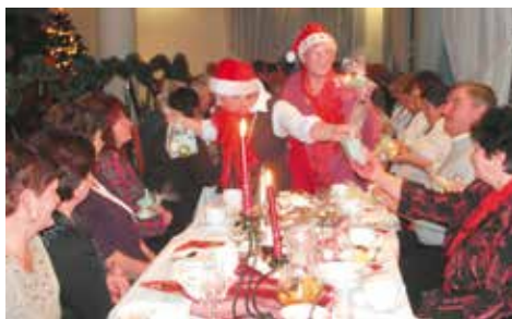
Wigilia w Baranowie

Praca na rzecz ludzi trzeciego wieku jest bardzo absorbująca, ale tym, którzy swój wolny czas poświęcają dla innych, daje wiele radości i satysfakcji. Działalność oddziału jest bardzo atrakcyjna, bo oprócz wyjazdów na wczasy i wycieczek jednodniowych każdy członek może znaleźć coś dla siebie. Zarządy kół terenowych organizują przede wszystkim statutowe Dni Seniora i Inwalidy, spotkania z okazji różnych świąt, np. Dnia Matki i Ojca, ale też wieczorki taneczne, pikniki przy grillu, tradycyjne biesiady z balladą i piosenką, spotkania z poezją, śniadania wielkanocne i wspólne wigilie. Seniorzy razem obchodzą rocznice urodzin, imienin, przygotowują małe formy sceniczne, wystawiają jasełka wg własnych scenariuszy, z papieroplastyki wykonują śliczne małe arcydzieła, które rozdają uczestnikom spotkań, biorą udział w różnych warsztatach i wykładach, m.in.