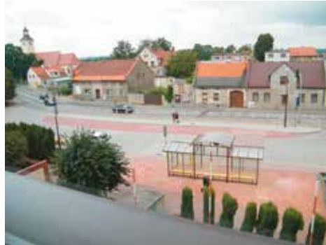
Zostaw podatek dochodowy w swojej gminie

dokument w domu, weź go ze sobą. Nie posiadasz? Trudno, zameldujemy i bez niego.