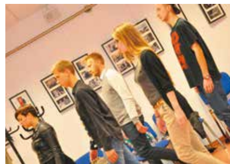
Młodzież podczas warsztatów teatralnych w Warszawie

Mini pracownia filmowa - główną ideą warsztatu było wykreowanie amatorskiego zespołu produkcji filmowej składającego się z młodzieży m.in. szkół średnich i starszych, którzy po przejściu pewnego etapu szkoleniowego podjęli próbę poprowadzenia całego procesu powstania krótkometrażowego filmu z udziałem młodych osób zaangażowanych w różne role: od produkcji, pisanie scenariuszy, reżyserię, oprawę fil-