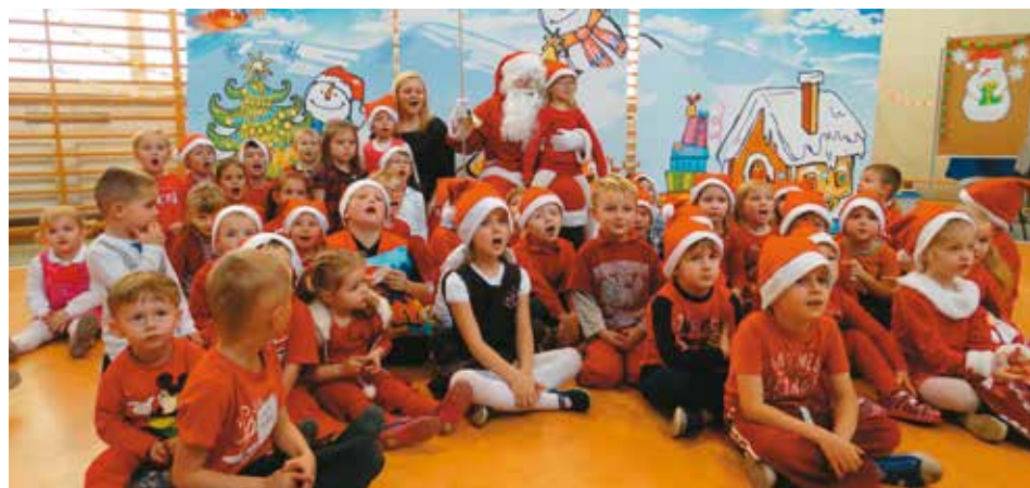
Radosne spotkanie z Mikołajem w przedszkolu w Nowej Wsi Książęcej

Na zaproszenie dyrektor i Rady Rodziców Przedszkola „Kwiaty Polskie”