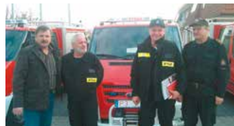
Strażacy odbierali nowy samochód w Częstochowie

Do tej pory jednostka użytkowała 30-letni o dużym stopniu awaryjności samochód pożarniczy marki Żuk GLBM. Biorąc pod uwagę, iż jednostka znajduje się przy drodze krajowej nr 8, gdzie dochodzi do dużej liczby wypadków i innych zdarzeń, zakup wskazanego samochodu stał się tym