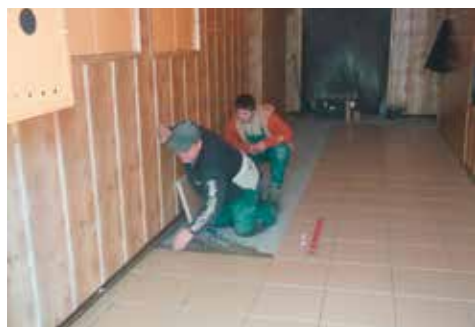
Trwają prace w Domu Ludowym w Nowej Wsi Książęcej