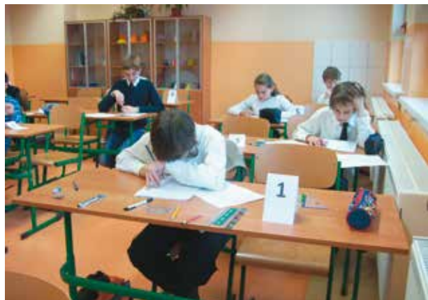
Zmagania konkursowe. Oj, chyba ucale nie jest łatwo...