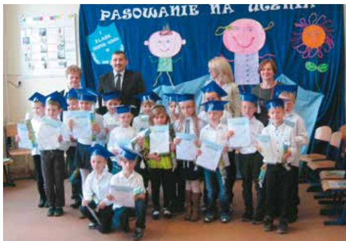
Pierwszaki z Nowej Wsi Książęcej już po ślubowaniu

Pasowanie na ucznia w Zespole Szkół w Nowej Wsi Książęcej już za nami. 8 listopada