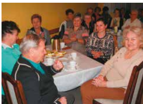
Seniorzy na spotkaniu z poezją

Spotkanie odbyło się w salce OSP „Florian” i na tyle, na ile to było możliwe lokalowo, salka zapełniła się po brzegi. O przyjazny i sympatyczny klimat podczas