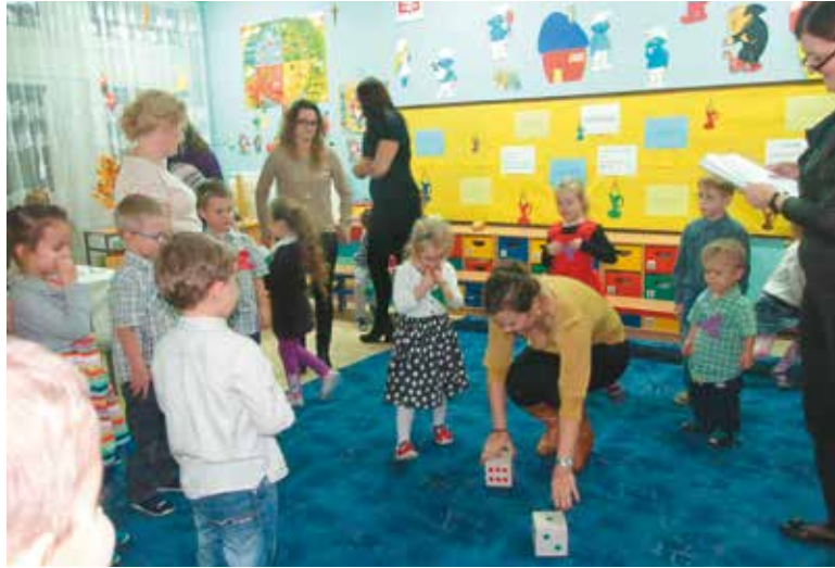
Zabawy z rodzicami podczas wieczoru andrzejkowego przyniosły wiele radości

Przyjęcie do grona przedszkolaków to bardzo ważne wydarzenie w życiu każdego dziecka, które po raz pierwszy przekroczyło przedszkolne progi. Uroczyste pasowanie „Kwiatuszków” miało miejsce 23 października w godzinach popołudniowych. Ceremonia przyjęcia w poczet przedszkolaków przebiegała w obecności kolegów, koleżanek, nauczycieli oraz przedstawicieli z Rady Rodziców i miała formę zabawnego egzaminu. Na uroczystość złożyły się konkursy zręcznościowe, popisy wokalne, taneczne oraz recytatorskie. Po