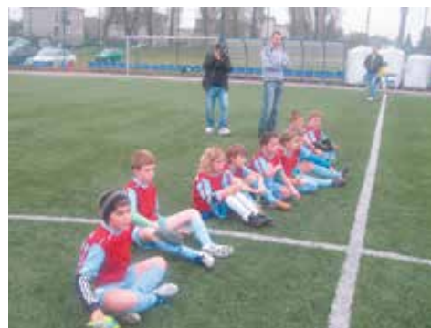
Drużyna „orlika” podczas treningu

Najlepszy mecz zespół zagrał u siebie z Polonią Kępno oraz