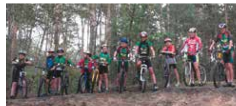
Mamy 10 młodych miłośników kolarstwa w gminie Bralin

Młodzież regularnie ćwiczy na przygotowanej przez siebie trasie XC w bralińskim lesie, przemierza lokalne polne ścieżki, korzysta z dobrodziejstw terenowych Kobyłej Góry, ale też wykorzystuje do treningów mniej uczęszczane osiedlowe ulice. Oprócz ćwiczeń na rowerze ważny jest ogólny rozwój fizyczny i tu niezwykle pomocne są zajęcia wuefu i SKS-y w szkole, dobra współpraca z wuefistami, a także zajęcia sportowe, które oferują dzieciom i młodzieży lokalne stowarzyszenia, pozyskując środki i realizując projekty. D. Drelak dba o zróżnicowanie treningów, dlatego w okresie zimowym pojawia się siłownia, narty biegowe, zajęcia gimnastyczne kształtujące koordynację i zmysł orientacji własnego ciała. Od października aż do wiosny raz w tygodniu trening odbywa się na basenie. W tym roku wejściówki na basen na cały sezon zapewnił zawodnikom LKS „Sokół” Bralin – sekcja rowerowa MTB Team „Sokół” Bralin - Vidioni, który pozyskał środki na ten cel z budżetu gminy, składając ofertę realizacji zadania publicznego. Dzięki temu wsparciu młodzież może