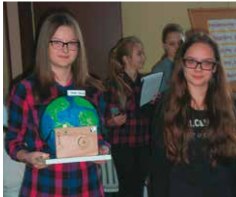
Prezentacja atrybutów wybitnych Polaków