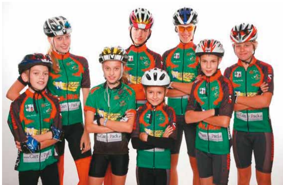
Dla tych młodych ludzi rower to prawdziwa pasja, miłość i sposób na każdą wolną od nauki chwilę