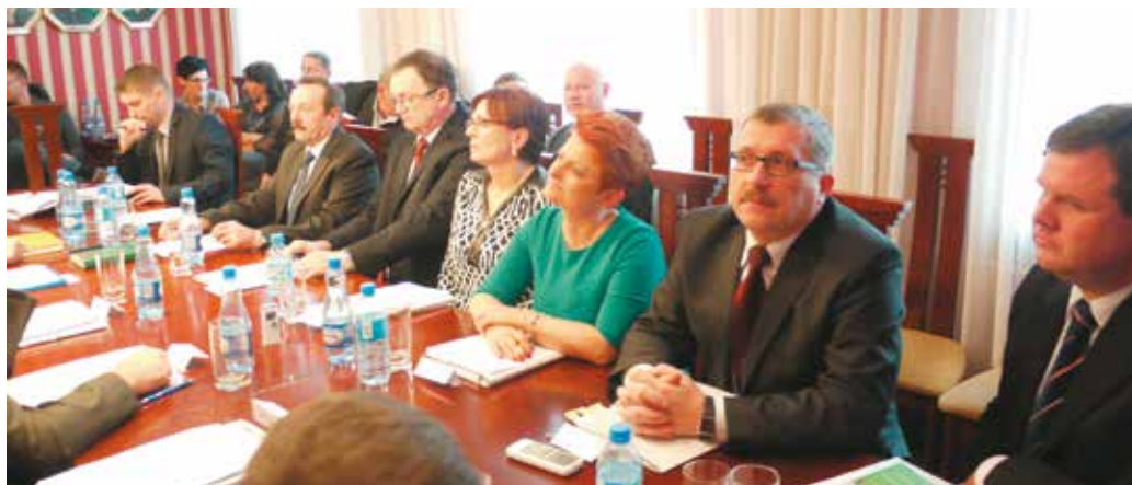
Podczas pierwszego posiedzenia rady w dniu 28 listopada 2014r.