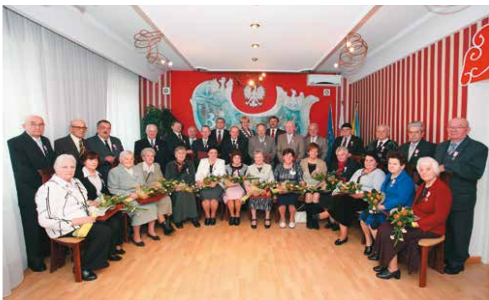
Aż 15 par małżeńskich obchodziło w tym roku 50. rocznicę ślubu