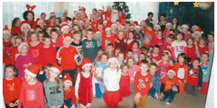
W szkole roiło się od czerwonych atrybutów mikołajkowych