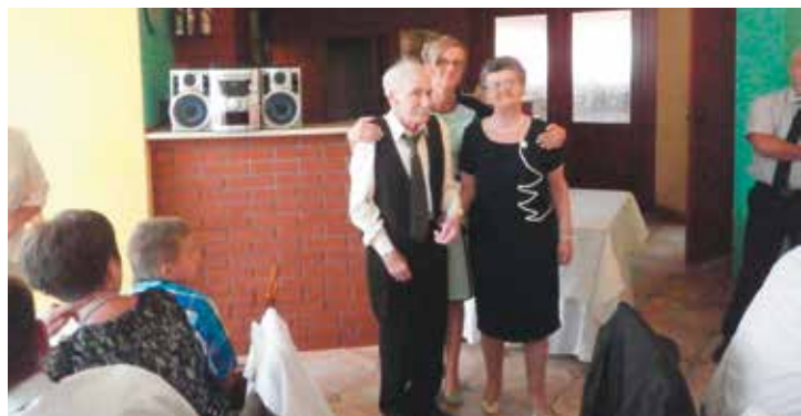
Państwo Kruszelniccy z córką