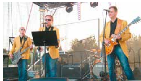
„The Shout” grał i śpiewał hity lat 60. i 70.

Po zawodach pożarniczych swoje umiejętności zaprezentowali młodzi ludzie trenujący w sekcji Karate Shotokan „Kaminari”, dzieci uczące się tańca w Glamdance Studio Ewelina Łachaj oraz młodzież, której pasją jest jazda na rolkach, deskorolce i bmxie, a miejscem, na którym spędzają sporo wolnego czasu i trenują swoje niemal