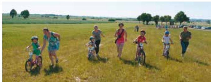
Rywalizacja przedszkolaków i ich mam w V Bralińskim Crossie Rowerowym

Dni Gminy Bralin już za nami. Tegoroczne święto gminy obchodziliśmy nieco wcześniej niż zwykle, nie na koniec czerwca, a na początku miesiąca, proponując tym samym ofertę sportowo-rekreacyjno-rozrywkową na długi weekend.