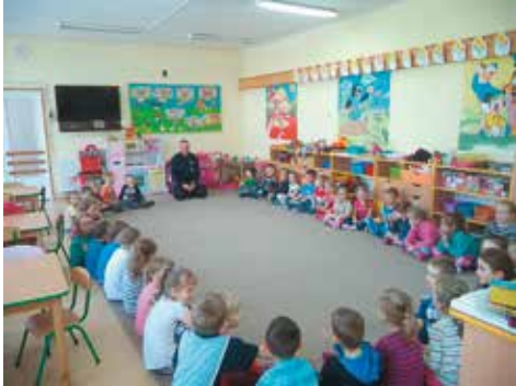
Spotkanie z policjantem w Przedszkolu „Kwiaty Polskie”

Do naszej redakcji wraz z tekstami napływają także zdjęcia. Niestety, nie wszystkie ze względu na ograniczone miejsce w gazecie możemy zamieścić. Dziś część z nich publikujemy.