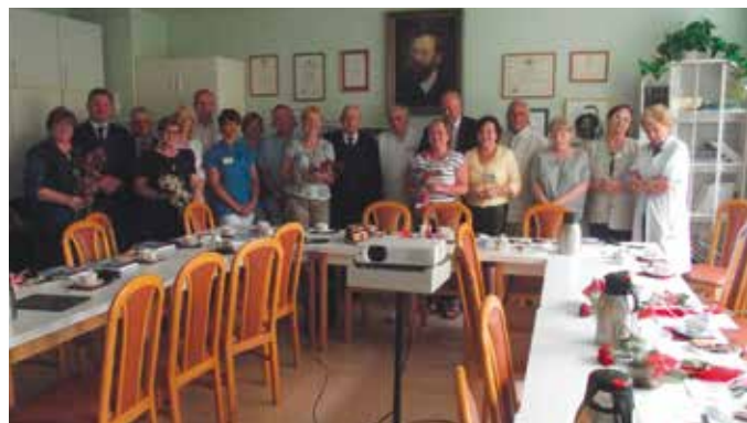
Bralińska delegacja w Ośrodku Badawczo-Rozwojowym we Wrocławiu