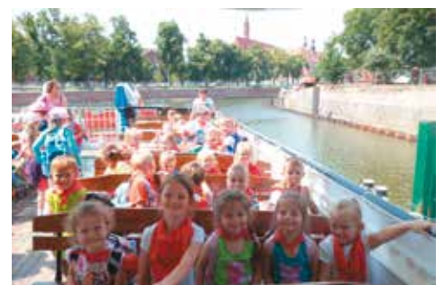
Przedszkolaki z Nowej Wsi Książęcej we Wrocławiu