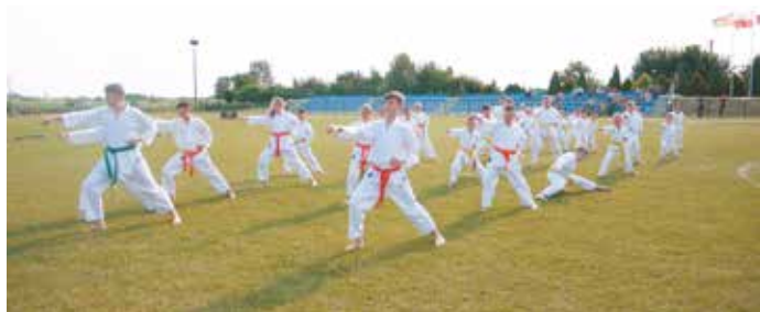
Sekcja karate wspaniale zaprezentowała się na bralińskiej murawie