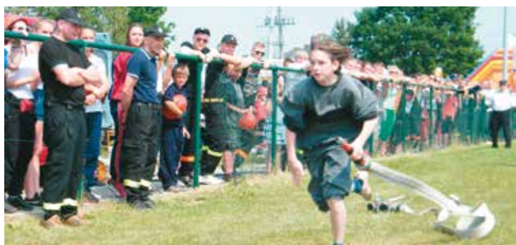
Zawody sportowo-pożarnicze to widowiskowe wydarzenie przyciągające sporą publiczność