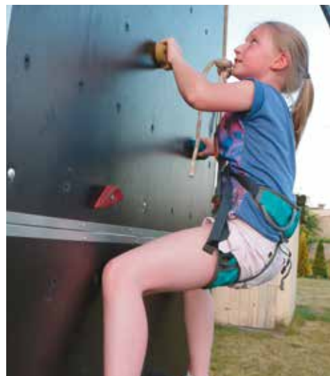
Kto wie, czy ta dziewczyna nie odkryła właśnie swego nowego hobby