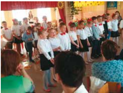
Klasy Id, Ic i Ib ze Szkoły Podstawowej w Bralinie zaprosiły na występy artystyczne swoich rodziców z okazji Dnia Matki i Dnia Ojca