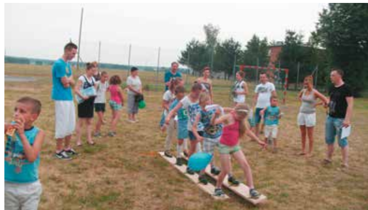
To było bardzo udane popołudnie

Rada Sołecka wraz z sołtysem przygotowali plenerowe spotkanie dla wszystkich