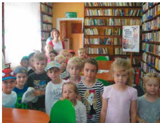
Tyle książek w jednym miejscu zrobiło wrażenie na przedszkolakach