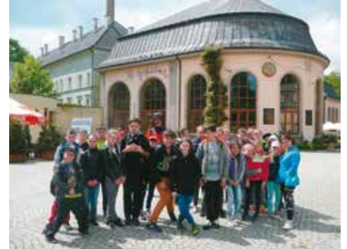
Uczniowie z Nowej Wsi Książęcej w Kudowie Zdroju