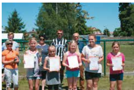
Dzień Sportu w SP Bralin