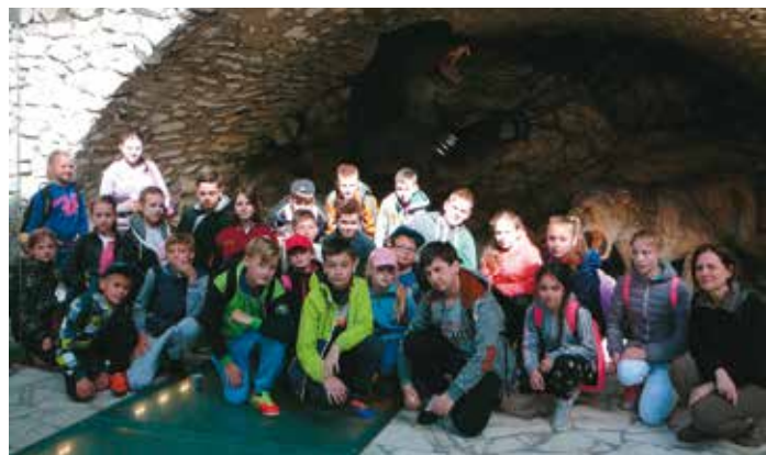
Nic tak nie integruje jak szkolne wycieczki

Podczas pobytu dzieci miały okazję m.in. zwiedzić kopalnię złota w Złotym Stoku, twierdzę i podziemną trasę turystyczną w Kłodzku, skansen dawnych sprzętów i mini ZOO w Wambierzycach, Kaplicę Czaszek w Cermnej oraz muzeum zabawek i park zdrojowy wraz z pijałnią wody w Kudowie Zdroju. Uczniowie podziwiali również piękne widoki, a także formy krasu powierzchniowego podczas wędrowki na najwyż-