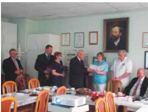
Laureaci Konkursu „Listy dla Ziemi - etap gminny - 2015”