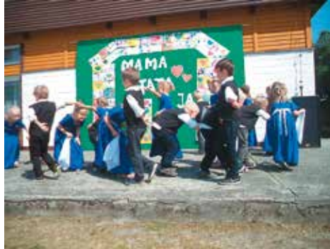
Występy artystyczne przedszkolaków podczas festynu rodzinnego