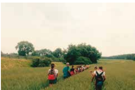
Podczas Rajdu Pieszego „Dwa dni, dwa wzgórza, dwie wędrówki”