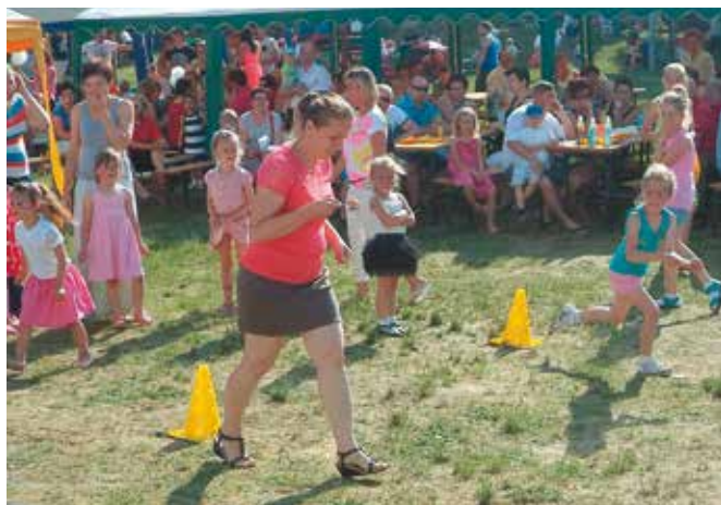
W trakcie festynu rodzinnego rodzina bawi się razem

W promieniach słońca, 14 czerwca odbył się na placu zabaw festyn rodzinny. Impreza przebiegała pod hasłem „Rodzina bawi się razem”, a jej organizatorami byli: Rada Rodziców oraz pracownicy Przedszkola „Kwiaty Polskie” w Bralinie. Festyn rozpoczął się popisami wokaltanecznymi dzieci z poszczególnych grup. Po części artystycznej na najmłodszych czekało wiele atrakcji: dmuchany zamek, basen z piłkami, przejazd strażackim sa-