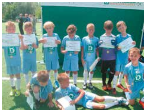
Mali piłkarze z Bralina grali w wielkim Wrocławiu