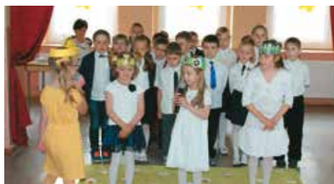
Uczniowie Ia występowali dla swoich rodziców