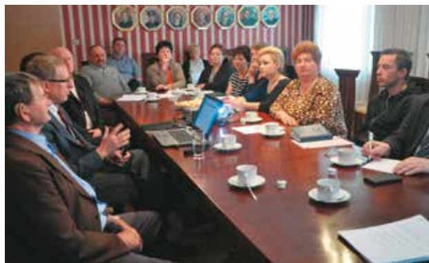
Podczas szkolenia informacyjnego dla sołtysów

Wykonawcą wspomnianego planu jest firma: Pomorska Grupa Konsultingowa Spółka Akcyjna z siedzibą przy ul. Gdańskiej 76; 85-021 Bydgoszcz. Przedstawiciel tej spółki spotkał się 28 kwietnia br. z sołtysami poszczególnych sołectw zlokalizowanych na terenie naszej gminy. W szkoleniu informacyjnym wzięli również udział przedstawiciele Urzędu Gminy Bralin, między innymi zastępca wójta gminy Bralin