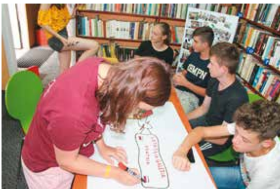
Młodzież w trakcie zajęć