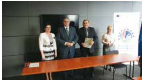
Podpisanie umowy na dofinansowanie domu ludowego

Inwestycja rozpoczęła się w roku 2017, Gmina Bralin na budowę domu ludowego pozyskała dofinansowanie w wysokości