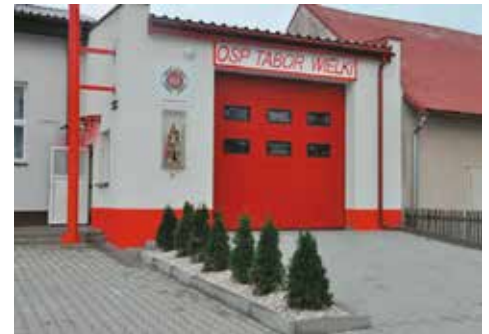
Remiza strażacka w Taborze Wielkim

- w IV etapie w 2016 r. zrealizowano roboty wykończeniowe. Koszt tych prac to 87 000 zł. Całkowite środki finansowe, jakie przeznaczyła Gmina Bralin na inwestycję w Taborze Wielkim, wynoszą 301 107,26 zł.