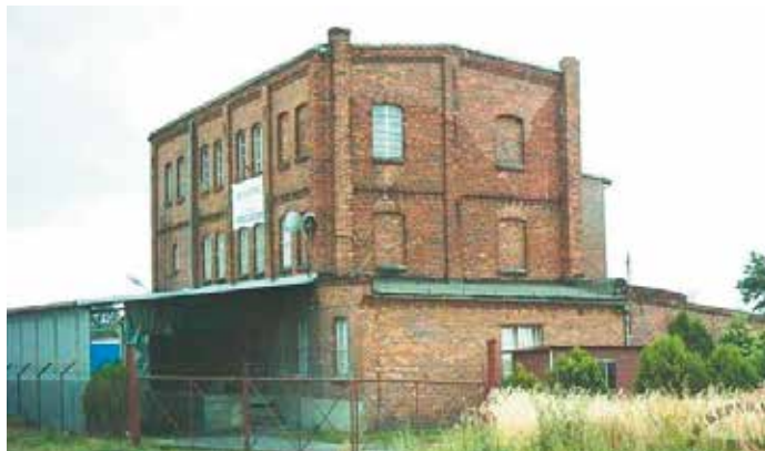
Dawny młyn Huppów w Nowej Wsi Książęcej. Stan z roku 2008.

W „Amts-Blatt der Königlichen Regierung zu Breslau” nr 24 z 1823 r. („Dzienniku Urzędowym Królewskiej Rejencji we Wrocławiu”) na stronach 186-187 czytamy: Dobra Trębaczów, Nowawieś Książęca i Zbyszyna powiatu sycowskiego i tamtejsze gminy wiejskie, wspólnym wysiłkiem ponosząc koszty w wysokości 285 Reichstalarów, nabyły jeżdżąc-