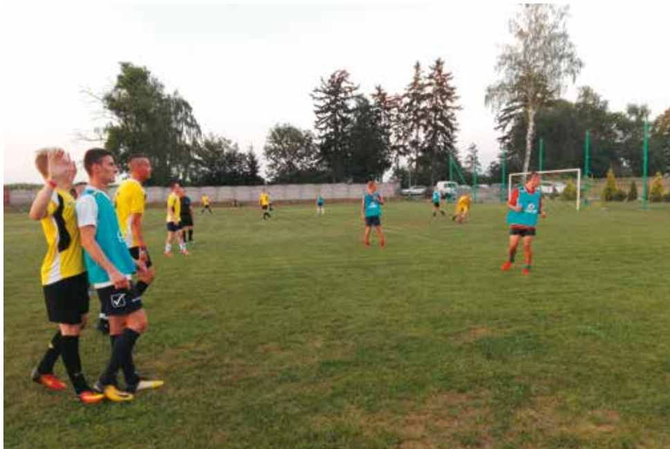
W trakcie przygotowań - mecz sparingowy

W niedzielę, 19 sierpnia drużyna seniorów rozegrała spotkanie z KS Rogaszyce. Meczem tym Ludowy Klub Sportowy „Sokół” Bralin zaczęła nowy piłkarski sezon 2018/2019.