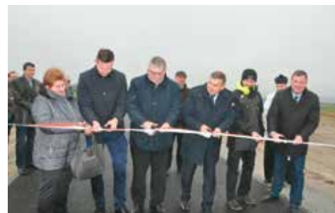
Oficjalne oddanie nowej drogi do użytku

Nastąpiła również przebudowa drogi gminnej Tabor Wielki - Tabor Wielki Chałupki. Długość przebudowanego odcinka wynosi 657 metrów. Droga została poszerzona do 4 metrów. Tu także wykonano nową konstrukcję nawierzchni i przebudowę istniejących już zjazdów. Umocniono pobocza i uregulowano istniejące skrzynki wodociągowe.