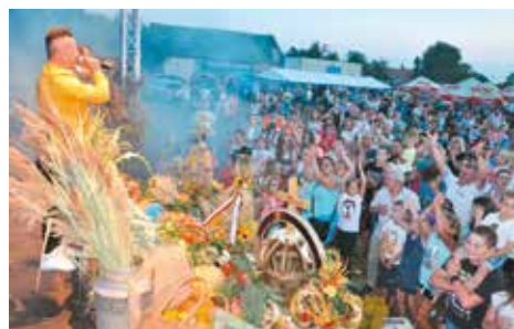
Koncert zespołu Milano