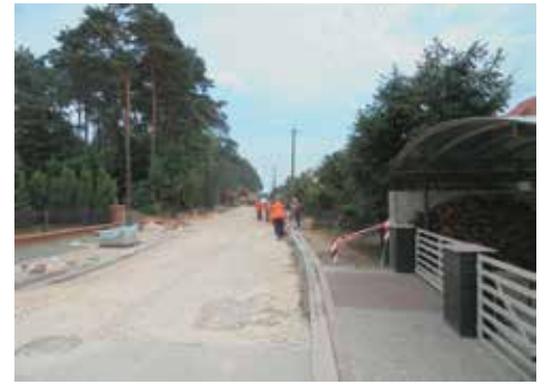
Prace na ul. Rzemieślniczej

kanalizacji deszczowej, następnie na podbudowie kamiennej wykonawca położył asfaltobeton. Przy ulicy Rzemieślniczej założono chodniki, krawężniki, oznakowanie pionowe i poziome. Cena za wykonanie przedmiotu zamówienia, zgodnie ze złożoną ofertą, wyniosła 298.857,13 zł. Konstrukcja drogi została zaprojektowana w sposób dostosowany do warunków gruntowych oraz obciążenia ciężkimi pojazdami. Szczególnie na łączniku do drogi wojewódzkiej, gdzie manewrują pojazdy ciężarowe korzystające z usług serwisu ogumienia.