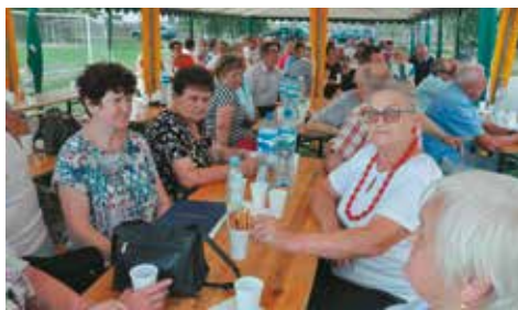
Frekwencja na pikniku dopisała