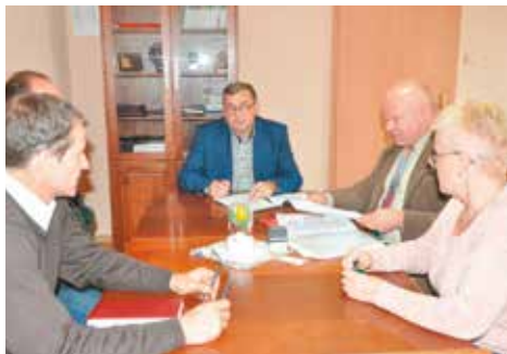
Podczas podpisania umowy

W ramach tej inwestycji wykonane zostały roboty budowlane na drodze powiatowej i gminnej wraz z korektą geometrii i parametrów łuków poziomych i pionowych. Przebudowane zostały zjazdy z dróg i skrzyżowania, położono nawierzchnię mineralno-bitumiczną na podbudowie kamiennej, oraz został wykonany chodnik z kostki betonowej. Ponadto wykonano: wycinkę oraz zabezpieczenie istniejących drzew lub krzewów, odwodnienia i oznakowanie drogi. W ramach robót uwzględniono przebudowę mostku, odmulenie, oczyszczenie i częściowe umocnienie rowu melioracyjnego. Zgodnie z umową inwestycja została zrealizowana do 10 listopada 2016 roku, a jej koszt całkowity to kwota