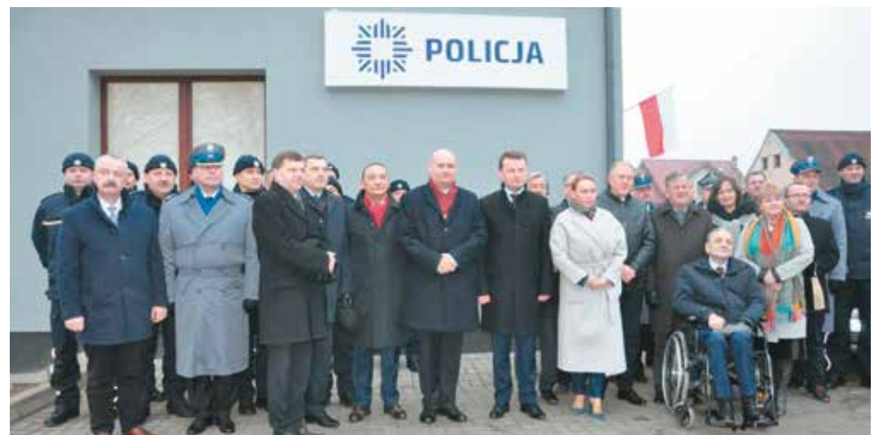
Uroczyste otwarcie posterunku