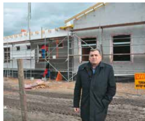
Wójt przed budynkiem przedszkola

dużą dotacją pochodzącą z rządowego programu „Maluch+”, przygotowanego przez Ministerstwo Rodziny, Pracy i Polityki Społecznej, którego pośrednikiem jest Wielkopolski Urząd Wojewódzki w Poznaniu. Dofinansowanie dotyczyło żłobka, który będzie funkcjonował przy przedszkolu. Kwota dofinansowania wynosi 979 200,00 zł.