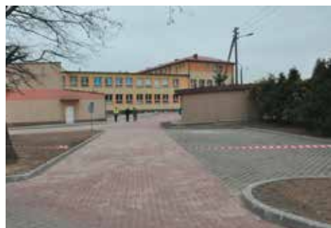
Parking przy szkole

cję inwestycji pn. „Przebudowa utwardzenia powierzchni gruntu przed budynkiem