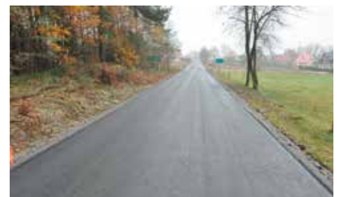
Droga w Weronikopolu

dofinansowanie budowy/przebudowy dróg dojazdowych do gruntów rolnych) w kwocie 123 tys. zł, a także dotację z Powiatu Kępińskiego w łącznej wysokości 306.608,00 zł. Po zostały środki pochodziły z budżetu Gminy.