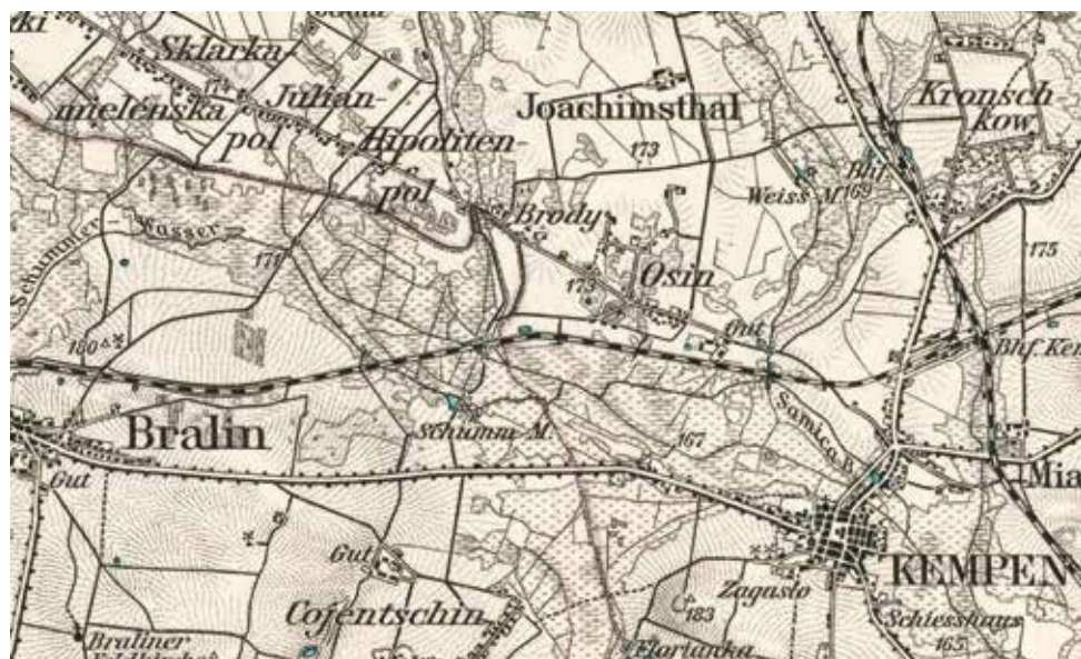
Fragment mapy z ok. 1892 r., opracowanej przez pruski urząd kartograficzny jako Karte des Deutschen Reiches w skali 1:100 000 (arkusz Kempen o godle 401). Zaznaczono na niej przysiółek Brody.