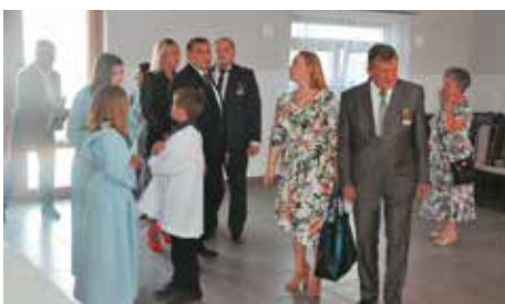
W trakcie otwarcia domu ludowego