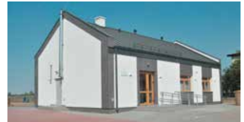
Dom Ludowy w Nosalach

206 838,00 zł, co stanowi 63,63% poniesionych kosztów kwalifikowanych operacji. Budowa Domu Ludowego w Nosalach