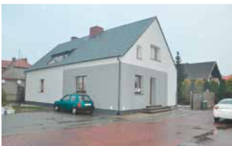
Budynek policji po remoncie

20 grudnia 2017 roku nastąpiło uroczyste otwarcie nowego posterunku policji.