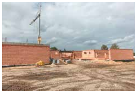
Przedszkole w trakcie budowy

Z kolei pod koniec października zeszłego roku Gmina Bralin pozyskała 999 999, 99 zł na prowadzoną inwestycję przy ul. Wiosennej, dofinansowanie pochodziło z Wielkopolskiego Regionalnego Programu Operacyjnego. Pozyskano również