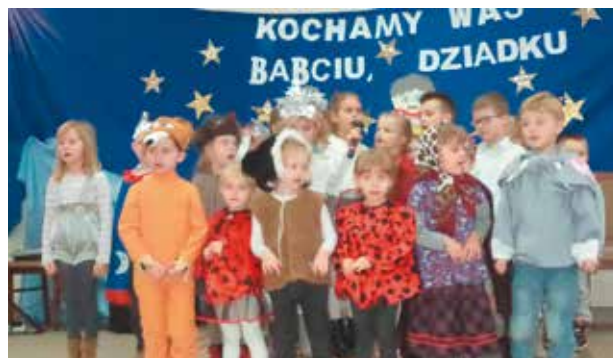
Na gościnnych występach w Mnichowicach