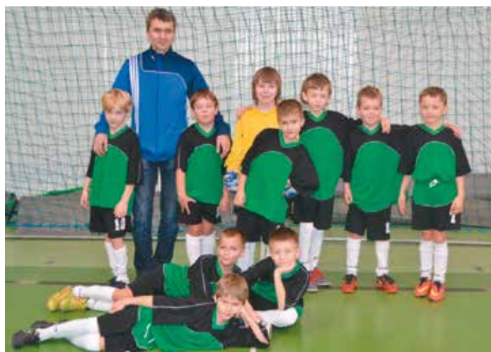
Drużyna z Bralina wraz z trenerem

11 stycznia 2015 br. w Ostrzeszowie odbył się turniej pn. Akademia CUP 2015. W turnieju wystąpiło 6 drużyn dzieci rocznika 2006 i młodszych takich klubów jak: WKS „ŚLĄSK” Wrocław, „KKS” Kalisz, „GÓRNIK” Konin oraz dwa silne zespoły „AKADEMII PIŁKARSKIEJ” z Ostrzeszowa. W tym doborowym składzie znalazł się nasz „maluczki” klub LKS „SOKÓŁ” z Bralina. Celem tegoż turnieju była nie tylko popularyzacja piłki nożnej i podnoszenie umiejętności gry w tej dyscyplinie,