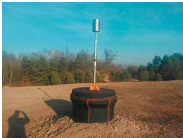
Studzienka ujęcia biogazu po składowisku