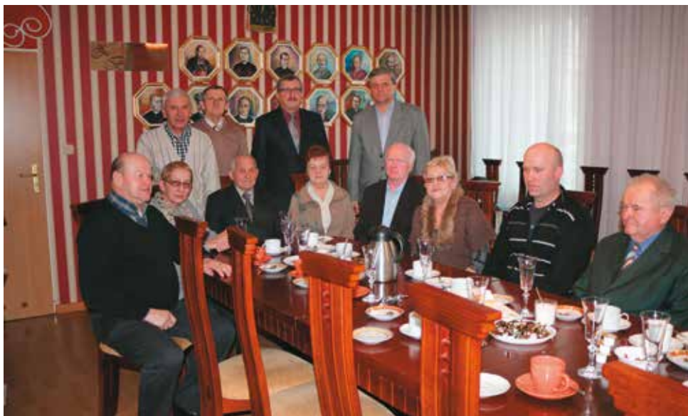
Goście i członkowie Związku NSZZ RI „Solidarność”

Zebrani dyskutowali o nie najlepszej kondycji polskiego rolnictwa i trudnej sytuacji ekonomicznej producentów rolnych. Wśród rozmów przewijały się wątki dotyczące cen skupu żywca i mleka poniżej progu opłacalności, nagminnej sytuacji wykupu ziemi ornej przez przedsiębiorców, stawek za 1 ha nie będących w zasięgu możliwości finansowych rolnika, a także braku