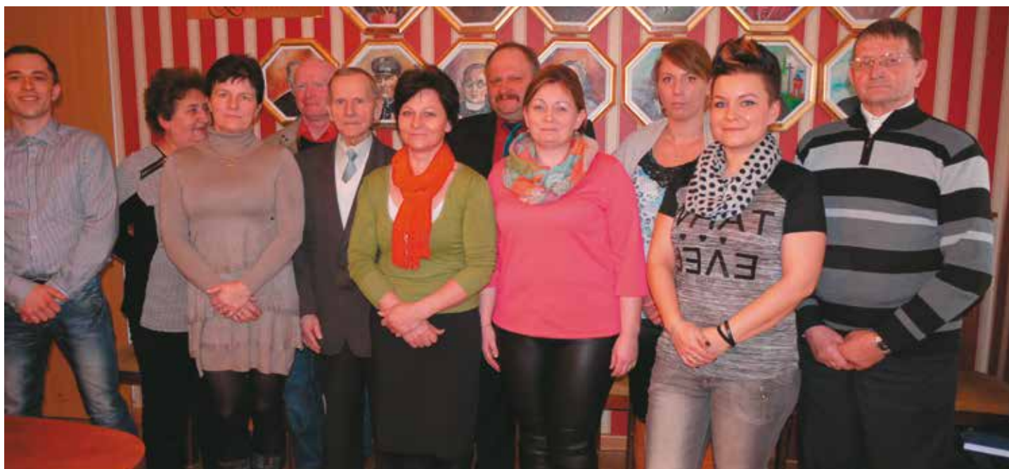
Na zdjęciu brakuje jednego z sołtysów. Czy państwo zauważyli, kogo nie ma?