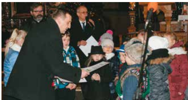
Sympatyczny moment wręczenia nagród