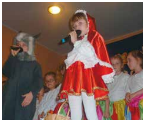
Na pierwszym planie Czerwony Kapturek i Wilk

Przedszkole we współpracy z Radą Rodziców umożliwia dzieciom kontakt ze sztuką teatralną i filmową. 14 stycznia gru-