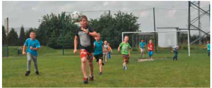
Gry i zabawy z okazji Dnia Dziecka w SP Bralin