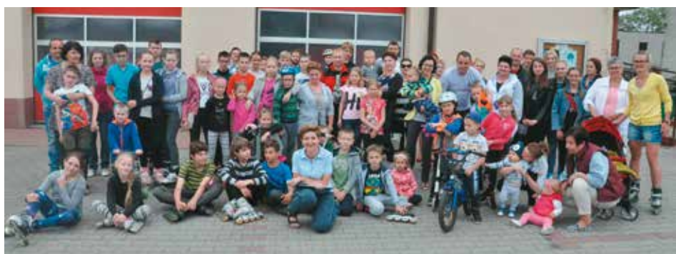
Uczestnicy „Rolkowego zawrotu głowy”

W taki oto sposób w ciągu 7 dni na terenie gminy Bralin odbyły się 23 sportowe wydarzenia przygotowane przez 23 wolontariuszy. W realizację tego przedsięwzięcia włączyło się 1360 osób. A jak to się stało? Najpierw był impuls – informacja o ósmej edycji Europejskiego Tygodnia Sportu dla Wszystkich – imprezie konkursowej dla miast i gmin. Jej głównym celem jest promowanie aktywności ruchowej jako najlepszej formy spędzania wolnego czasu i zdrowego stylu życia oraz integracji rodzinnej. Cel istotny i bliski organizatorom. Potem burza mózgow, zbieranie pomysłów na różne wydarzenia sportowe, rekreacyjne, turystyczne i rozmowy z potencjalnymi partnerami przedsięwzięcia. Pomysły się rodzą, jest ich coraz więcej, kalendarz wydarzeń wygląda coraz bardziej imponująco. Sportową inicjatywę wraz z Gminą Bralin podejmują wszystkie nasze szkoły i przedszkola, włącza się Koło Wędkarskie „Oczko”, UKS Sport Bralin, szkolni piłkarskie ze Świątlicy „Tęcza”, Stowarzyszenie Przyjaciół Ziemi Bralińskiej, Stowarzyszenie ARTwariów, OSP Bralin i sołtysi. I pojawia się problem, jak poukładać wszystkie wydarzenia w określonym, nieprzekraczalnym terminie od 26 maja do 1 czerwca 2016 r., bo właśnie w tym czasie będzie trwał Europejski Tydzień Sportu dla Wszystkich. A tu jeszcze kilka uroczystości: Boże Ciało, Dzień Matki i Dzień Dziecka. Nie da