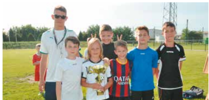
Turniej dzikich drużyn w piłkę nożną, SP Bralin