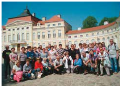
Przed pałacem w Rogalinie

Zarządy kół terenowych również nie próżnują. Pamiętają o zorganizowaniu spo-