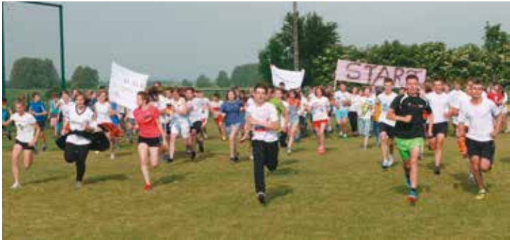
Święto Sportu Szkolnego w gimnazjum