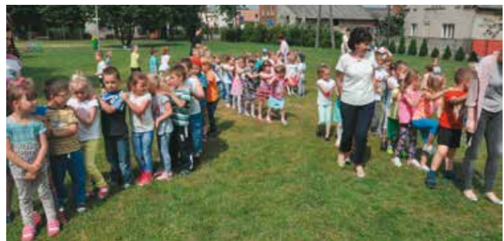
Dzień Dziecka w Przedszkolu „Kwiaty Polskie”