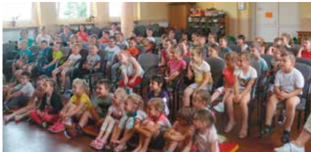
Przedszkolaki oglądały z zapartym tchem