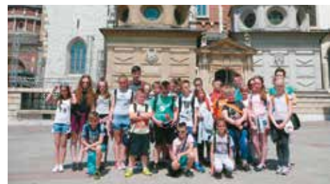
Uczniowie w Krakowie

Kraków to cel naszej tegorocznej wycieczki, na którą wyjazd planowany był w szkole od września. Udało się! Grupa 24 uczniów i 2 opiekunów przebywała od 23 do 25 maja na trzydniowej wycieczce w Krakowie i okolicach. Pierwszego dnia udaliśmy się do parku rozrywki Energylandia w Zatorze. W kompleksie usytuowanym na obszarze 26 ha oddawaliśmy się karuzelowym szaleństwom przede wszyst-