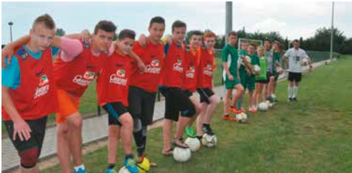
Przykładowy trening piłkarski, szkółka piłkarska „Tęcza”