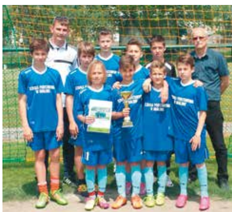
Reprezentacja SP Bralin z trenerem i dyrektorem szkoły