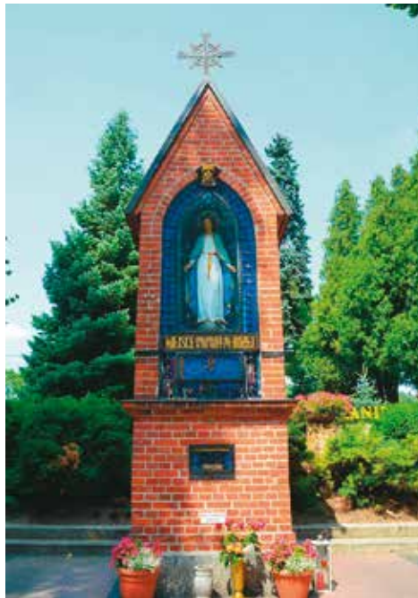
Kapliczka gietrzwałdzkiej Madonny Piastunki z Dzieciątkiem z 1877 r.