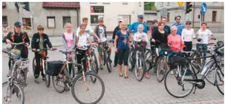
Wycieczka rowerowa, Stowarzyszenie Przyjaciół Ziemi Brańskiej