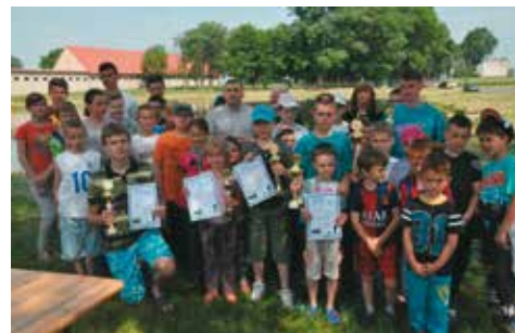
Młodzi uczestnicy zawodów wędkarskich