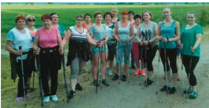
Marsz z kijkkami po zdrowie, SPZB