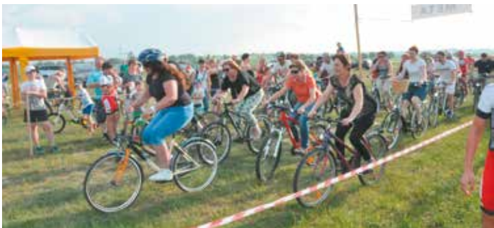
VI Brański Cross Rowerowy, SPZB