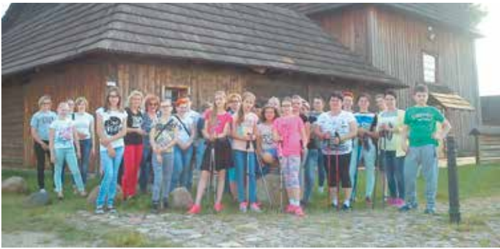
Marsz z kijkkami na Dzień Matki, klasa Vb SP Bralin