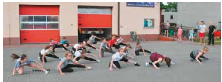
Taniec w wykonaniu młodzieży, ARTwariu