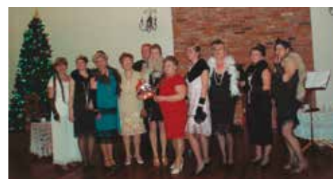
Artystki z TAK z przewodniczącą i wiceprzewodniczącą koła PZERiJ w Baranowie

W styczniu też Komisja Kultury i Wypoczynku opracowała szczegółowy plan wyjazdów na wczasy i wycieczki jednodniowe w 2016 roku. Zaplanowane zostały wyjazdy na wczasy w czerwcu do Pobierowa, Trójmiasta i do Łazów. Pobierowo i Łazy przewidziane są również w sierpniu, a we wrześniu będzie można pojechać do Piwnicznej Zdrój z możliwością wyjazdu na Węgry do źródeł termalnych za dodatkową opłatą. W planie znalazły się też wycieczki jednodniowe. I tak w kwietniu i lipcu można będzie skorzystać z ciepłych kąpielni w Unie-