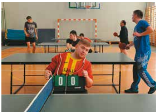
W trakcie rywalizacji w kategorii mężczyzn

I Turniej Sołectw w Tenisie Stołowym o Puchar Wójta Gminy Bralin w katego-