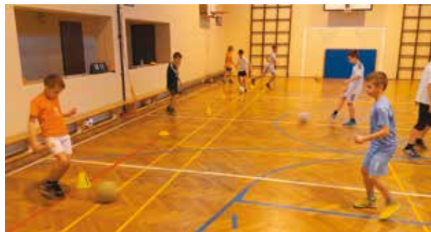
Powstała akademia piłkarska. Zachęcamy dzieci do uczestnictwa