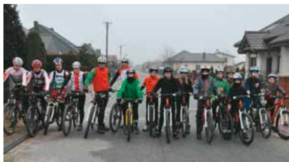
Szerokość ulicy robi się ciasna od kolarzy i to bardzo cieszy