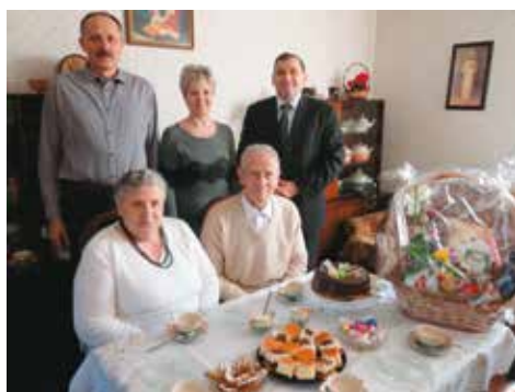
Na jubileuszu diamentowych godów