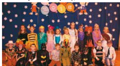
Podczas balu aż roiło się od barwnych postaci z bajek

Karnawał to czas przepelniony muzyką oraz zabawą. 13 stycznia 2016 roku uczniowie naszej szkoły mieli okazję uczestniczyć w balu karnawałowym zorganizowanym przez Radę Rodziców. Szkolne plasy zostały podzielone na dwie części. Najpierw w zabawie uczestniczyły dzieci z klas I-III, zamieniając salę gimnastyczną w kolorową krainę pełną barwnych postaci. Następnie na parkiet zostali zaproszeni uczniowie klas IV-VI. Podczas zabawy uczniowie nie tylko wyginali śmiało ciało, ale również brali udział w rozmaitych konkursach, które wywołały ducha rywalizacji, ponieważ zwycięzcy otrzymywali drobne nagrody. Nie zabrakło również słodkich przekąsek przygotowanych dla dzieci przez rodziców. Dziękujemy Radzie Rodziców za zorganizowanie wspaniałej imprezy, rodzicom zaangażowanym w przygotowanie poczęstunku oraz nauczycielom, którzy zajęli się dekoracją oraz czuwali nad bezpieczeństwem dzieci. Bal karnawałowy zawsze sprawia wiele radości dzieciom. Tak było również i w tym roku. Z uśmiechem na twarzy będziemy wspominać kolejny udany bal karnawałowy.