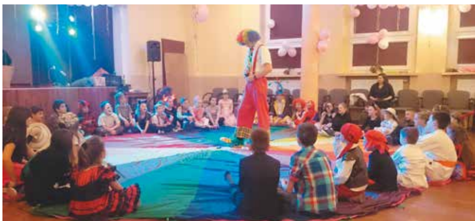
Wspólne zabawy jednoczą, a konkursy z nagrodami podgrzewają emocje

Podsumowaniem „Tęczowych ferii 2016” była zabawa karnawałowa. Bal odbył się 27 stycznia w świetlicy „Tęcza”. Zabawę poprowadził Tygrysek i jego dwóch przyjaciół. Na dzieci czekała zabawa pełna konkursów z nagrodami. Dzieci ochoczo