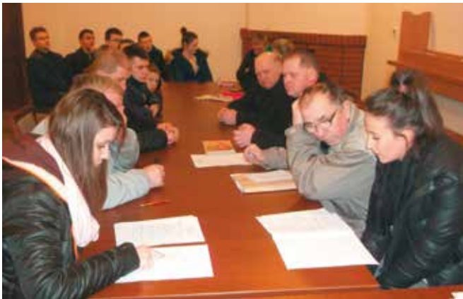
Podczas zebrania członków OSP w Czerminie