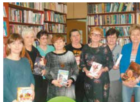
Wyróżnienia dla czytelników dorosłych