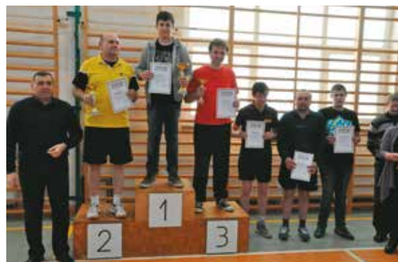
Miejsce na pudle i zasłużony Puchar Wójta Gminy Bralin