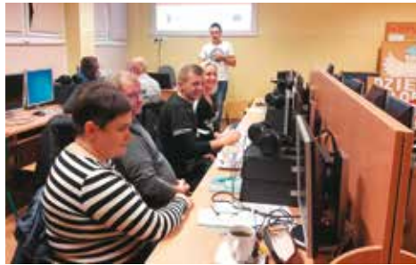
Zajęcia przy komputerze sprawiają coraz więcej zadowolenia

Uczestnicy zajęć spotykają się w małych kameralnych grupach, które umożliwiają w miarę potrzeb, na bieżąco wsparcie ze strony trenera lokalnego. Każdy pracuje przy swoim stanowisku komputerowym i ma możliwość wyboru tematu szkoleń. Czas spędzony na zajęciach szybko płynie, a miłą atmosferę budują ludzie i poczęstunek. Zajęcia odbywają się dwa razy w tygodniu w godz. 18.00-20.00.