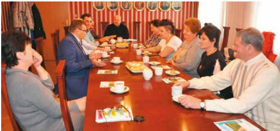
Podczas spotkania sołtysów z wójtem