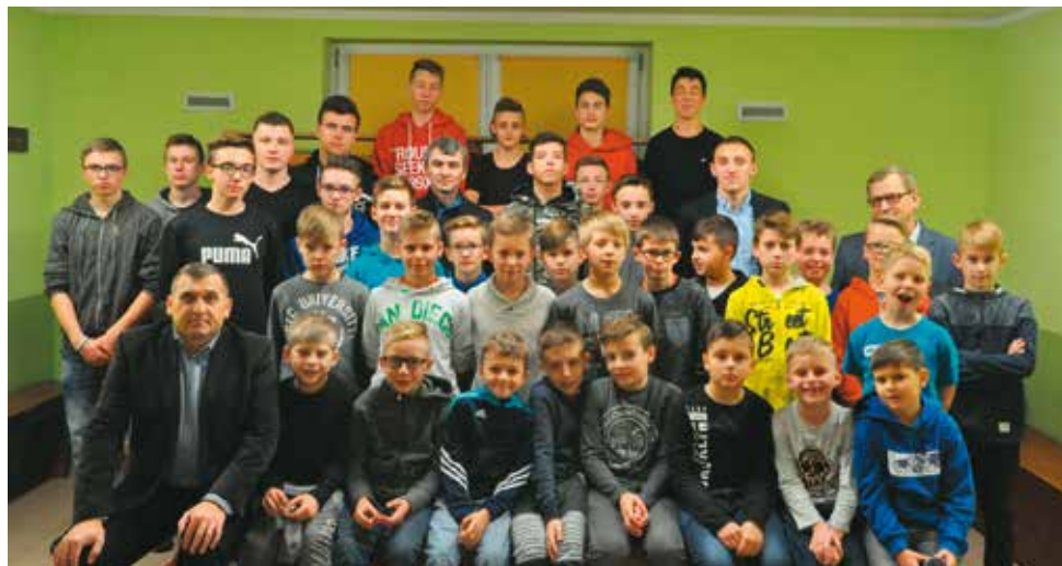
Piłkarska młodzież Sokoła Bralin