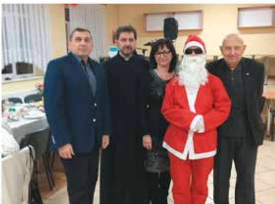
Do Mielęcino przyjechał Mikołaj w... okularach

Prężnie działający Polski Związek Emerytów, Rencistów i Inwalidów rozpoczął organizowanie cyklu spotkań opłatkowych dla swoich członków na terenie gminy Bralin. Pierwsze z nich odbyło się wczoraj