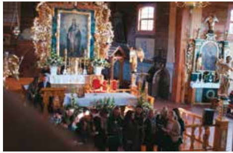
Sanktuarium Maryjne na Pólku pod Bralinem – ołtarz główny