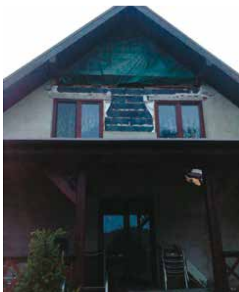
„Ksawery” niszczył z zewnątrz...

Orkan „Ksawery”, który przeszedł nad Polską, niestety nie ominął gminy Bralin. Aż w 16 gospodarstwach odnotowane zostały straty. Są to zarówno zniszczenia budynków domowych, jak i gospodarczych. Najbardziej ucierpiały pokrycia dachowe. Dotąd wpłynęło 7 wniosków o pomoc materialną za poniesione szkody. W jednym z tych przypadków niezbędna będzie opinia nadzoru budowlanego. Gminny Ośrodek Pomocy Społecznej przeprowadził wywiady środowiskowe z poszkodowanymi, zbadał sytuację materialną i ocenił, jakie będą niezbędne środki pomocowe. Aby otrzymać wsparcie finansowe z Ministerstwa Spraw Wewnętrznych i Administracji na pokrycie strat, konieczne jest spełnienie określonych kryteriów. Występują tu większe obwarowania aniżeli było to wcześniej, kiedy pomoc była udzielana ze środków własnych Gminy.