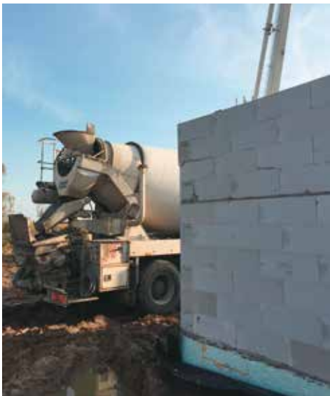
Dojechał świeży transport z betonem

Harmonogram prac przewiduje, że do końca tego roku ma stanąć budynek w stanie surowym, natomiast od początku