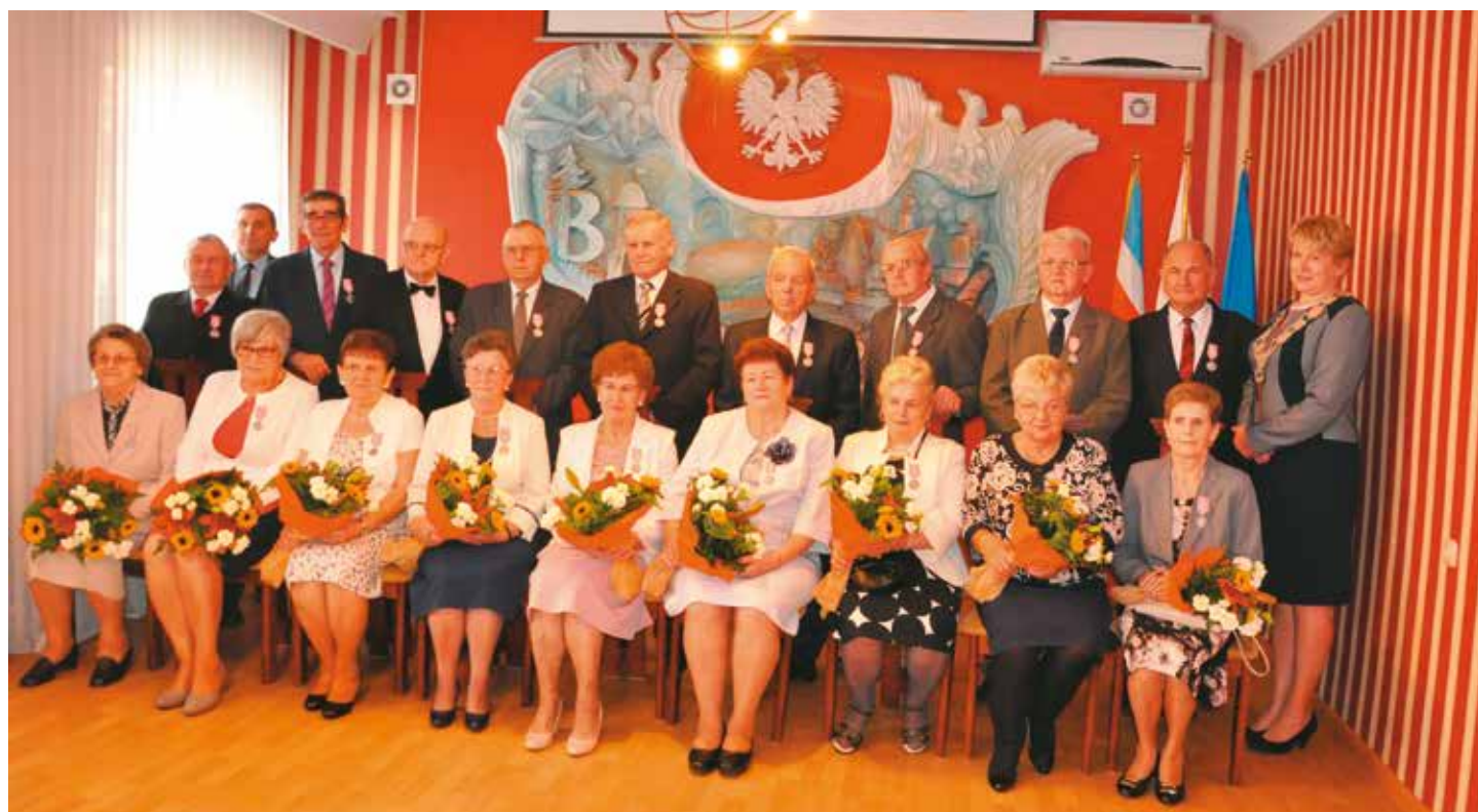
Złote pary podczas uroczystości