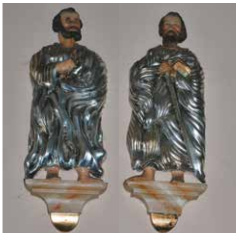
Święci apostołowie – Piotr (z kluczami) i Paweł (z mieczem) dziś spoglądają na wiernych w kościele katolickim

W worku foliowym po nawozie miała stałą płaskorzeźbę. Zamierzała ją sprzedać. Mówiła, że jest z Zosina i że znalazła ją na strychu swego domu. – Byłem wtedy przekonany, że to świętek z jakiejś, być może nieistniejącej już, kapliczki – tłumaczy dziś pan Henryk. Stan rzeźby wskazywał na to, że stała gdzieś na zewnątrz. Była z drewna dębowego. Kupiłem tę rzecz i pozostawiłem w warsztacie do odnowienia.