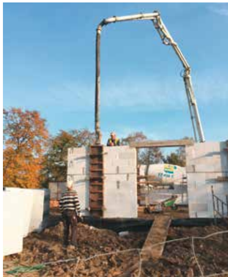
Kształtuje się zarys budynku

2018 r. rozpoczną się prace wykończeniowe. Oddanie do użytku Domu Ludowego w Nosalach zaplanowano na 29 czerwca 2018 r.