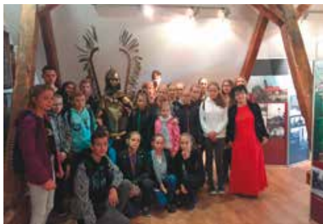
Podróż kształcą i to nie jest banal

Tego samego dnia w szkole pamiętano o VII Światowym Dniu Tabliczki Mnożenia, która miała na celu zachęcić do przypomnienia sobie tej podstawowej wiedzy z matematyki. Od rana „komisje egzaminacyjne” składające się z przedstawicieli klas piątych i szóstych sprawdzały umiejętność mnożenia wśród uczniów i nauczycieli. Następnie patrole egzaminacyjne pod opieką pedagogów wyszły na ulice Bralina, aby sprawdzić, jak dorośli radzą sobie z liczeniem. Uczniowie przepytывali pracowników w instytucjach państwowych, sklepach, zakładach pracy, a także przechodniów. Każdy, kto poprawnie odpowie-