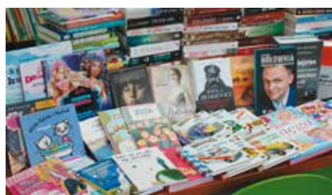
Powiększa się biblioteczny księgozbiór

Dofinansowanie na zakup nowości wydawniczych w 2017 roku dla bralińskiej biblioteki ze środków finansowych Ministra Kultury i Dziedzictwa Narodowego pochodzących z budżetu państwa wynosi 5 489,00 zł. Pierwsza partia zakupionych książek jest obecnie opracowywana w programie bibliotecznym SOWA, po czym na bieżąco będzie udostępniana do wypożyczeń czytelnikom. Założeniem Priorytetu realizowanego w ramach Programu Wieloletniego „Narodowy Program Rozwoju Czytelnictwa w latach 2016-2020” jest