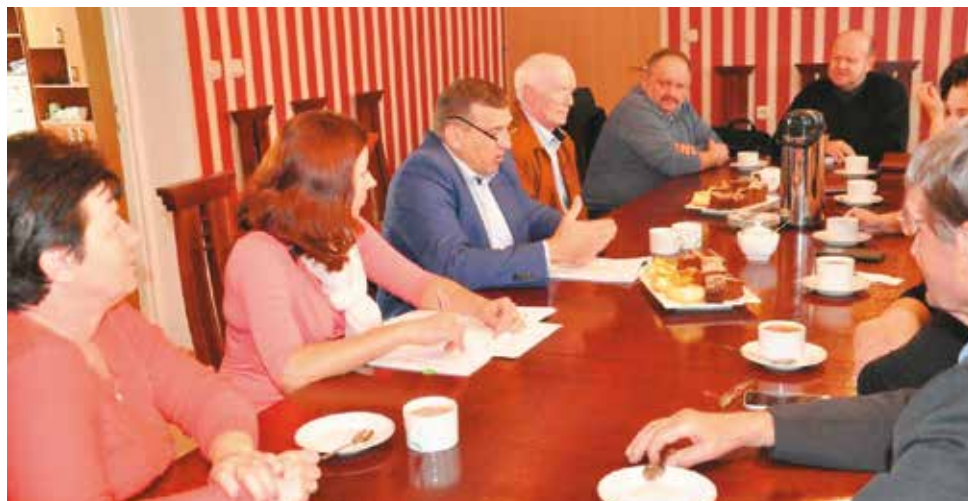
Debatowali o najbliższych planach w sołectwach

Obiekt gminny w Chojećcinie-Parcelach został sprzedany