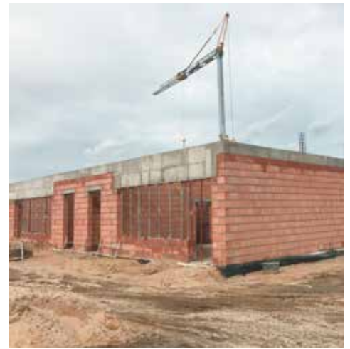
Mury pną się do góry...