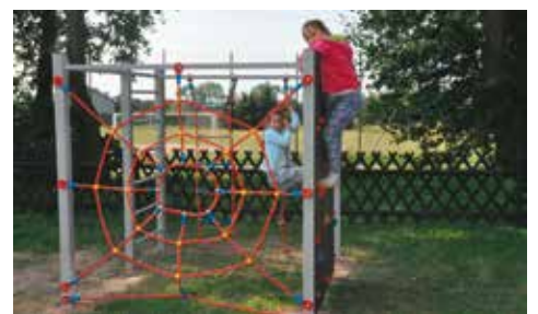
Dzieci już się cieszą

Z myślą o najmłodszych mieszkańcach na terenie gminy Bralin doposażone zostały place zabaw. I tak w miejscowości Chojećin Parcele przybyła karuzela, sprężynowiec oraz dwie ławki. W Chojećcinie karuzela i sprężynowiec. W Nowej Wsi Ks. Parcele i w Nowej Wsi Ks. zainstalowano po dwa nowe sprężynowce. Z kolei w Czermynie oprócz sprężynowca pojawiła się równoważnia – huśtawka i karuzela. Na pięciu placach pojawiły się zestawy, na które składają się co najmniej dwie wieże, w tym co najmniej jeden dach dwu lub czterospadowy. Dotyczy to miejscowości Mnichowice, Mielęcín, Gola, Tabor Wielki