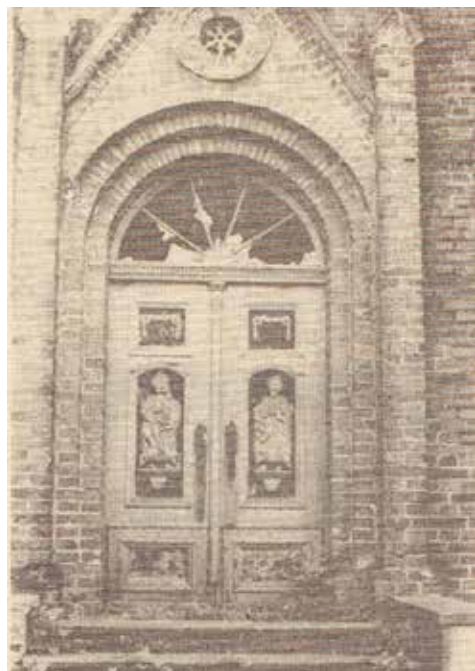
Skan fotografii zamieszczonej w miesięczniku „Południowa Wielkopolska”, nr 7 z 1984 r. Na drzwiach do kościoła ewangelickiego widać płaskorzeźby