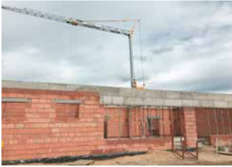
Przedszkole w budowie

Miło patrzeć, jak postępują prace przy budowie nowego przedszkola. Zakończono