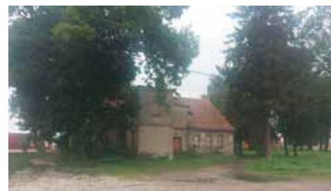
Gmina sprzedała „dworek”

Gmina Bralin sprzedała budynek mieszkalny w Chojećcinie - Parcelach. Obiekt pochodzi z 1920 r., a jego powierzchnia użytkowa wynosi 390 m 2 , zaś powierzchnia piwnic - 90 m 2 . Parterowy budynek był częściowo podpiwniczony, a poddasze - użytkowe. Posiada przyłącze energetyczne, wodociągowe i do szamba. „Dworek” w większości stanowił pustostan. Znajdujące się na parterze dwa mieszkania łącznie zajmowały powierzchnię 101 m 2 . Cena wywoławcza wynosiła 320 000 zł. W wyniku przetargu nowy właściciel nabył nieruchomości za kwotę 600 000 zł.