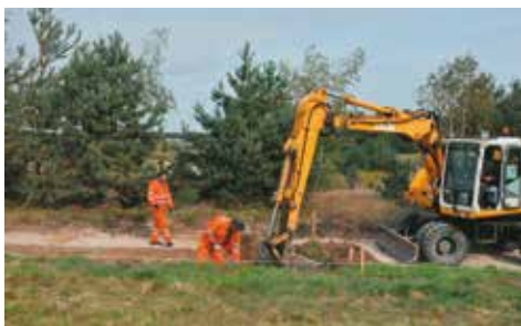
Przygotowanie drogi pod asfaltowy dywan

Kończy się przebudowa drogi w Goli na odcinku 170 metrów. Jest to włączenie do drogi wojewódzkiej. W jej ramach została wykonana korekta geometrii i parametrów łuków zarówno poziomych jak i pionowych. Jest też nowa konstrukcja nawierzchni. Przebudowie uległy istniejące zjazdy oraz