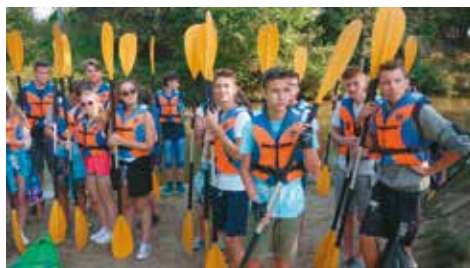
Splyw Małą Panwią znają już gimnazjaliści z III a

Splyw kajakowy Małą Panwią w okolicach miejscowości Kolonowskie,