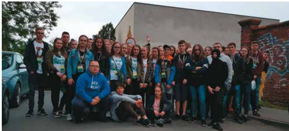
Młodzież z bralińskiej parafii na III Tratwie