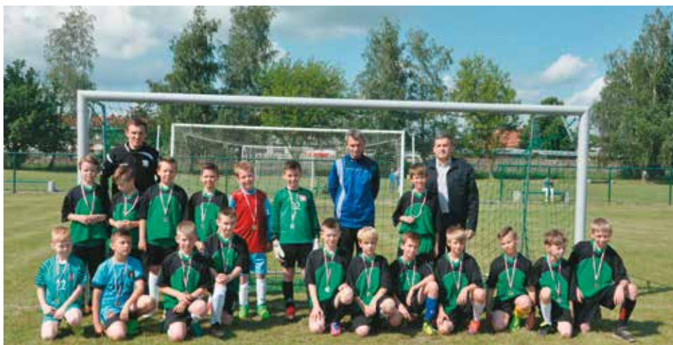
Zawodnicy z najmłodszych drużyn: żak i orlik