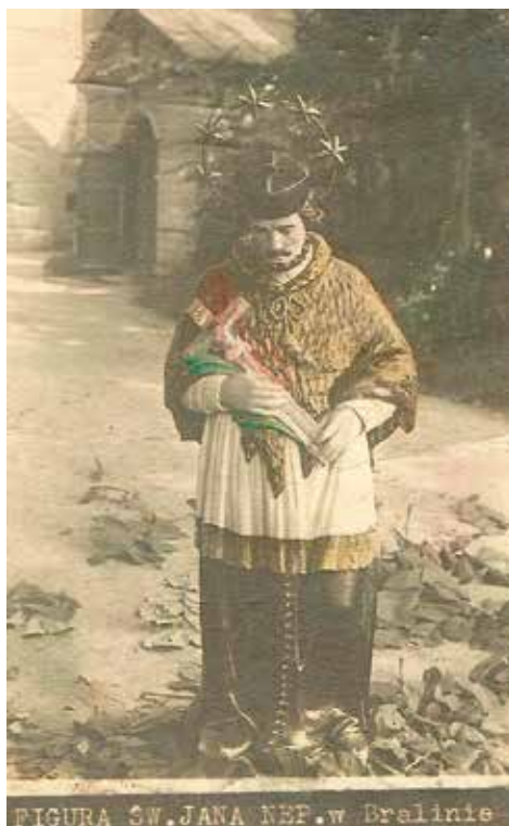
Św. Jan Nepomucen wraca ze „spaceru”... W tle kościół parafialny w Bralinie