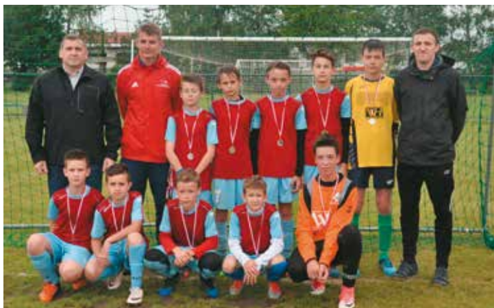
Drużyna młodzików starszych