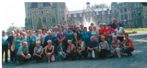
Przed zamkiem w Mosznej

Tegoroczne wyjazdy miały na celu bliższe poznanie terenów Śląska Opolskiego, dlatego też pierwszym celem było sanktuarium na Górze św. Anny. Tam seniorzy zwiedzili m.in. zespół klasztorny Franciszkanów z ciekawym Placem Rajskim, niesamowitą kalwarię z 40 kapliczkami usianymi wśród zieleni i grotę zbudowaną na wzór Groty z Lourdes. Dużym przeżyciem było zwiedzanie Parku Miniatur Sakralnych w Olszowie pod kierunkiem przewodniczki, która bardzo ciekawie opowiadała o najładniejszych