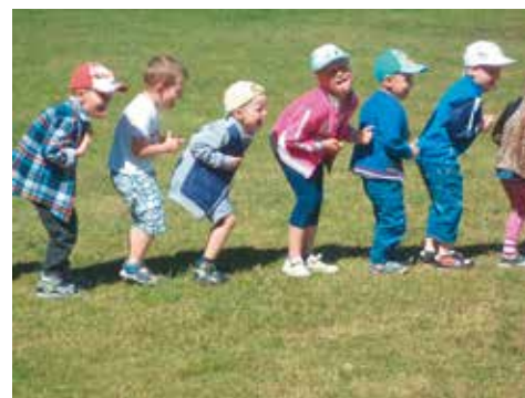
Wąską ścieżką, przez ogródek idzie sobie krasnoludek

W niedzielne popołudnie, 28 maja na terenie przedszkola odbył się festyn rodzinny, który miał na celu uświetnienie obchodów bardzo ważnych dla rodziny świąt: Dnia Matki, Dnia Ojca i Dnia Dziecka. Festyn rodzinny to miłe przedsięwzięcia integrujące społeczność Bralina, a także promujące aktywny sposób spędzania wolnego czasu. Tegoroczna impreza była bardzo udana. Sprzyjała jej słoneczna aura i miła atmosfera, którą stworzyli licznie przybyli rodzice z dziećmi i goście. Do jej organizacji przyczyniła się Rada Rodziców, pracownicy przedszkola oraz sponsorzy. Interesującym wydarzeniem artystycznym festynu były popisy dzieci: piosenki i tańce dla mamy oraz taty w wykonaniu poszcze-