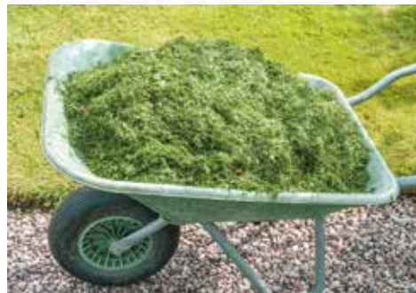
Odpady zielone nie mogą trafiać do kubła

Jeżeli sytuacja takie będą miały nadal miejsce i będą się regularnie powtarzać, organ zobowiązany będzie do wszczęcia z urzędu postępowania w sprawie określenia wysokości opłaty za gospodarowanie odpadami komunalnymi gromadzonymi w sposób nieselektywny i wydania decyzji, w której określona zostanie opłata w wysokości 15 zł za osobę za każdy miesiąc, w których odpady nie były segregowane. Właściciel nieruchomości będzie wówczas