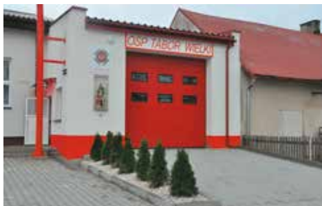
Remiza w Taborze Wielkim czeka na auto