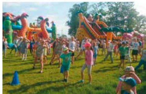
Tanecznie rozpoczęli Dzień Dziecka

29 maja świętowano Dzień Dziecka. Zabawę rozpoczął wspólny taniec z animatorami, którzy przez cały dzień prowadzili konkurencje. Wszystkie dzieci bardzo chętnie brały udział w zabawach, w których