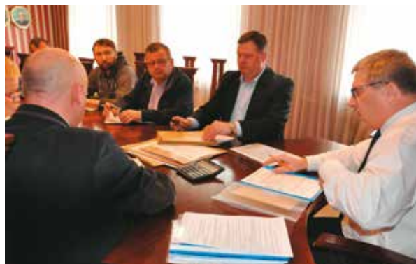
Podczas otwarcia przetargu w dn. 25 kwietnia 2017 r.

Zanim jednak mogło dojść do podpisania umowy, trwały procedury przetargowe. Jak informowaliśmy w poprzednim numerze „Życia Gminy Bralin” na koniec marca ogłoszony został przetarg. 25 kwiet-