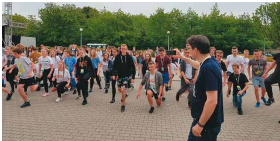
Jednym z warsztatów był taniec uliczny