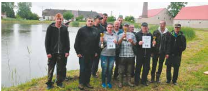
10 czerwca w Nosalach zawody rozgrywali dorośli

27 maja przy stawie zameldowało się 37 zaopatrzonych w niezbędny sprzęt i zanętę młodych wędkarzy. W działaniach wspierali, zwłaszcza młodszych, ich ojcowie i dziadkowie. Wędkowanie oka-