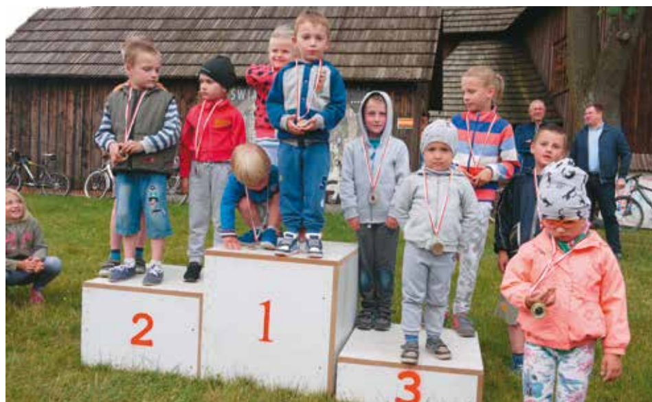
Najmłodszy uczestnicy wyścigu byli jednocześnie najliczniejszą kategorią