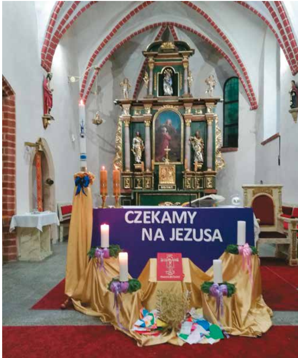
Adwentowa dekoracja w kościele parafialnym pw. św. Anny w Bralinie