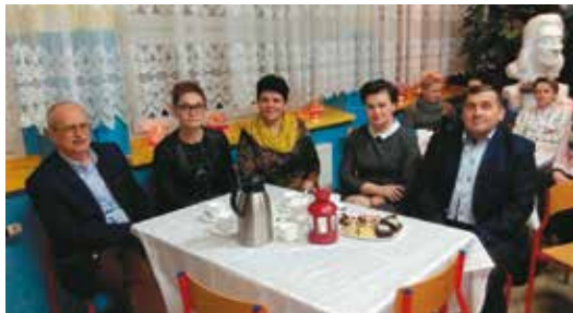
Organizatorzy i goście wieczoru poetyckiego