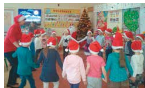
U przedszkolaków w Bralinie

prezentowały wiersze i piosenki oraz zaprosiły ich do wspólnej zabawy. Miłym akcentem było pamiątkowe zdjęcie z Mikołajem. Następnego dnia, tj. 6.12.2016 r., najstarsze przedszkolaki z grupy 5- i 6-latków, udały się autokarem do Kępińskiego Ośrodka Sportu i Rekreacji na widowisko słowno-muzyczne „Przybysze z planety Zangular”. Najmłodszy mogli podziwiać bajkową scenografię, efekty świetlne i wspaniałą grę aktorów. Uważni widzowie z pewnością zrozumieli przesłanie, jakie niosło ze sobą to przedstawienie – najważniejsze w życiu są: miłość, przyjaźń, dobroć i wrażliwość. Na zakończenie, jak to w mikołajki bywa, dzieci spotkały się z Mikołajem i zostały obdarowane prezentami.