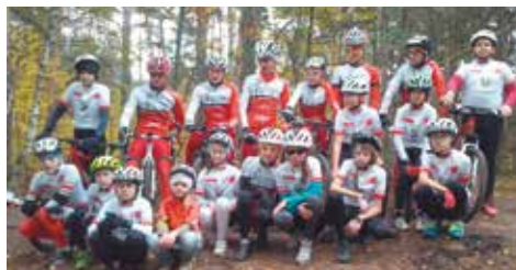
Ich pasją jest kolarstwo

Opieką trenerską klub obejmuje grupę około trzydziestu osób. Liczba ta jest płynna, bo jak wiemy, zainteresowania dzieci często się zmieniają. Rozpiętość wiekowa uczestników jest dość szeroka. Najmłodsza zawodniczka ma 7 lat, najstarsza – 17. Grupa 15 osób, uczniów szkoły podstawowej, uczestniczy w Narodowym Projekcie Rozwoju Kolarstwa, w ramach którego przez cały rok realizowane są zajęcia szkółki kolarskiej. 10 zawodników naszego klubu posiada licencje Polskiego Związku Kolarskiego i większość z tej grupy z dużą intensywnością rywalizuje w wyścigach kolarskich na arenie ogólnopolskiej. W mijającym roku zawodnicy UKS Sport Bralin zaznaczyli swoją obecność na 35 wyścigach, przy czym podkreślić należy, że imprezy te odbywają się wyłącznie w weekendy, więc większość sobót i niedziel w roku spędzili w drodze, przemierzając niemal całą Polskę wzdłuż i wszerz. Dzięki tej grupie mały, młody klub liczy się w kolarskich rankingach, a Bralin jest znany w świecie kolarskim. Dość powiedzieć, że w mijającym roku zajęliśmy 9. miejsce w Generalnej Klasyfikacji Drużynowej Pucharu Polski