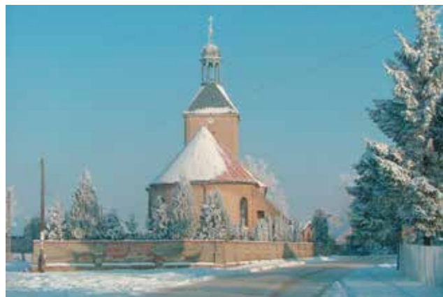
Zabitych żołnierzy pochowano we wspólnym grobie na przykościelnym cmentarzu od południowego wschodu, tuż przy ogrodzeniu. Mnichowice w styczniu 2009 r.