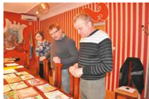
Jurorzy podczas oceny prac