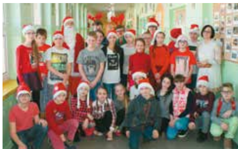
W szkole czuć już świąteczną atmosferę

Uczniowie naszej szkoły mogli uczestniczyć w Dniu Nauki, który składał się z warsztatów z robotyki oraz pokazów doświadczeń naukowych. Dzieci podczas warsztatów wkroczyły do świata lego robo-