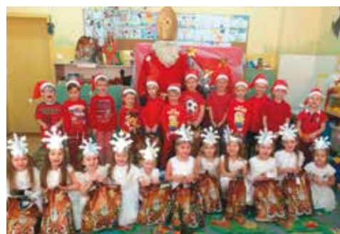
Święty Mikołaj u najmłodszych

Jak co roku przedszkole w Zespole Szkół w Nowej Wsi Książęcej odwiedził niezwykle gość - Święty Mikołaj! Długo oczekiwany gość wywołał uśmiech na twarzach przedszkolaków i został serdecznie przyjęty przez naszych milusińskich. Dzieci z błyskiem w oku spoglądały na Mikołaja,