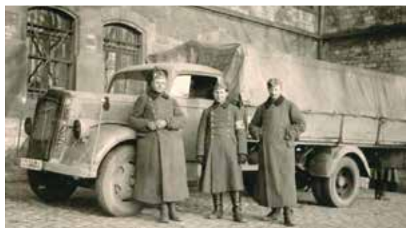
Może właśnie takim samochodem marki Opel Blitz 20 stycznia 1945 r. niemieccy żołnierze przyjechali do Mnichowic?

Jest 20 stycznia 1945 r. Sobota. Nie ma jeszcze 16.00, kiedy na drodze pomiędzy kościołem a szkołą w Mnichowicach zatrzymuje się ciężarówka. Żołnierze niemieccy, którzy nią przyjechali, wiedzą, że Rosjanie nieubłaganie podążają za nimi. Mimo to, zmęczeni, decydują się, by najbliższą noc spędzić właśnie tu, w Mnichowicach. Są głodni i przemarznięci, bo styczeń jest wyjątkowo mroźny. Ujemna temperatura utrzymuje się już wiele dni, spadając niezadko do minus 20-30 stopni poniżej zera.