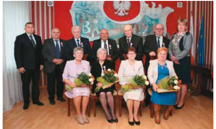
Pamiątkowe zdjęcie w sali sesyjnej UG Bralin

Nie każdemu jest dane przeżyć w związku małżeńskim 50 lat. Małżonkowie, którym życie tego nie poskąpiło i dało możliwość przeżycia ze sobą pół wieku, nagradzani są medalem „Za długoletnie pożycie małżeńskie” przyznawanym przez Prezydenta RP. W ten sposób święto rodzinne, jakim jest rocznica ślubu, staje się sprawą wagi państwowej. Z tej okazji 9 listopada br. Urząd Stanu Cywilnego w Bralinie zorganizował spotkanie, na którym wręczono jubilatkom przyznane medale.