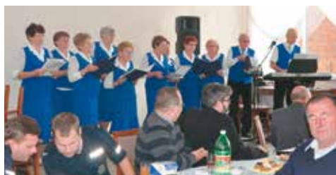
Zespół wokalny seniorów działa już 40 lat

Rok 2016 w bralińskim Oddziale Rejonowym PZERIu upłynął pod znakiem jubileuszu 40-lecia działalności zespołu wokalnego „Ale Babki”. Wrześniowa uroczysta gala z udziałem wielu znakomitych gości była wyrazem wdzięczności i uznania dla śpiewających seniorów. Zespół nie osiadł jednak na laurach, bo już w listopadzie wystąpił z powodzeniem na II Senioraliach w Wieruszowie. Rywalizacja była duża, bo o nagrody ubiegało się kilkanaście zespołów prezentujących różne formy artystyczne. Choć „Ale Babki” nie wystąpiły w pełnym składzie, to zasłużyły na uznanie. Gratulacje, oby tak dalej.