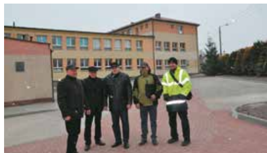
Podczas odbioru inwestycji

Inwestycja ta z całą pewnością jest spełnieniem oczekiwań mieszkańców Bralina i gminy, gdyż w dużym stopniu rozwiąże spore jak dotąd natężenie ruchu drogowego na rynku, blokady postojowe i często brak miejsc dla transportu osobowego,