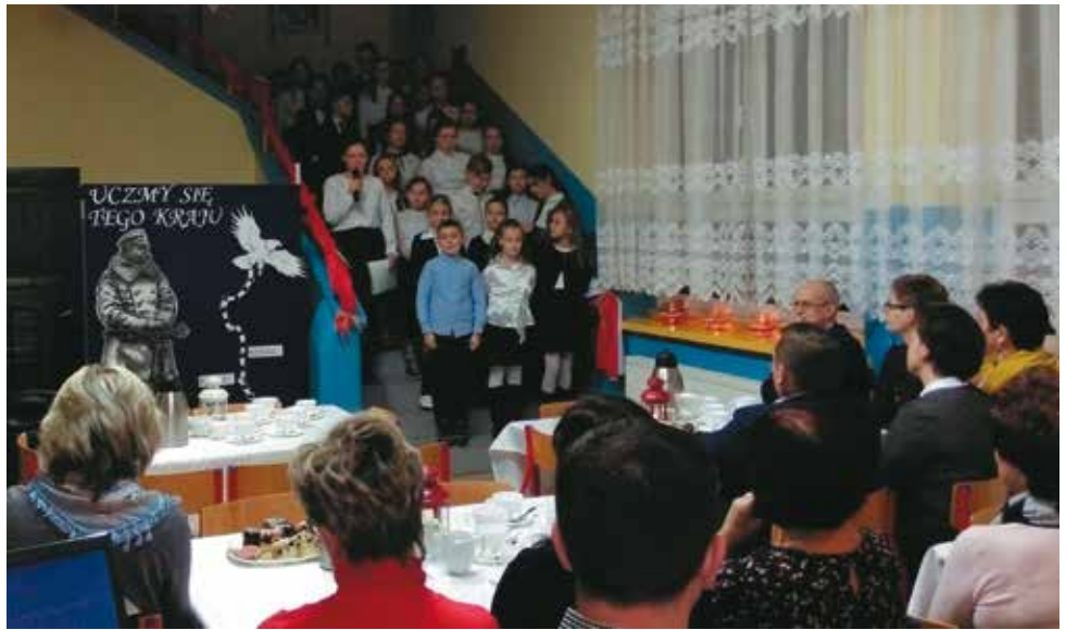
Spotkanie zorganizowano w holu szkoły