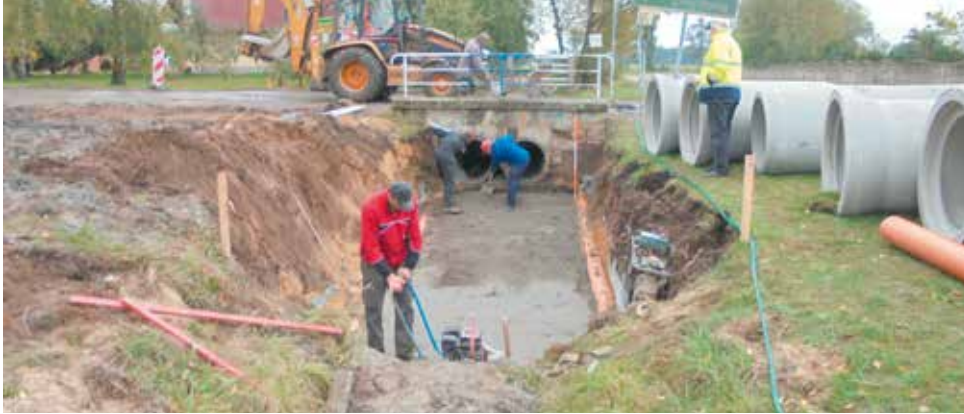
Prace w Weronikopolu dobiegły końca

Wyboista i nieprzyjazna użytkownikom droga zmieniła zupełnie swój dotychczasowy charakter. Przebudowano istnieją-