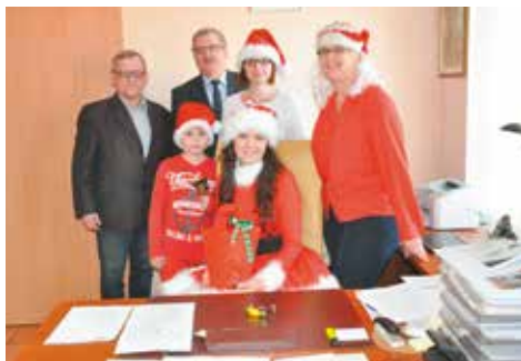
W Urzędzie Gminy Bralin

Wizyta zakończyła się w gabinecie włodarza gminy. red.