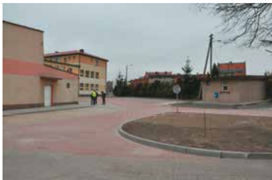
Przy szkole przygotowano 27 miejsc parkingowych

Wykonawca parkingu, tj. Firma Handlowo-Usługowa Andrzeja Kruszelnickiego z siedzibą w Rzetni zrealizowała m.in. roboty przygotowawcze, ziemne, regulację uzbromienia, wykonanie nowej konstrukcji nawierzchni jezdni manewrowych, zjazdów, zatok postojowych i chodnika, elementów