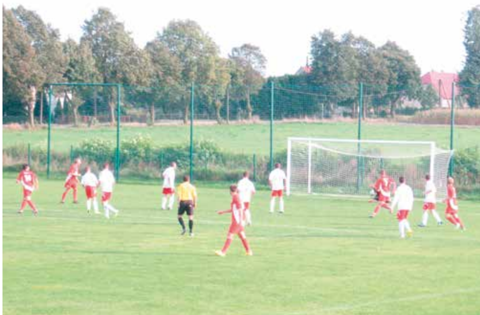
Mecz piłkarski na stadionie LKS „Sokół” Bralin